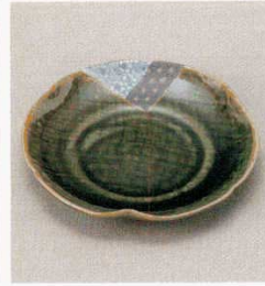
22407-564 織部友禅三ツ押皿 1,880円 60入 (18.5×2.8cm)