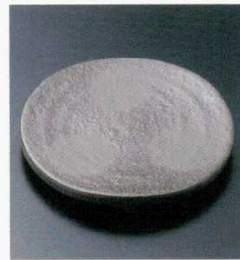
22418-134 炭化土丸6.0三ツ足平皿 1,700円 18.5×2.4cm