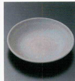
22422-664 黒彩6.0中皿(信楽焼) 1,760円 18.5×3.5cm