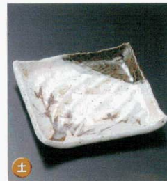
土 22423-174 オリベ古木前菜皿 1,680円 40入 (19.5×2cm)