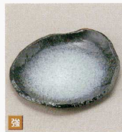
強 22416-554 雲海7.0変形皿 1,750円 40入 (21×18×2.5cm)