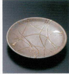
22404-554 潮吹玉淵6.0丸皿 1,900円 50入 (18.5×3.1cm)