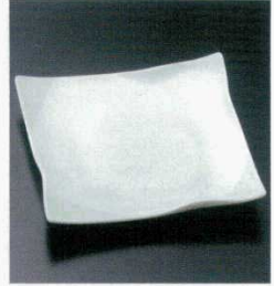
22405-294 イルタ青白磁18cm正角皿 1,900円 50入 (17.8×17.8×3cm)