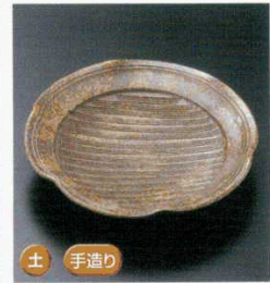
土 手造り 22425-104 茶備前串目7寸皿 1,650円 40入 (20×3.8cm)