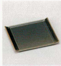
22413-134 ホーリー18.5cmプレート 1,800円 18.7×15.1×1.4cm