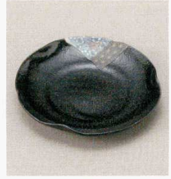
22410-564 黒織部友禅三ツ押皿 1,880円 60入 (18.5×2.8cm)