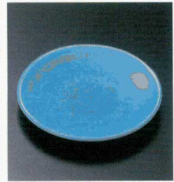
22420-314 トルコマット丸皿 1,700円 80入 (17.5×1.5cm)