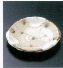
22419-574 山茶花渦皿 1,700円 16.8×16×2.3cm