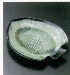
22421-264 鯛皿(緑) 1,700円 40入 (24×19.8×2.8cm)