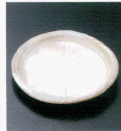
22424-184 御本手5.5皿 1,680円 40入 (17.5×3cm)