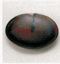
22409-104 漆釉ハス型6寸皿 1,850円 40入 (18.5×3cm)