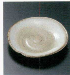
22417-294 手造風粉引吹三ツ足5.5皿 1,750円 80入 (17.3×2.5cm)