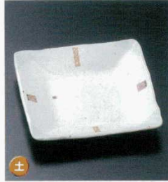
土 22403-304 赤絵四方小紋四角中皿 1,900円 80入 (16.3×16.3×2.7cm)