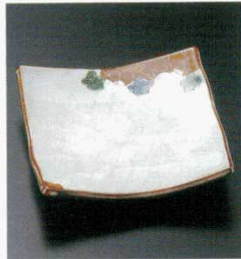
22401-184 雲錦正角7.0皿 1,900円 20入 (17×17cm)