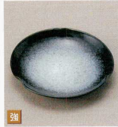
強 22402-554 雲海三ツ押6.0皿 1,950円 80入 (17.5×3.3cm)