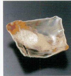
22412-314 嵯峨野変形前菜皿 1,800円 17.5×16×5cm