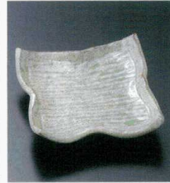
22414-164 かいらぎ四方上り前菜皿 1,800円 60入 (15.6×4.5cm)