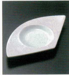
22406-164 ピンク扇前菜皿 1,800円 120入 (21.5×12×2cm)