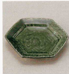
22411-184 オリベ六角皿 1,850円 30入 (21.5×19.5×3.5cm)