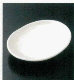
22925-574 クラフト粉引楕円皿(小) 410円 (16.2×12.8×2.8cm)