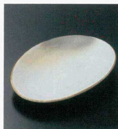
22919-274 風紋手引たわみ6.5楕円皿 550円 60入 (20×14.5×2.5cm)