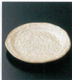
22913-024 桃山荒石目17cm丸皿 650円 60入 (17×2cm)