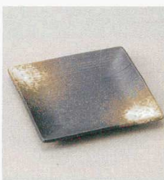
22923-524 京備前正角皿 520円 60入 (15×15×1.7cm)