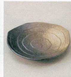
22910-294 黒備前吹き三角6.0皿 680円 60入 (19.5×3.2cm)