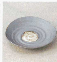
22915-264 鉄袖三角六兵衛5寸皿 650円 80入 (16.8×2.8cm)