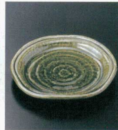
22909-314 織部玉瀾取皿 670円 100入 (17.7×17.7×2.6cm)