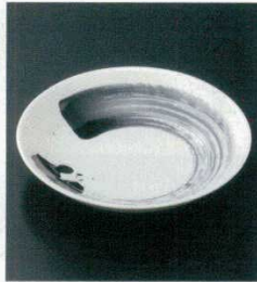
22907-134 白一文字6.0深皿 680円 60入 (20.2×3.8cm)