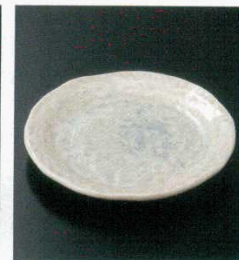
22905-314 灰貫入丸皿 650円 100入 (17×2.5cm)