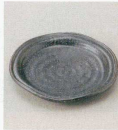
22908-314 天正黒玉瀾取皿 670円 100入 (17.7×17.7×2.6cm)