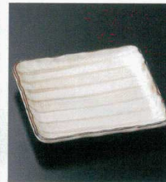
22904-554 茶刷毛正角皿 750円 50入 (16.7×16.7×3cm)