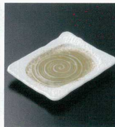
22914-024 鳴門しぶき7.0長角皿 650円 40入 (18×14.5×2.5cm)