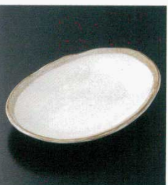
22921-554 瀧ラインフルーツ皿 500円 60入 (21.2×15×3.3cm)