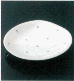
22906-454 氷雨たわみフルーツ皿 690円 80入 (16.5×15×2.5cm)