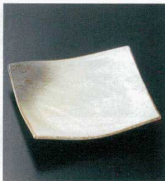
22912-274 風紋手引正角5.5皿 650円 50入 (17.3×17.3cm)