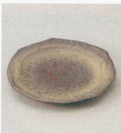
22917-024 ダイア6.0皿 590円 60入 (19.5×18.5×2.3cm)