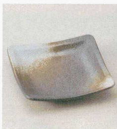
22918-234 潮騒正角向付 560円 60入 (16×16×3cm)