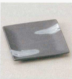
22922-574 白雲正角フルーツ皿 520円 (15×1.5cm)