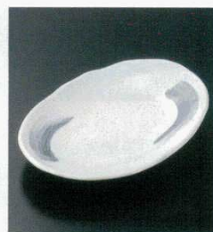
22920-554 藍彩小判皿 550円 60入 (21×14.8×3cm)