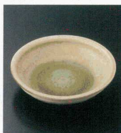
22924-574 錆織部玉瀾5.0深皿 410円 100入 (16.5×3.8cm)