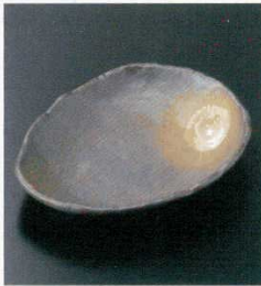
22901-574 おぼろ備前7.0変形皿 750円 (20.5×15.8×2.5cm)