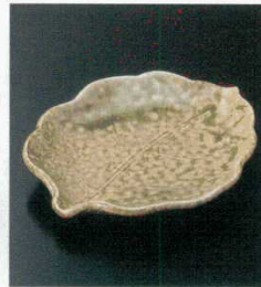
22903-134 落葉銘々皿 700円 50入 (19.3×15.5×3cm)