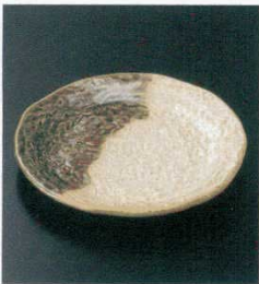
22911-314 桃山丸皿 650円 100入 (17×2.5cm)