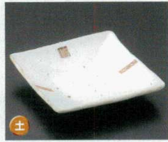
23207-304 赤絵四方小紋四角銘々皿 1,450円 100入 (13.5×13.5×2.7cm)