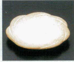
23229-474 志野袖4.8皿 400円 100入 (15×2cm)