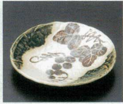
23214-564 織部ぶどう5.0丸皿 1,100円 80入 (15.8×2.3cm)