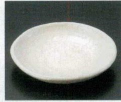
23227-524 白志野5.0丸皿 450円 80入 (15×2.4cm)