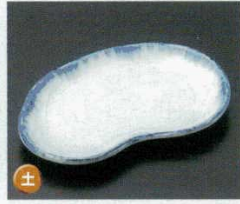
23223-174 呉須刷毛変形皿 600円 100入 (17.8×12.2×1.8cm)