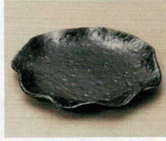
23230-174 ブラック取皿 380円 80入 (15.5×2cm)