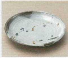
23208-054 かいらぎ丸皿S 1,400円 120入 (15.8×2.5cm)