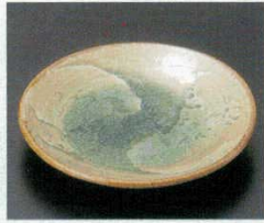
23213-524 緑雲5.0丸皿 1,200円 80入 (16.5×2.7cm)