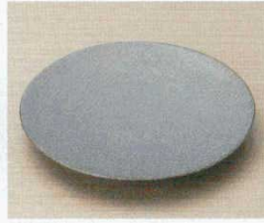
23218-304 鉄ペーパー高台5寸皿 930円 80入 (16×16×1.9cm)