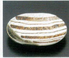
23226-524 織部十章6.0小判皿 440円 80入 (15.5×13.3×2.5cm)