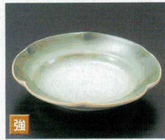
23206-554 緑彩花型丸皿 1,450円 60入 (15×3cm)