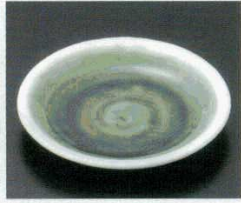
23219-164 織部5寸皿 920円 60入 (16.6×2.5cm)