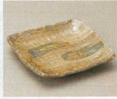
23224-314 黄瀬戸オリベ四角とり皿 530円 100入 (15.5×15.5×2cm)