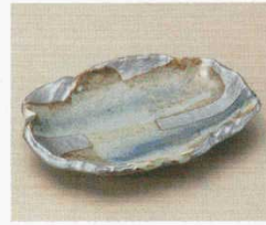
23221-654 黒のふ5号変型長角皿(萬古焼) 650円 80入 (16.5×12.5×2.5cm)