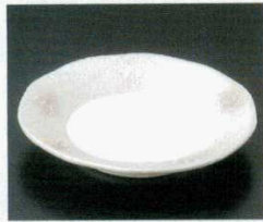
23201-254 ラスター小花フルーツ皿 1,850円 80入 (15.5×3.5cm)