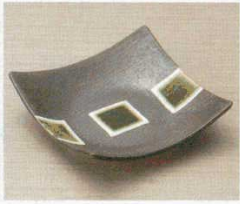
23210-564 黒織部モダン正角深皿(小) 1,380円 60入 (12.5×12.5×3cm)