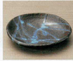
23222-134 黒釉桂川丸5.0皿 600円 (15.2×15.2×2.6cm)