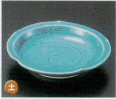
23205-144 緑釉フルーツ皿 1,450円 80入 (15×3cm)