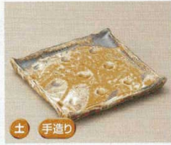
23202-514 山吹釉角銘々皿 1,750円 60入 (13×13×1cm)