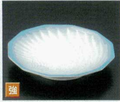
23203-554 ブルー吹き5.0皿 1,550円 100入 (15×2.3cm)