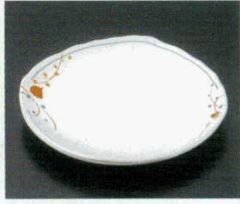
23225-444 花ごころ5.0皿 520円 100入 (16×15.5×2.3cm)