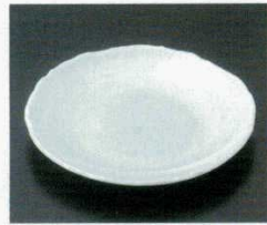
23211-454 青白測切5寸丸皿 1,350円 80入 (16×1.6cm)