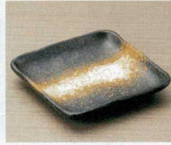
23228-524 京備前正角中皿 420円 100入 (13.9×13.9×2cm)