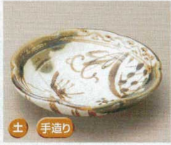
23204-514 織部花4.5皿(手造り) 1,500円 80入 (14×2.5cm)