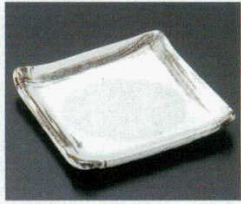
23209-664 鉄刷毛目5.0正角皿(信楽焼) 1,380円 (14.5×14.5×2cm)