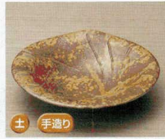
23212-104 茶備前片押取皿 1,200円 60入 (16.5×4cm)