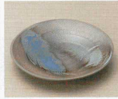
23217-314 雲海芦5.0丸皿 970円 100入 (16×2.3cm)