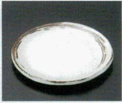
23215-664 鉄刷毛目5.0丸皿(信楽焼) 1,100円 (15×2cm)