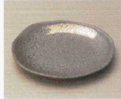
23411-574 金刷毛銘々皿 980円 (15×14.7×1.8cm)