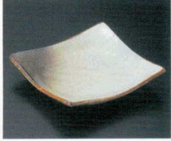
23430-274 風紋手引正角4.5皿 380円 80入 (13.7×3.2cm)