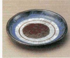
23416-284 瀬紺巻5.5皿 820円 80入 (16.5×2.2cm)