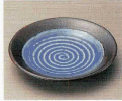
23407-144 鉄砂コス5.5皿 1,050円 60入 (16.6×3cm)