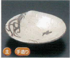
23403-454 古染八角山水取皿 1,350円 80入 (14×13.5×2cm)