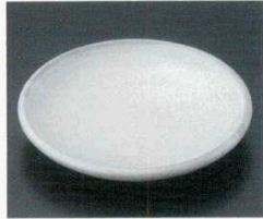
23402-054 粉引き丸皿S 1,350円 120入 (15.8×2.5cm)