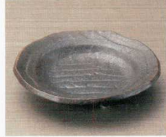
23422-234 黒三つ足銘々皿 650円 (15×3cm)