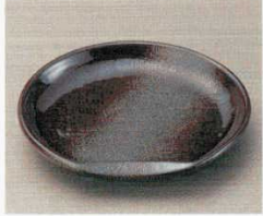
23419-524 備前灰釉5.0判月皿 740円 120入 (14.8×14.5×2.5cm)