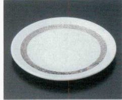
23412-144 銀彩5.0皿 950円 60入 (15.2×1.5cm)