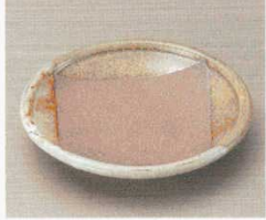
23424-264 信楽フルーツ皿 600円 80入 (15.3×2.4cm)