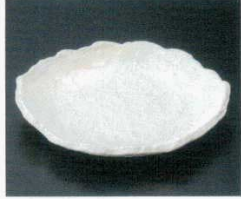
23429-644 白地うす潮5号皿(萬古焼) 500円 80入 (17.2×15.2×2.8cm)