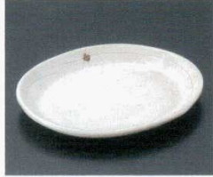
23423-554 粉引点彩小判皿4.5 650円 100入 (12.5×16×1.5cm)