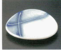
23426-524 一珍青吹格子三角皿 520円 120入 (13.8×13.6×1.8cm)