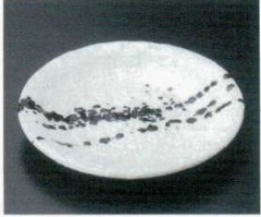
23425-274 吹あそび石目5.0皿 530円 100入 (16×2.5cm)