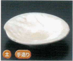
23404-104 波千鳥片押取皿 1,100円 60入 (16.5×4cm)