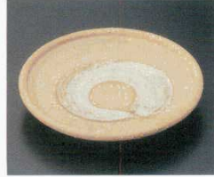
23427-264 伊賀ハケメ丸5.0皿 520円 80入 (15.3×2.4cm)