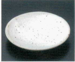
23409-314 粉引フルーツ皿 990円 80入 (15.3×2.5cm)