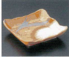
23418-254 信楽風正角皿 780円 80入 (14×14×3.5cm)