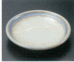
23428-264 青磁均窯流し丸5.0皿 520円 80入 (15.3×2.4cm)