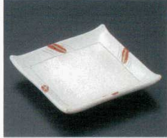
23413-454 粉引トクサ正角4寸皿 900円 80入 (13×13×2.5cm)