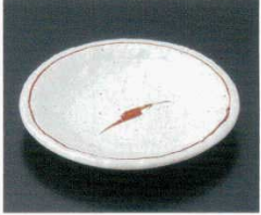
23420-024 唐辛子5.0皿 720円 90入 (16×2cm)