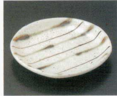
23406-524 二色ストライプフルーツ皿 1,050円 80入 (16.5×2.5cm)