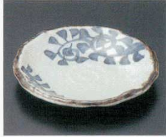
23408-144 タコ唐草5.0皿 1,050円 80入 (16.7×15.7×2.5cm)