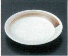
23415-454 和さび5.0寸丸皿(特白磁) 840円 100入 (14.1×2.1cm)