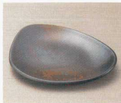
23525-134 備前吹おにぎり型皿 480円 60入 (17.6×14.5×2.2cm)