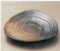
23526-294 黒備前吹き三角5.0皿 420円 100入 (16.3×2.7cm)