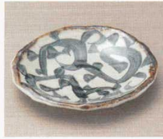
23508-294 新タコ唐草5.0皿 1,050円 30入 (16.5×2.5cm)