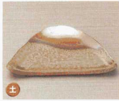
23506-304 あけぼの三角銘々皿 1,100円 100入 (17×12.5×15cm)