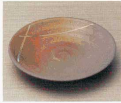
23507-314 黒泥一珍丸皿 1,100円 80入 (15.4×2.3cm)