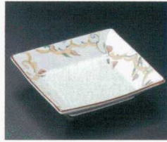
23510-454 錦唐草角取り皿 1,000円 100入 (14×3cm)