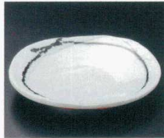
23519-134 黒結び5寸皿 600円 (15.6×14.6×2.9cm)