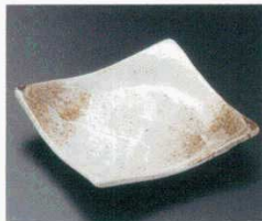
23529-174 雪志野正角4.5皿 360円 120入 (13.7×3.2cm)