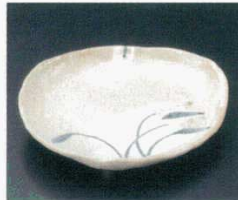
23514-574 みのり三ツ足中皿 700円 80入 (16.3×15×3.2cm)