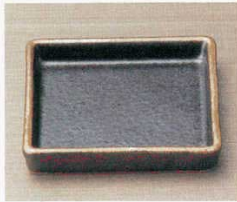
23501-024 いぶし金正角5.0皿 1,350円 60入 (13×13×2cm)