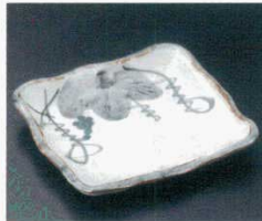
23513-314 粉引ぶどう角皿 720円 100入 (13.7×1.5cm)