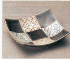
23504-574 織部市松銘々皿 1,500円 10入 (12.2×12.2×3cm)