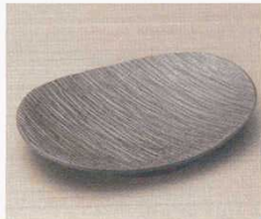
23512-174 炭化土オパールデザートソーサー 880円 60入 (16.8×12×2.3cm)