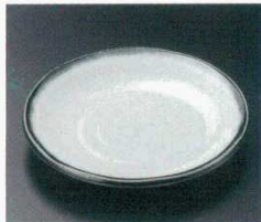
23530-474 白均窯4.5取皿 300円 100入 (14×2.5cm)