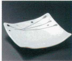
23520-274 流星正角皿中 570円 100入 (13.5×13.5cm)