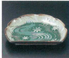
23515-114 半月流水モミジ銘々皿 700円 100入 (15×12.5×2.3cm)