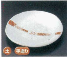
23502-304 粉引赤絵帯銘々皿 1,350円 100入 (14.5×14×2cm)