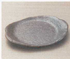
23523-234 黒一服皿 430円 (16×13×2cm)