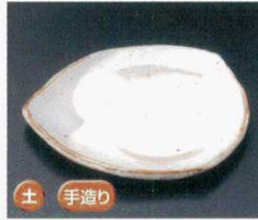
23503-304 粉引刷毛目銘々皿 1,350円 80入 (14.4×14.5×1.5cm)