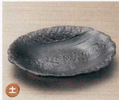
23517-304 黒釉石目楕円皿小 650円 80入 (17×14×2.5cm)