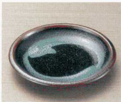
23527-134 磯彩天目取皿 400円 (14.2×2.3cm)