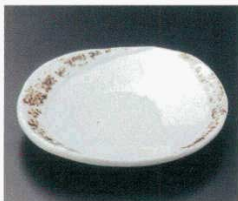
23522-104 磯部石目取皿 510円 100入 (15.8×14.5×2.8cm)