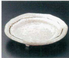
23518-234 輪織部三つ足銘々皿 650円 (15×3cm)