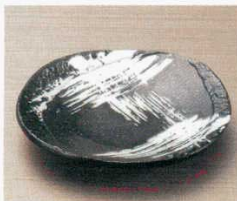
23521-294 黒地白刷毛目石目取皿 540円 100入 (15.8×14.8×2.5cm)