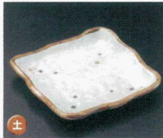
23511-304 粉引かすみ草角皿 910円 100入 (14.5×14.3×2.5cm)