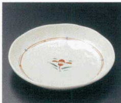
23528-204 花点紋4寸皿 360円 150入 (13.7×2.3cm)