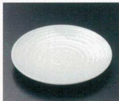
23524-454 白釉千段丸皿 420円 120入 (13×1.8cm)