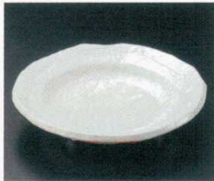
23516-454 白釉三つ足丸皿 680円 60入 (16×3cm)