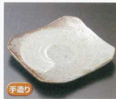
23910-574 粉引刷毛正角4.0銘々皿 1,000円 (10.8×1.5cm)