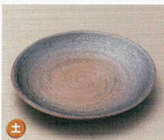
23921-174 焼締4.8皿 700円 100入 (15×2cm)