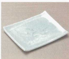
23923-284 青白磁つゆ草角銘々皿 630円 80入 (15×12.5×1.2cm)