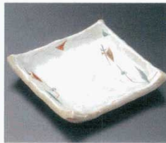
23908-544 ツユ草4.0正角銘々皿 1,200円 80入 (12.5×12.5×2.3cm)