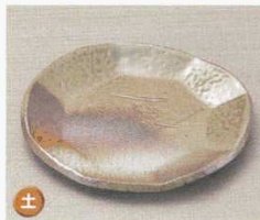
23912-304 あけぼの八角銘々皿 910円 100入 (13×13×1.5cm)