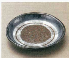
23930-284 洲紺巻4.5皿 630円 100入 (13.8×2.2cm)