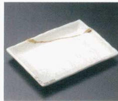
23909-554 月と川長角銘々皿 1,050円 150入 (14×10.5×1.8cm)