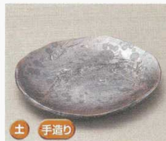
23914-304 南蛮潮騒楕円銘々皿 910円 100入 (15×12.5×2cm)