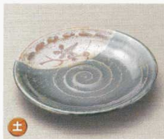
23917-134 志野織部銘々皿 860円 120入 (13.8×2.2cm)