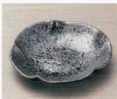
23922-454 黒一吹輪花皿 700円 60入 (14.5×2.9cm)