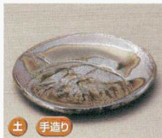
23913-304 唐津椿円皿 910円 60入 (15×12.5×2cm)