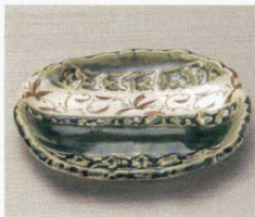
23911-574 織部唐草小判和皿 950円 (15.5×13.3×2cm)