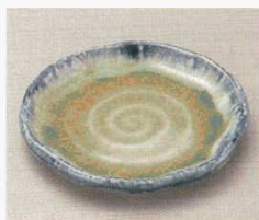
23924-524 灰釉流し銘々皿 680円 100入 (13.2×13.2×2cm)