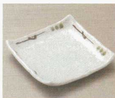
23925-544 織部結び4.0正角銘々皿 690円 80入 (12.5×12.5×2.3cm)