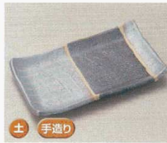
23907-514 黒袖十草変形取皿 1,000円 80入 (13×9.5cm)