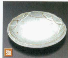
23905-554 グリーン吹カゴメ銘々皿 1,300円 100入 (12.5×1.8cm)