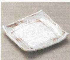
23927-544 志野タタキ4.0角皿 690円 80入 (12.5×12.5×2cm)