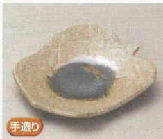
23916-114 葉形織部流し銘々皿 (手造り) 880円 100入 (13.5×2cm) ※手造りの為、多少寸法が異なる場合があります。