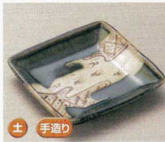
23901-514 織部ツバメ銘々皿 1,950円 60入 (12×2cm)