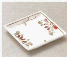
23920-524 赤絵小花銘々皿 730円 120入 (11.8×11.8×1.6cm)