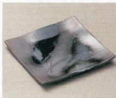
23918-314 雲海芦銘々皿 830円 100入 (12.5×1.5cm)