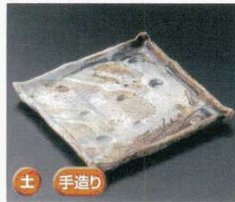
23903-514 水墨彩角銘々皿 1,750円 60入 (13×13×1cm)