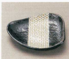
23929-444 黒結晶小紋三角皿 630円 100入 (14×13×2cm)