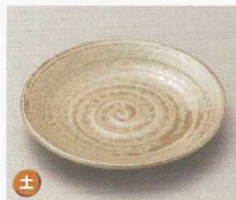
23919-134 灰釉古代取皿 820円 120入 (13.8×2.2cm)