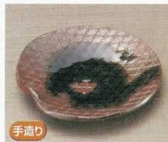
23915-114 南蛮流し銘々皿 (手造り) 880円 100入 (13×2cm) ※手造りの為、多少寸法が異なる場合があります。