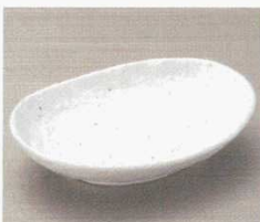
23928-024 石目粉引5.0小判皿 630円 150入 (15.8×11.8×3.5cm)