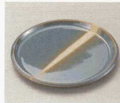
23904-664 緑袖ストライプ4.5丸皿 (信楽焼) 1,650円 (13.5×1.5cm)