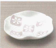
23926-554 ピンク刷毛小花銘々皿 630円 100入 (12.5×12.5×2.5cm)