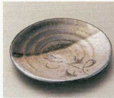
23902-444 古織部銘々皿 1,850円 80入 (14×1.5cm)