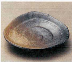
24116-294 黒備前吹き三角3.5皿 330円 120入 (12×2.3cm)