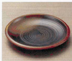
24119-274 朱金彩4.0皿 280円 100入 (14.2×2cm)