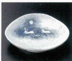
24130-124 吹墨うさぎ3.5皿 210円 200入 (12×2.3cm)