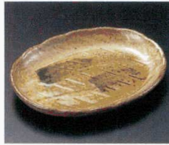
24102-314 黄瀬戸オリーブめ皿(大) 390円 140入 (13.4×10.3×1.6cm)