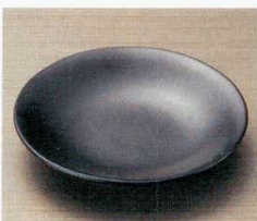
24128-274 黒映4.0皿 230円 160入 (14×2.2cm)