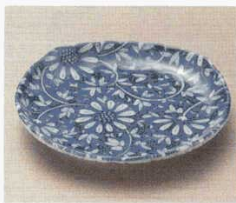
24118-474 藍華4.0銘々皿 300円 120入 (12.5×12×2cm)