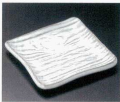
24117-454 白木目銘々皿 320円 80入 (12.8×12.8cm)