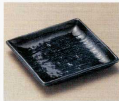
24115-164 海碧四角皿 340円 120入 (12×12×2cm)