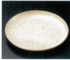
24108-274 いにしえ(粉引)4.0皿 380円 120入 (13.5×2cm)