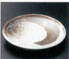
24127-274 志野サビ刷毛3.5皿 250円 150入 (12.4×2cm)