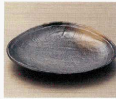
24110-474 黒備前金茶吹三角小皿 370円 120入 (13.7×11.5×2cm)