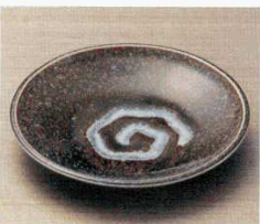
24126-274 渦織部3.5皿 250円 150入 (12.4×2cm)