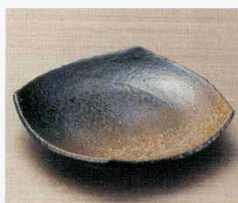
24124-474 黒備前吹4.0銘々皿 280円 200入 (12.5×12.5×2.3cm)