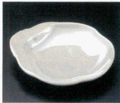
24112-164 パールラスター小皿 360円 180入 (12.5×11.2×2.3cm)