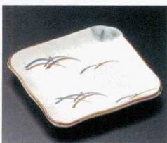
24122-524 武蔵野銘々皿 280円 100入 (12×12×1.5cm)