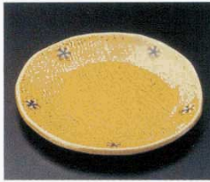
24101-414 黄瀬戸印花銘々皿 400円 80入 (13×1.2cm)