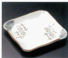
24120-524 織部格子銘々皿 280円 100入 (12×12×1.5cm)