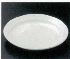
24129-554 雪粉引4.0皿 220円 150入 (14×2cm)