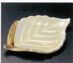
24123-524 桑葉銘々皿 280円 100入 (12×12×1.5cm)