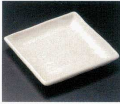
24106-524 白志野銘々皿 380円 100入 (12×12×1.5cm)