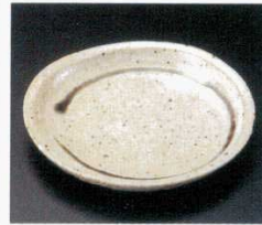
24104-234 輪織部変形丸皿 380円 (13×1.6cm)