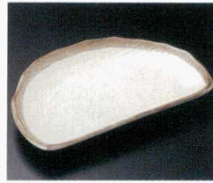
24109-554 刈ライン半月取皿 380円 80入 (16.5×10.5×2.2cm)