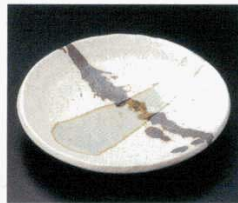
24114-574 湧水捨り4寸皿 350円 (13.3×2.4cm)