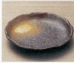
24107-574 おぼろ備前足付丸皿 380円 (13×1.9cm)