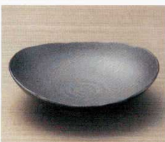
24121-474 黒楕円皿(小) 280円 120入 (13.2×12×3.6cm)