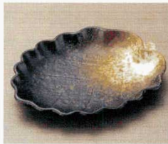
24113-524 京備前木の葉皿 350円 120入 (13.7×11×1.8cm)