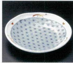
24103-294 麻の葉4.0皿 380円 100入 (13.5×2.3cm)