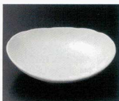
24125-474 白楕円皿(小) 280円 120入 (13.2×12×3.6cm)