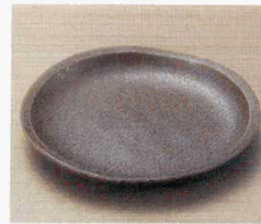
24105-234 黒変形丸皿 380円 (13×1.6cm)