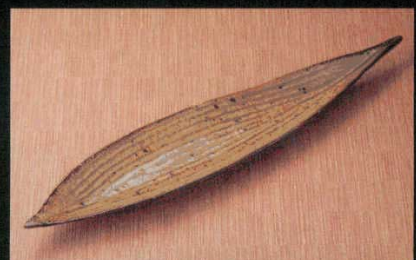
25116-454 織部錆散し葉型48cmオードブル 2,900円 20入 (48×10.5×2.8cm)