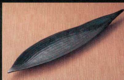
25115-454 いぶし黒葉型48cmオードブル 2,900円 20入 (48×10.5×2.8cm)