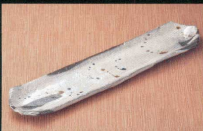
25111-054 かいらぎ六角長皿 4,300円 12入 (38.8×8.5×1.2cm)