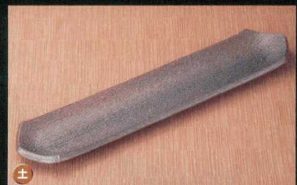
25112-144 かいらぎ錆散し六角長皿 3,900円 30入 (39.5×9cm)