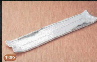
25108-454 洪草灰釉手越し50cmオードブル 3,600円 30入 (49.5×9.3×2.3cm)