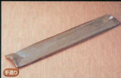
25107-174 定窯一珍尺2前菜皿 2,650円 30入 (38×8.8×7.3cm)