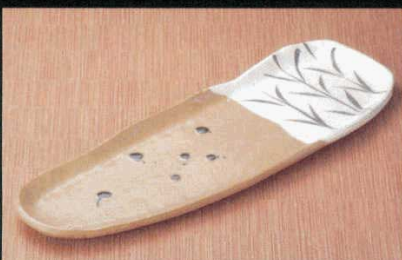
25114-574 白化粧錆絵変形長皿(大) 2,200円 (38×13.5×2.5cm)