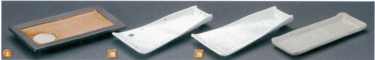
25704-554 測金ブルー前菜皿 2,100円 50入 (22.7×7×3.5cm)