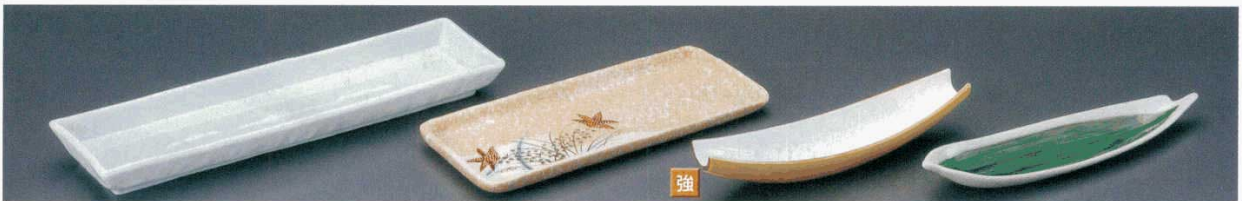
25712-114 風紋付出血 (手造り) 2,000円 40入 (23×10cm) ※手造りの為、多少寸法が異なる場合があります。