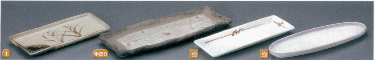
25716-254 笹形付出血 1,980円 100入 (24.5×6.8×3cm)