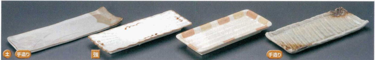
25708-664 灰釉マット7.5布目長角皿 (信楽焼) 2,100円 (22.8×8.2×2cm)