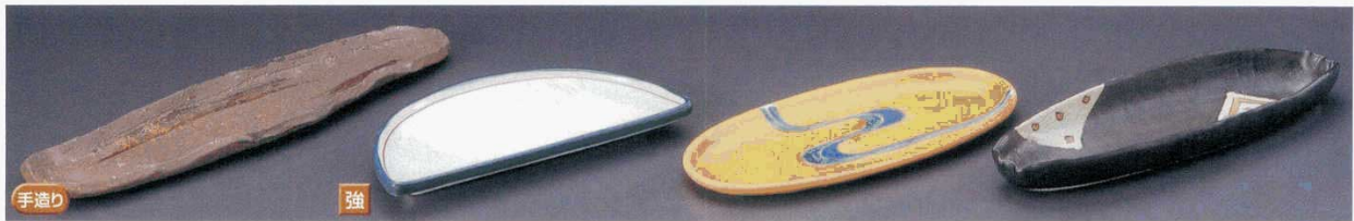
手造り 25905-114 金差し付出し(手造り) 1,400円 60入 (32×7.5cm) ※手造りの為、多少寸法が異なる場合があります。