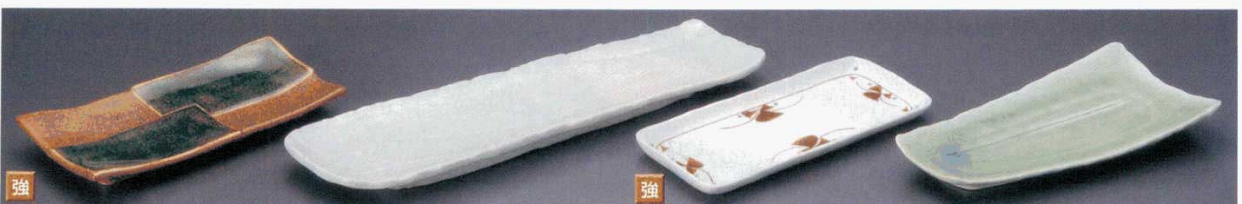
強 25921-524 南蛮市松突出皿 1,330円 60入 (21.2×9.7×2.3cm)