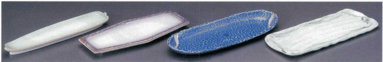
25909-164 若草吹篋型突出皿 1,450円 80入 (26×6×2cm)