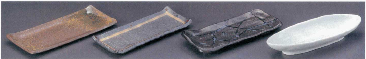
25913-524 南蛮織部掛鮎皿 1,350円 40入 (25.2×10.5×2cm)