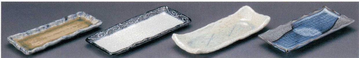
26113-524 灰釉流し突出皿 880円 60入 (20.8×8×1.7cm) 26114-554 呉須ライン唐草突出皿 860円 50入 (24×10×2cm) 26115-314 灰貫入長皿(小) 850円 40入 (22.5×9×2.5cm) 26116-034 清流7.0突出皿 850円 (22×9.5×2cm)