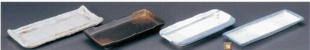
26117-544 志野タタキ突出皿 940円 48入 (24.5×9.5×2cm) 26118-454 焼ノ突出皿 840円 60入 (21×9.5×2.2cm) 26119-524 かもめ突出皿 830円 60入 (21×9.6×2.3cm) 26120-554 シンプルライン突出皿 820円 60入 (22.7×7.8×1.7cm)