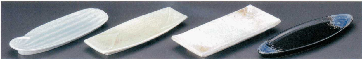
26105-024 青白磁流葉突出皿 930円 60入 (24.8×9×2cm) 26106-024 もえぎ折笹突出皿 930円 60入 (23.5×9×2.2cm) 26107-034 桜志野突出皿 920円 (22.5×9.5×2.5cm) 26108-284 磯部舟型突出皿 920円 80入 (22.5×7.8cm)