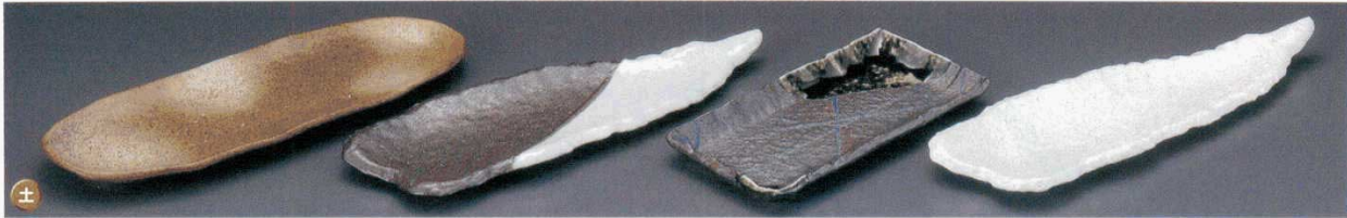
26101-304 備前吹長楕円皿 970円 50入 (31.6×10.8×1.8cm) 26102-284 ヌリ分剣皿 960円 40入 (30×10×1.5cm) 26103-524 南蛮乱十草突出皿 950円 40入 (20.5×10.3×1.8cm) 26104-204 白スバタやよい剣皿 930円 30入 (30×10×1.5cm)