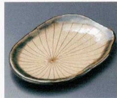
26420-574 織部内筋楕円取皿(手描き) 750円 (17.5×12.6×1.5cm)