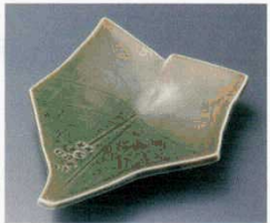
26409-254 オリペー葉皿 1,080円 60入 (18.5×14.5×2.8cm)