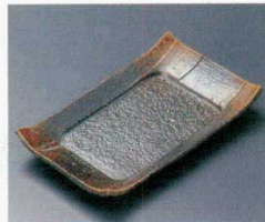
26411-454 やぎしめ5.5長角四方皿 1,150円 80入 (16.8×10×2.5cm)