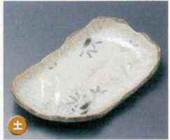
26419-514 花小道変形長皿 700円 80入 (18×11×1.5cm)