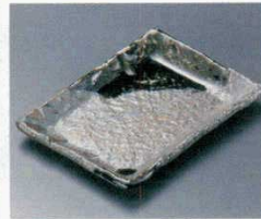
26426-524 南蛮乱十草長角銘々皿 660円 120入 (14.5×11.2×1.8cm)