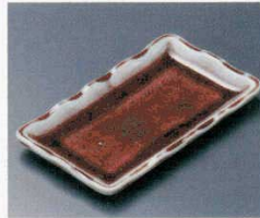
26417-264 辰砂のり皿 800円 80入 (17.2×10.1×1.4cm)