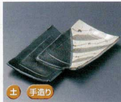
26407-164 黒織部十草重ね皿 2,100円 60入 (18.2×12.5×2.8cm)