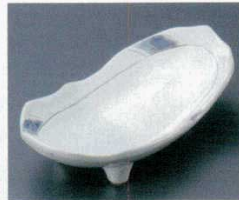
26416-204 紫式部変形三ツ足皿(中) 840円 100入 (18×8.5×4.3cm)