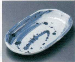
26418-134 筆遊び玉淵6.5小判皿(軽量磁器) 780円 (18.6×11.6×2.2cm)