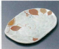
26413-544 赤絵木の葉小判形取皿 1,250円 80入 (17.5×13×1.5cm)