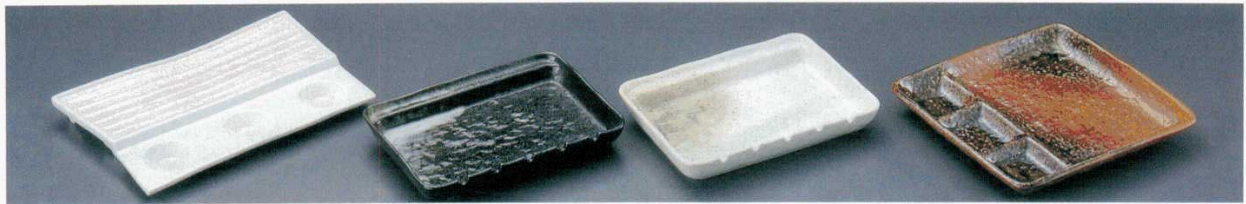
26401-144 ラスター一段付三品盛 3,300円 30入 (28×18.5×3cm)