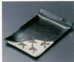
26406-454 黒織部串取皿 1,280円 80入 (14.5×9.5×2.5cm)