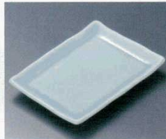
26412-414 青白磁6.0のり皿 1,150円 80入 (15.8×11.8×2.4cm)