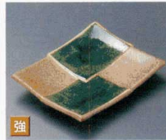
26421-524 南蛮市松のり皿 720円 80入 (12.7×10.2×2.1cm)