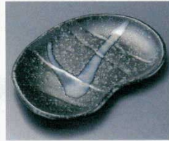
26428-574 そら豆皿黒 620円 (17.8×12.3×1.2cm)