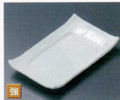
26410-454 白磁5.5長角四方皿 1,150円 80入 (16.8×10×2.5cm)