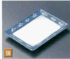
26423-524 梅づくしのり皿 780円 180入 (13.8×10.5×1.7cm)