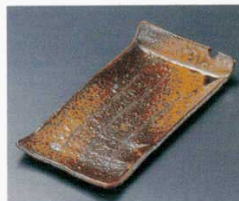
26405-454 灰吹串取皿 大 1,850円 60入 (19.5×9.5×2cm)