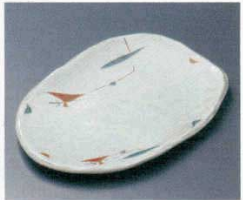
26414-544 ツユ草小判形取皿 1,200円 80入 (17.5×13×1.5cm)