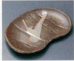
26429-574 そら豆皿茶 620円 (17.8×12.3×1.2cm)