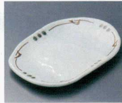
26427-544 織部結び小判形取皿 690円 80入 (17.5×13×1.5cm)