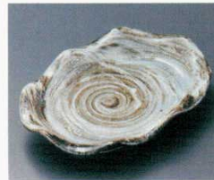
26425-034 白刷毛均窯花型小判皿(小) 680円 (16.1×11.6×2.8cm)