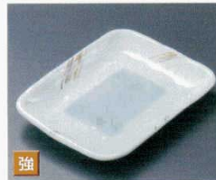
26415-554 青地タタラ色十草長角銘々皿 950円 120入 (15×11.8×2cm)