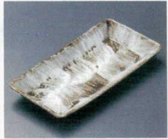
26424-474 荒刷毛目のり皿 680円 120入 (16.8×8.6×1.8cm)