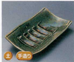
26408-204 織部ソギ銘々皿 1,400円 40入 (16.5×11×3.1cm)