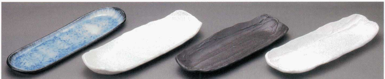
26713-234 清流水大長皿 1,550円 30入 (38.7×12.3×1.5cm)