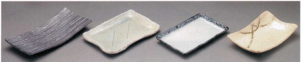
26709-234 黒まな板皿 2,150円 30入 (31×16×4.5cm)