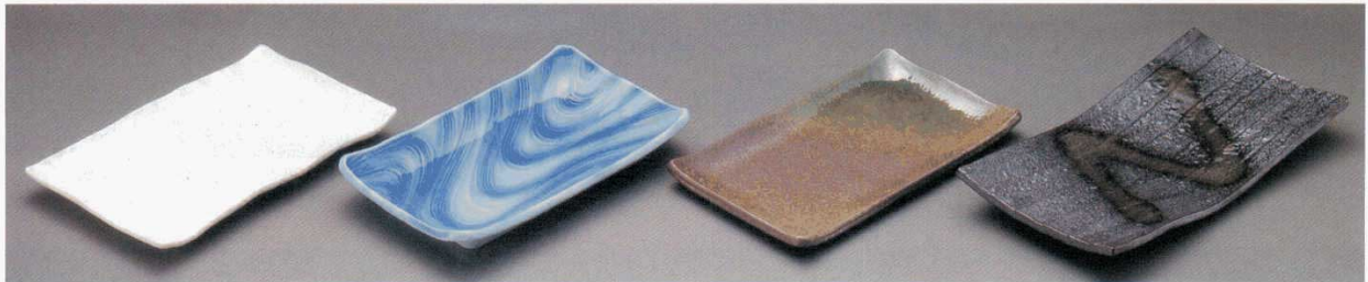
26705-174 新粉引18.0長角皿 2,500円 30入 (26×17.5×2.8cm)