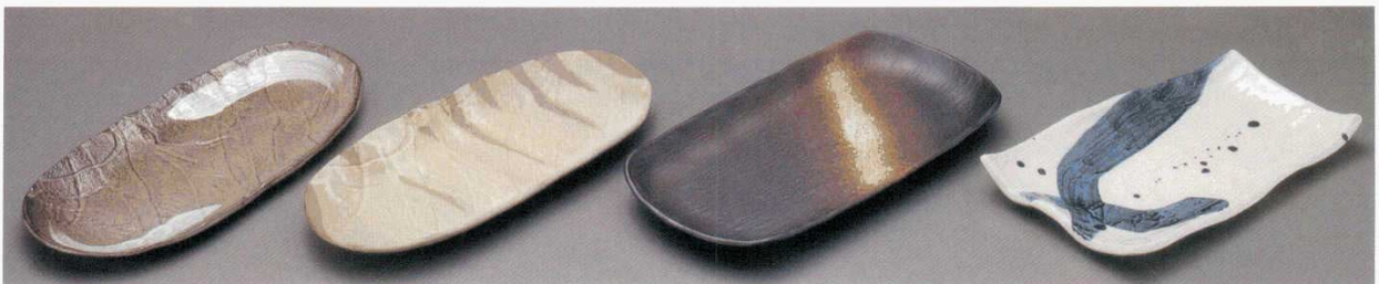
26717-134 粉引刷毛目楕円長皿 1,480円 30入 (32.5×15.5×3cm)