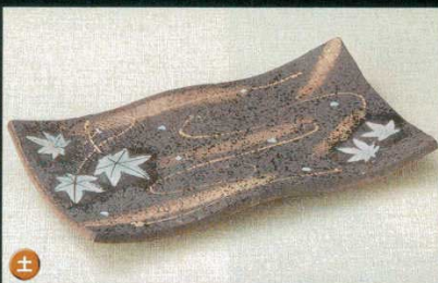
± 27312-174 焼メ流水紅葉焼物皿 3,000円 40入 (24.7×13.2×3.8cm)