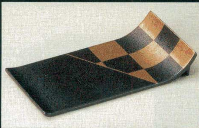
27308-024 金彩市松焼物皿 3,180円 40入 (23.5×12.5×3.8cm)