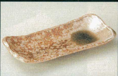
27311-664 灰釉足付長方皿(信楽焼) 3,000円 (25×11.5×4cm)