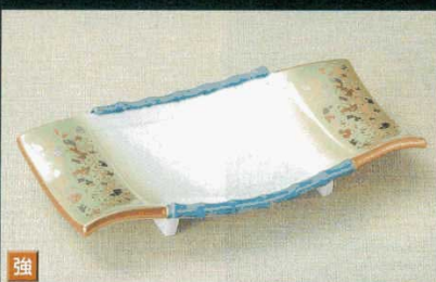
強 27315-554 ヒワ吹金銀彩8.0焼物皿 2,400円 50入 (22×13×3cm)