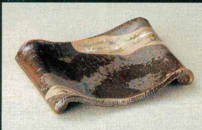
27309-114 南蛮風金彩焼物皿 3,100円 40入 (18.5×14.5×3.5cm)