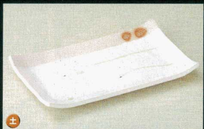
± 27313-174 火色もえぎ散らし角皿 3,000円 20入 (23×13×1.8cm)