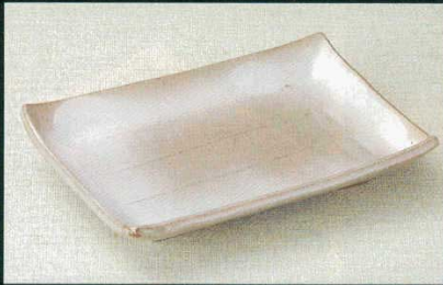
27304-294 手造風粉引吹焼物皿 3,300円 40入 (21.8×15.5×4cm)