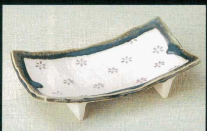
27316-554 織部花小紋まな板皿 2,300円 30入 (22×12×5.4cm)