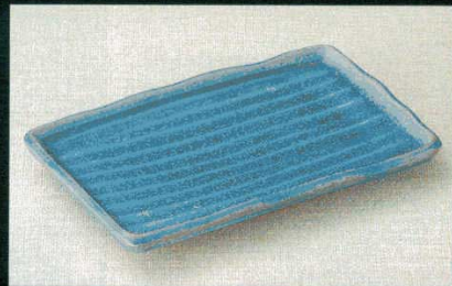
27307-144 トルコ波測焼物皿 3,200円 30入 (23×14.7×3cm)