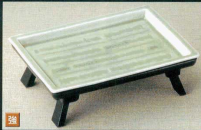
強 27305-144 ヒワ中彫焼物皿 3,300円 30入 (23.8×16.5×2cm) 27306-144 折りたたみプラスチック台 1,600円 100入 (23.5×16.5×7cm)