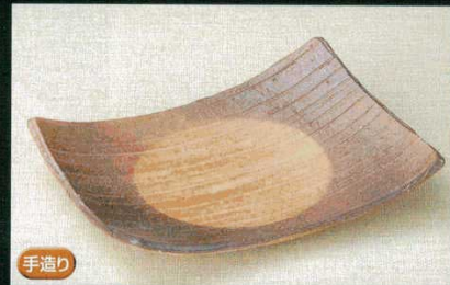
手造り 27303-574 焼締7.0長角皿 3,400円 (21.5×16×4cm)