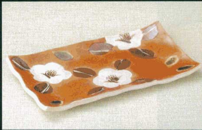
27301-524 赤濃山茶花焼物皿 3,450円 30入 (24×13.5×2.5cm)