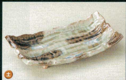
± 27310-174 長角灰釉流し焼物皿 3,100円 40入 (24×13×2.8cm)