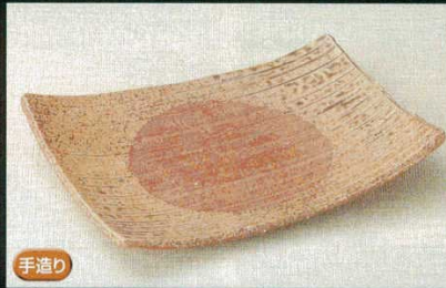
手造り 27302-574 灰吹7.0長角皿 3,400円 (21.5×16×4cm)