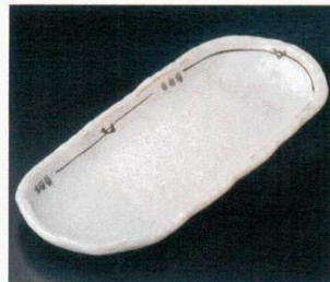
27906-544 織部結び小判型長皿 1,500円 18入 (30×12.8×2.5cm)