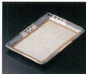
27911-114 斑点格子7.0焼物皿 1,200円 50入 (21×14.5×2cm)