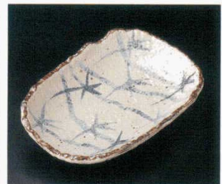
27908-114 粉引笹6.0お好み皿 1,200円 50入 (19.5×13×4cm)