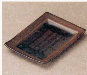
27910-234 回茶回焼皿 1,200円 (19.3×14×2cm)