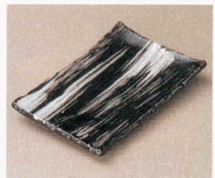
27912-474 白刷毛桃山長角皿 1,180円 40入 (18.5×12×2cm)