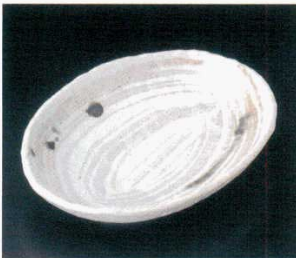
27905-054 飛翠石目小判皿(大) 1,200円 40入 (22.3×16.5×4cm)