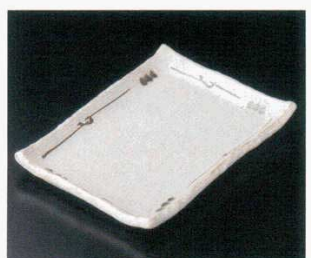
27920-544 織部結び7.0焼物皿 1,300円 48入 (20.5×14.5×2.3cm)