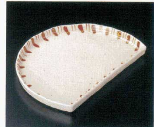
27904-554 洲十草半月皿 1,350円 50入 (20.5×15×1.8cm)