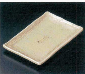
27913-524 天竜魚紋8.0焼物皿 1,160円 40入 (20.2×12.8×1.8cm)