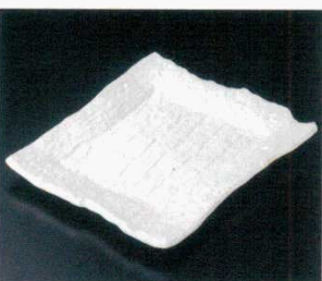
27917-454 白釉子ギリ長角皿 1,150円 50入 (20.5×16.5×1.8cm)