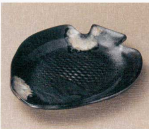
27909-264 鉄釉鯛皿 1,200円 40入 (24×19.8×2.8cm)