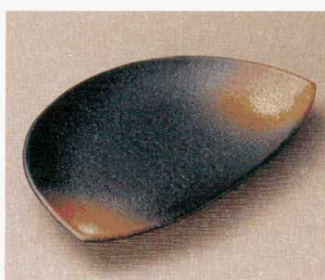
27919-524 京備前半月皿 1,150円 60入 (25×16.8×2.8cm)