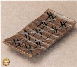
27901-174 伊賀風格子焼物皿 1,370円 40入 (22.5×11.5×2.5cm)