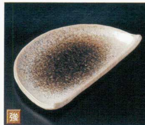
27907-574 織部かすみ半月7.0皿 1,300円 40入 (21×12.5×2cm)