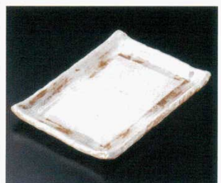
27916-544 志野タタキ7.0長角皿 1,300円 48入 (21×14.5×2cm)