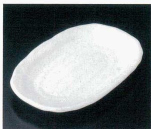
27914-334 白玉粉引六兵衛型多用皿 1,150円 30入 (24.2×16×2.5cm)