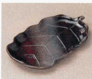
27918-524 備前灰釉8.0葉型皿 1,150円 80入 (24×14×2.3cm)