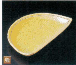
27902-574 黄釉錆筋半月皿 1,350円 (21.2×13.3×2.6cm)