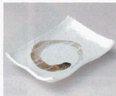
28222-254 白マット水晶刷毛目焼物皿 740円 40入 (20.5×14×3.5cm)