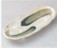
28206-294 オリベ風車足付焼物皿 800円 60入 (25.7×11.6×3.4cm)