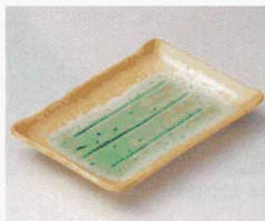
28221-254 若草波型焼物皿 740円 60入 (21×14.5×3cm)