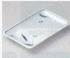
28217-554 布目小花焼物皿 770円 50入 (20.5×13.1×2.5cm)