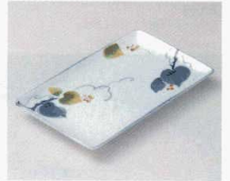
28210-104 錦山の実焼物皿 780円 40入 (21×12.5×2cm)