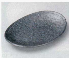
28226-454 黒釉楕円皿 680円 60入 (21×14.5×2.5cm)