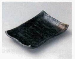
28225-204 黒備前焼物皿 700円 40入 (20.6×14.1×3.3cm)