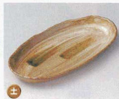
28224-314 黄瀬戸オリベ夕円皿 700円 80入 (25.5×13.2×2.3cm)