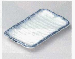
28220-174 呉須刷毛焼物皿 750円 40入 (22×13.8×2.3cm)