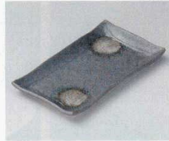
28202-294 サビ白吹新焼物皿 810円 50入 (22×12×2cm)