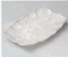
28201-314 手折粉引焼物皿 810円 (23×15×3cm)