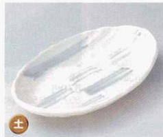
28218-104 さざなみ四ツ足楕円鉢 750円 50入 (23.5×14×4cm)