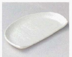
28230-024 白粉引半月焼物皿 600円 60入 (22×13×2.2cm)