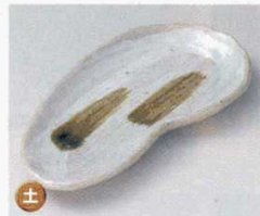
28219-304 青磁織部刷毛目ハート小判皿 750円 50入 (26×13.5×2.3cm)