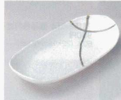
28214-204 織部ライン長皿 760円 24入 (26.5×13.2×4.3cm)