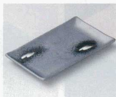
28228-314 金彩焼物皿 660円 60入 (21.8×12×2cm)