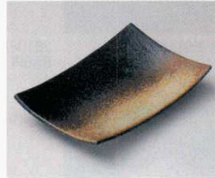
28212-574 黒備前四ツ足焼物皿 780円 (20.3×13.3×3.4cm)