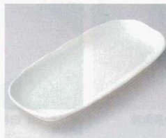
28223-144 白夕円皿 700円 60入 (28.5×13×3cm)