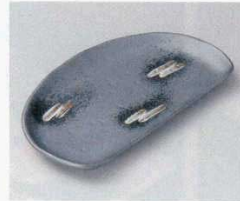
28204-314 金彩半月皿 810円 60入 (24×13×2cm)