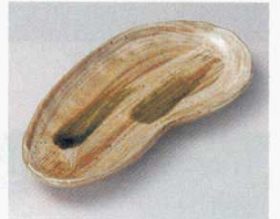
28215-314 黄瀬戸オリベ手押し焼物皿 770円 80入 (26×13×2cm)