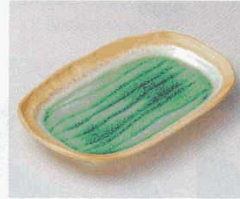
28209-254 若草スハ皿 (大) 780円 60入 (24.5×16×3cm)