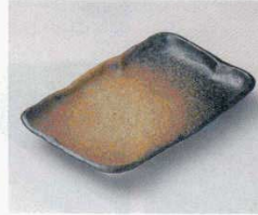
28208-574 黒備前焼物皿 780円 (21.6×14.3×2.9cm)