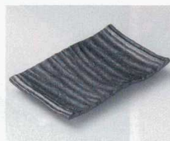
28229-134 黒いふし焼物皿 600円 (20.7×13×3cm)