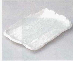
28207-574 荒ソギ白焼物皿 800円 (22×15×2cm)