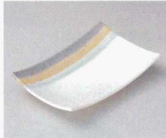
28211-574 虹四ツ足焼物皿 780円 (20×13.2×3.5cm)