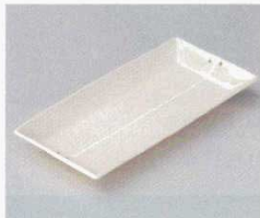
28216-454 一珍ラインクリーム長角皿 770円 50入 (22×11×2cm)