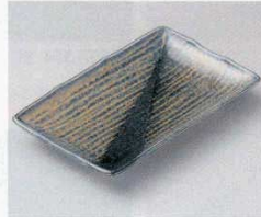
28213-034 夜明7寸焼物皿 760円 (21×13×3cm)