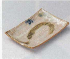
28203-544 織部ぶどう7.0焼物皿 890円 60入 (21×14.5×3cm)