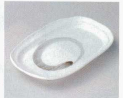
28205-254 白マット水晶刷毛目スハ皿 (大) 800円 50入 (24.5×16.5×3cm)