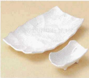
28917-024 粉引手折焼物皿 760円 40入 (23×15×3cm) 28918-024 粉引手折角千代久 300円 150入 (11.7×6.9×4.1cm)