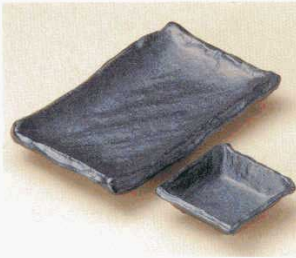
28901-134 匠(黒)長角皿 900円 40入 (22.5×14×3.3cm) 28902-134 匠(黒)正角千代久 360円 120入 (9.4×9×2.7cm)