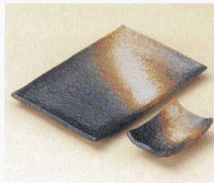
28942-524 京備前7.0長角皿 600円 100入 (20×13.6×1.5cm) 28943-524 京備前反長角小皿 300円 160入 (8.8×6.3×2.7cm)