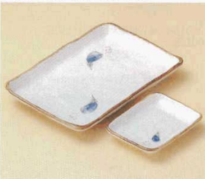
28925-574 ナス7寸長角皿 650円 (20.5×13.5×2cm) 28926-574 ナス長角小皿 210円 (10.5×8×1.5cm)