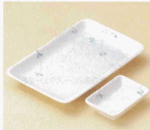
28911-554 さつき7.0焼物皿 810円 50入 (20.3×13×2.6cm) 28912-554 さつき千代久 330円 180入 (9.1×6.3×2.5cm)