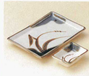
28907-524 織部芦7.0焼物皿 880円 60入 (20×13×2.5cm) 28908-524 織部芦長角小皿 300円 180入 (9×5.5×2.8cm)