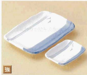
28919-524 かもめ6.0焼物皿 780円 80入 (17.5×12.2×2.5cm) 28920-524 かもめ千代久 420円 200入 (9.7×7×2.3cm)