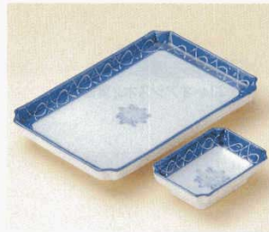
28921-554 一珍網7.0焼物皿 720円 60入 (20×13×2.3cm) 28922-554 一珍網長角千代久 250円 150入 (9.1×6.5×2.7cm)