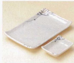
28913-554 古染武蔵野焼物皿 800円 60入 (20×13×2.3cm) 28914-554 古染武蔵野長角小皿 300円 200入 (9×6.5×2.5cm)