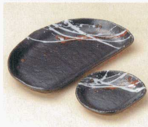
28929-234 潮 半月焼物皿 700円 (21.7×12.7×2cm) 28930-234 潮 半月小皿 350円 (10.5×9.5×1.5cm)