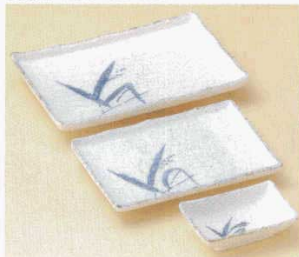
28939-544 淡雪芦7.0焼物皿 720円 60入 (20×13×2.3cm) 28940-544 淡雪芦6.0長角皿 550円 75入 (17×11.5×2.3cm) 28941-544 淡雪芦角千代久 280円 200入 (9.4×6.2×2.5cm)