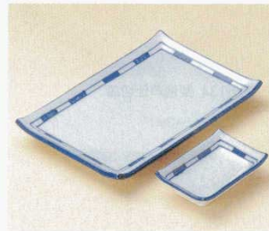
28923-554 青磁市松7.0長角皿 750円 60入 (20×13×2.7cm) 28924-554 青磁市松長角小皿 310円 150入 (9.2×6×2.5cm)