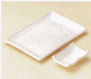
28927-524 白志野7.0長角皿 650円 50入 (20×13.5×2.5cm) 28928-524 白志野反長角小皿 300円 200入 (9×6×2.5cm)