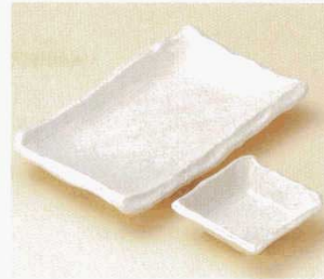
28905-134 匠(白)長角皿 900円 40入 (22.5×14×3.3cm) 28906-134 匠(白)正角千代久 360円 120入 (9.4×9×2.7cm)