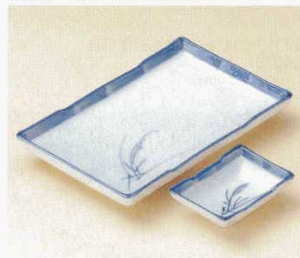
28931-544 芦7.0焼物皿 660円 60入 (19.2×12×2.5cm) 28932-544 芦角千代久 240円 300入 (8.1×5.7×2.2cm)