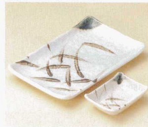
28915-554 志野織部焼物皿 800円 60入 (20×13×2.3cm) 28916-554 志野織部長角小皿 300円 120入 (9×6.5×2.5cm)