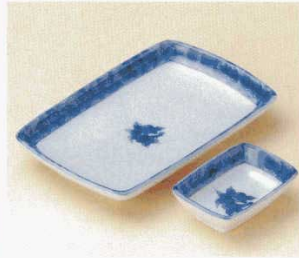
28903-544 杏子7.0皿 990円 80入 (19.3×12.3×2.7cm) 28904-544 杏子小皿 400円 200入 (8.7×6×2.7cm)