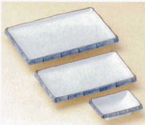
28936-544 青磁口錆7.0長角皿 790円 60入 (19.8×13×2.3cm) 28937-544 青磁口錆6.0長角皿 490円 60入 (17.2×9.9×2.5cm) 28938-544 青磁口錆小皿3号 290円 300入 (8.8×5.9×2.5cm)