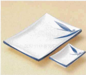
28909-554 洩呉須笹長角皿 830円 30入 (20.5×14×3cm) 28910-554 洩呉須笹千代久 280円 180入 (9.5×6.7×3cm)