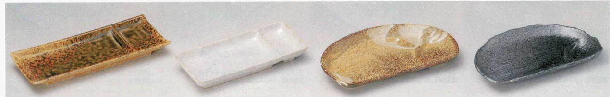
29013-034 織部吹竹割仕切皿 640円 (21×9.5×2.4cm)