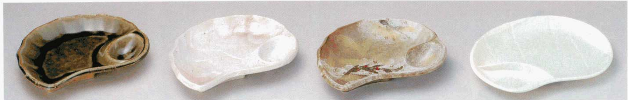
29001-034 伊賀織部半月仕切皿 1,180円 (22×16.5×4cm)