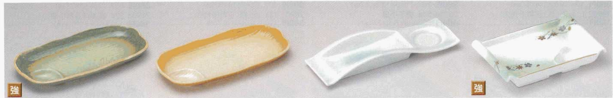
強 29005-554 緑彩仕切付焼物皿 1,350円 60入 (23×11.3×2.5cm)