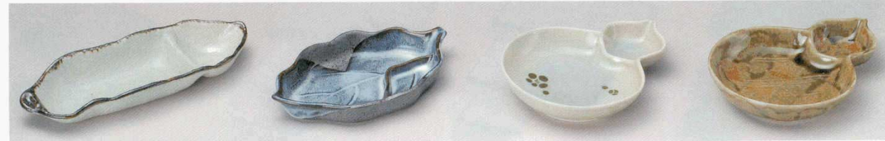
29021-554 瀏鏞唐津仕切鉢 550円 60入 (27×9.5×4cm)