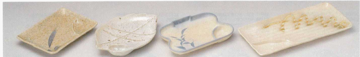
29009-134 梨地声仕切皿 550円 40入 (21×14.5×3cm)