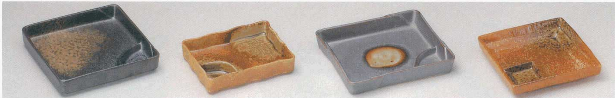
29109-024 伊賀天目仕切皿 1,000円 40入 (16.5×16.5×3cm)