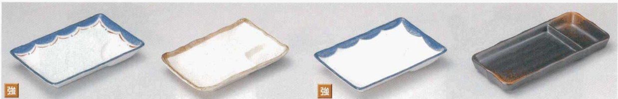
29117-524 赤絵波重ね6.0長角仕切皿 920円 80入 (17×11.5×3cm)