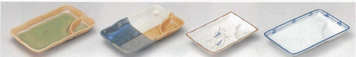
29121-034 フリット仕切皿 840円 (21×13×3.4cm)