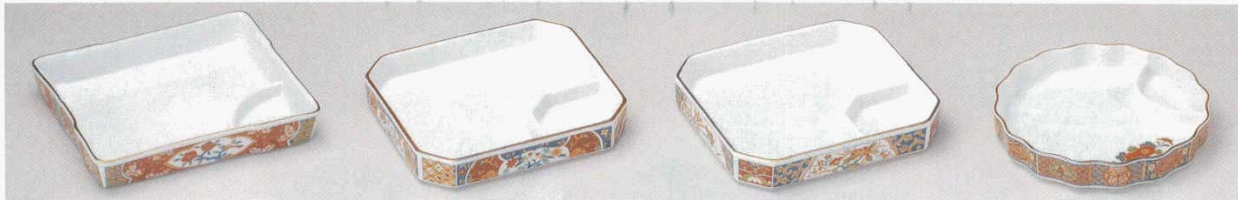
29101-554 錦飛鳥仕切皿 900円 40入 (17.8×15×3cm)