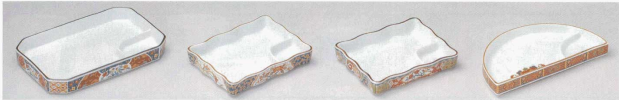
29105-554 錦花鳥長角多用皿 900円 40入 (21×13.5×3cm)