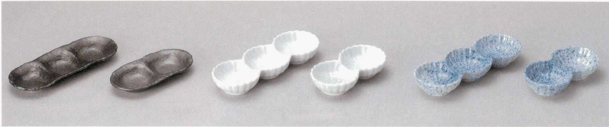
32501-134 匠(黒)三品皿 650円 (18.5×7.3×1.8cm) 32502-134 匠(黒)二品皿 550円 (13.6×7×1.8cm)