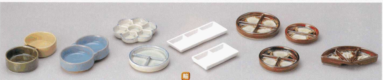
32525-134 黄瀬戸織部二品鉢 850円 (16.1×8.1×3.2cm)