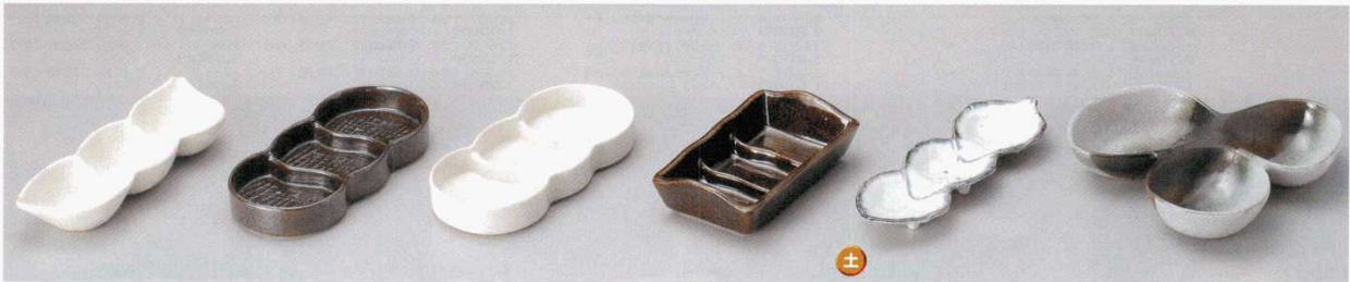
32507-314 クリーム枝豆皿 900円 60入 (20.3×6.8×3.2cm)