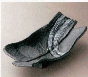
03311-134 炭化土白刷毛盛鉢 (中) 2,900円 (30.3×15×7cm)