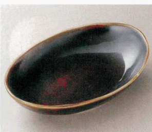
03319-104 アメ軸MSカレー鉢 750円 40入 (24×16.5×5cm)