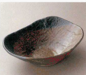
03317-144 武山多用鉢 1,700円 30入 (22×17×6cm)