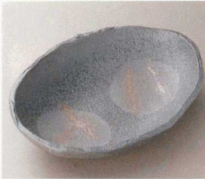
03301-664 炭化8.0楕円皿 (信楽焼) 7,800円 (24.5×18.5×4.5cm)