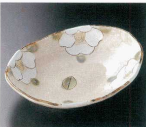
03313-124 織部つばき盛鉢 2,250円 30入 (24×18×5.5cm)