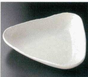
03315-034 粉引三角皿 (大) 2,200円 (25×5cm)