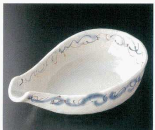
03316-184 赤乱線おぼんざい鉢 2,860円 20入 (25×15×6.5cm)