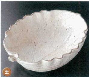
03305-454 粉引木ノ葉大鉢 3,540円 30入 (25×19×7.5cm)