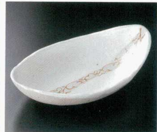
03304-294 粉引掛分赤絵唐草預鉢 4,400円 20入 (27.2×15.8×7cm)