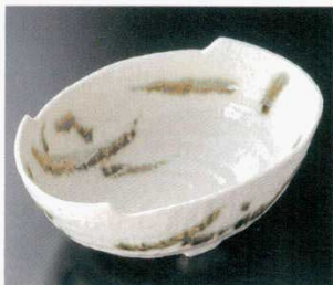
03310-204 織部一珍筆洗型大鉢 3,000円 16入 (21.6×15.5×8.1cm)