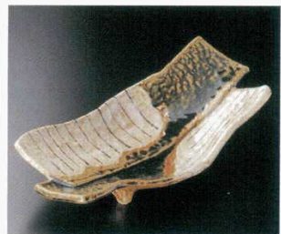
03308-174 織部細十草10.0盛鉢 3,100円 12入 (30×15×7.3cm)