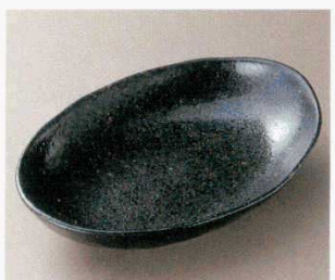
03320-104 黒唐津MSカレー鉢 750円 40入 (24×16.5×5cm)