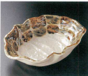
03309-204 飴織部葉型鉢 3,200円 20入 (25×20×6.5cm)