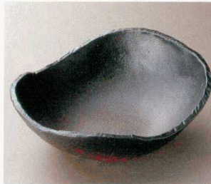
03303-314 備前楕円鉢 (大) 4,200円 20入 (23.7×20.5×8.5cm)