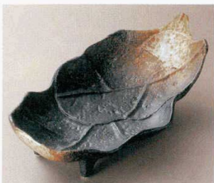
03314-314 黒備前舟形盛鉢 1,850円 (26.5×15×7.5cm)