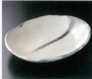
03302-664 白化藍ぼかし楕円浅鉢 (信楽焼) 5,800円 (27×22×5cm)