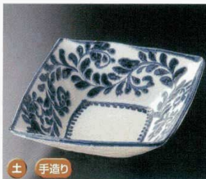
03307-514 染付唐草菱形鉢 3,500円 40入 (26.5×23×6.5cm)