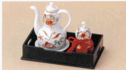
33186-294 錦牡丹しようゆ入 3,400円 60入 (7.7×1.3cm・180cc) 33187-294 受皿 500円 300入 (8.7×2cm) 33188-294 (フサ付)楊枝入 2,750円 80入 (5.8×8.8cm) 33189-294 錦牡丹木枠 1,650円 200入 (18.5×11.6×4cm)