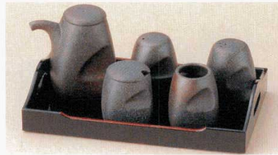
33108-574 黒備前四角汁差 1,500円 (7.5×5.1×8.2cm・160cc) 33109-574 黒備前塩入 860円 (4.3×4.3×5.5cm) 33110-574 黒備前胡椒入 860円 (4.3×4.3×5.5cm) 33111-574 黒備前辛子入 1,100円 (4.3×4.3×5.5cm) 33112-574 黒備前楊枝入 880円 (4.3×4.3×5.3cm) 33113-574 カスター一盆7寸 1,050円 (21.5×13×4cm)