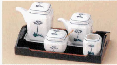
33146-434 開取花汁次大 2,650円 50入 (9.5×6×9cm・200cc) 33147-434 受皿 360円 (7×1.2cm) 33148-434 開取花汁次小 1,860円 100入 (8.4×5.7×7.8cm・140cc) 33149-434 受皿 360円 (7×1.2cm) 33150-434 開取花辛子入 1,380円 200入 (5.6×5.4cm) 33151-434 開取花楊枝入 770円 200入 (4.3×5.3cm) 33152-434 竹サジ(一本) 200円 (7.5×1.7cm) 33153-434 黒天朱盆 1,400円 (21.5×13×4cm)