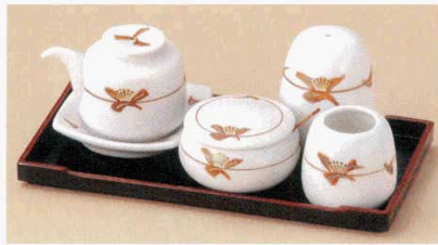
33160-254 赤絵小花ミニしようゆ入 1,900円 80入 (7.8×5.5×6.3cm・90cc) 33161-254 赤絵小花受皿 600円 (8cm) 33162-254 赤絵小花塩入 1,260円 200入 (5×7cm) 33163-254 赤絵小花辛子入 970円 200入 (6.5×3.7cm) 33164-254 赤絵小花楊枝入 720円 100入 (4×6×5cm) 33165-254 サジ 300円 (7.5cm) 33166-254 敷板 600円 100入 (21×11×1cm)