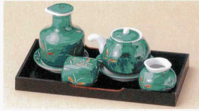
33121-434 グリンちよう首長汁次 1,680円 5×10入 (7×8.4cm・180cc) 33122-434 受皿 400円 (8.5×1.8cm) 33123-434 グリンちようペコ汁次 1,650円 10×10入 (9.3×11.8cm・180cc) 33124-434 受皿 570円 (9.5×2cm) 33125-434 グリンちよう角辛子入 1,300円 20×10入 (5.5×4.7×4.5cm) 33126-434 グリンちよう楊枝入 820円 20×10入 (5.5×5.4cm) 33127-434 盆中 960円 20入 (25×13.4cm)