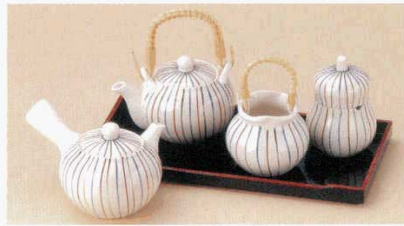
33173-454 十草ツル付汁次 1,430円 100入 (7.3×6.5cm・130cc) 33174-454 十草急須型汁次 1,400円 100入 (7.3×6.5cm・120cc) 33175-454 十草辛子入 1,070円 120入 (5.5×7.5cm) 33176-454 十草ツル付楊枝入 730円 160入 (6.5×5cm) 33177-454 ベークカスター 750円 100入 (21×11cm)