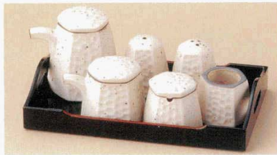
33101-574 梨地白角汁差(大) 1,200円 (8cm・130cc) 33102-574 梨地白角汁差(小) 1,100円 (5.5cm・80cc) 33103-574 梨地白角一ツ穴塩 500円 (5cm) 33104-574 梨地白角三ツ穴シヨウ 680円 (5cm) 33105-574 梨地白角辛子入 800円 (4.6cm) 33106-574 梨地白角楊枝入 680円 (4cm) 33107-574 黒塗リカスター(大) 1,050円 (21.5×13×4cm)