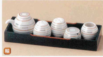
33134-184 色うずしようゆ入 1,000円 (120cc) 33135-184 色うず塩入(3ツ穴) 550円 (5×5.3cm) 33136-184 色うずシヨウ入(5ツ穴) 550円 (5×5.3cm) 33137-184 色うず辛子入 600円 (5×5.5cm) 33138-184 色うず楊枝入 550円 (5×4.5cm) 33139-184 黒又りお盆 1,500円 (27×10.2×3.2cm)