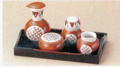
33128-254 赤巻開取格子拾り型醤油 1,450円 100入 (150cc) 33129-254 赤巻開取格子塩入れ 1,050円 100入 (5.5×7cm) 33130-254 赤巻開取格子カラン入れ 1,100円 100入 (7×4cm) 33131-254 赤巻開取格子楊枝入れ 700円 100入 (5.5×5.5cm) 33132-254 サジ 300円 (7.5cm) 33133-254 敷盆 1,350円 (21.5×13×4cm)