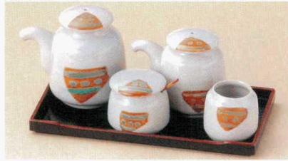
33140-254 赤絵水玉ソウス入朱 2,200円 (9×6.5×9cm・200cc) 33141-254 赤絵水玉しようゆ入朱 2,050円 (8.8×6×8cm・160cc) 33142-254 赤絵水玉辛子入朱 1,550円 (5×5.5×5cm) 33143-254 赤絵水玉楊枝入朱 880円 (5×4.7×5cm) 33144-254 サジ 300円 (7.5cm) 33145-254 敷盆 600円 (21×11×1cm)