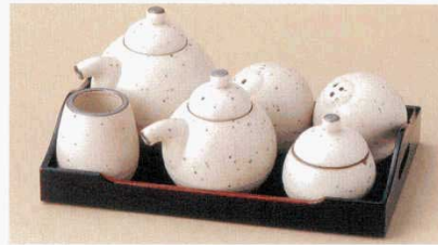
33114-574 梨地丸汁差(大) 1,200円 (9cm・180cc) 33115-574 梨地丸汁差(小) 1,150円 (7.5cm・80cc) 33116-574 梨地丸一ツ穴塩 720円 (5cm) 33117-574 梨地丸三ツ穴シヨウ 720円 (5cm) 33118-574 梨地丸辛子入 800円 (5.5cm) 33119-574 梨地丸楊枝入 500円 (5.3cm) 33120-574 黒塗リカスター(大) 1,050円 (21.5×13×4cm)