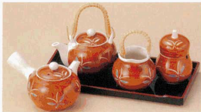
33178-454 赤蝶ツル付汁次 1,320円 100入 (7.3×6.5cm・130cc) 33179-454 赤蝶急須型汁次 1,210円 100入 (7.3×6.5cm・120cc) 33180-454 赤蝶辛子入 990円 120入 (5.5×7.5cm) 33181-454 赤蝶ツル付楊枝入 650円 160入 (6.5×5cm) 33182-454 ベークカスター 750円 100入 (21×11cm)