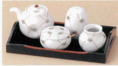
33154-254 アミ笹しようゆ入 1,420円 170入 (7×10×7.5cm) 33155-254 アミ笹塩入 1,280円 200入 (5×7cm) 33156-254 アミ笹辛子入 1,100円 200入 (6.5×3.7cm) 33157-254 アミ笹楊枝入 700円 200入 (5.5×5.2cm) 33158-254 サジ 300円 200入 (7.5cm) 33159-254 敷盆 1,350円 200入 (22×13×4cm)