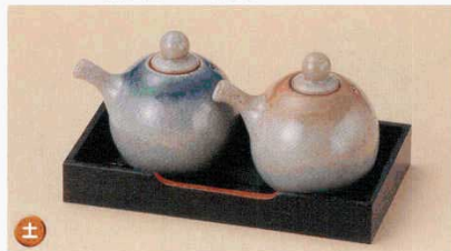
33183-234 朱吹玉型汁次 1,750円 80入 (10.5×8.5×9.5cm・220cc) 33184-234 伊賀青磁玉型汁次 1,750円 80入 (10.5×8.5×9.5cm・220cc) 33185-234 ヌリカスター皿 950円 80入 (20×11×2.7cm)