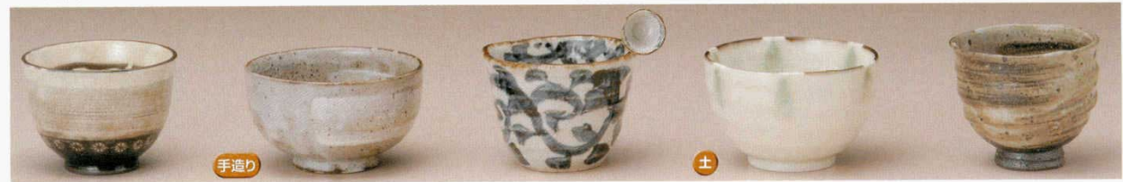
37016-444 三島大波出し 1,250円 (9.7×7cm・250cc)