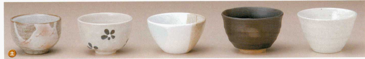
37026-304 ピンクトンボ陶碗 920円 100入 (9.4×9.4×6.4cm・270cc)