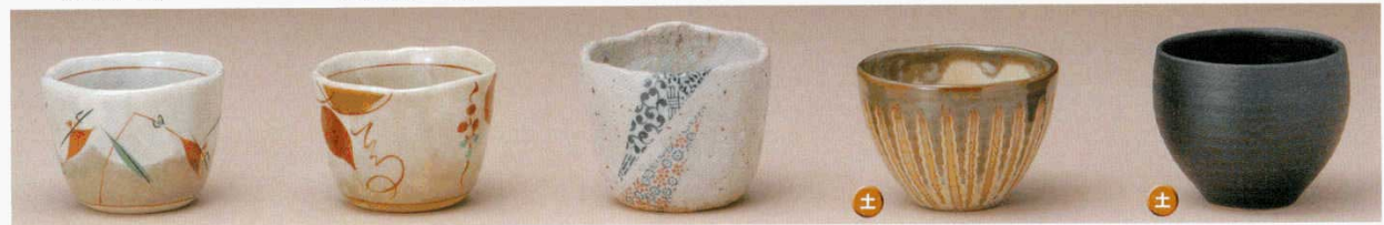
37011-544 ツユ草陶碗(小) 1,200円 80入 (9×7cm・250cc)