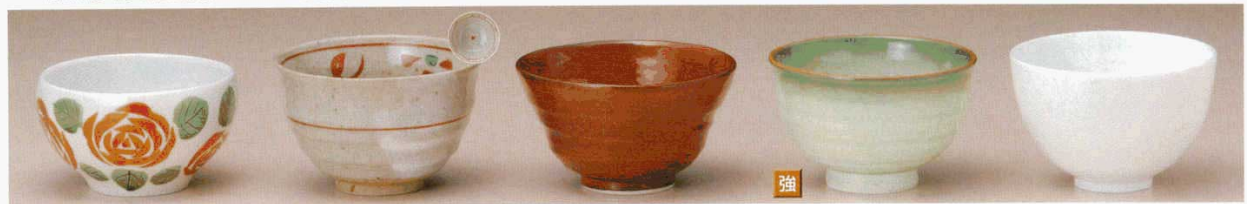
37006-514 赤彩バラ小鉢(手描き) 1,500円 40入 (11×5cm)