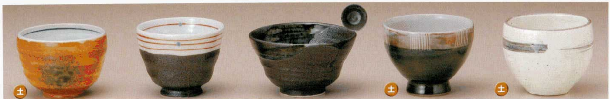
37001-304 あけほの楽々碗 1,050円 40入 (10.10×7cm・340cc)