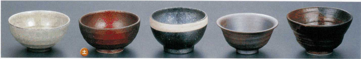
38701-234 緑彩茶碗(大) 1,100円 (11.5×5.7cm)