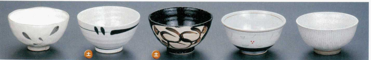
38726-104 削り木の葉飯碗 670円 120入 (11×6.2cm)