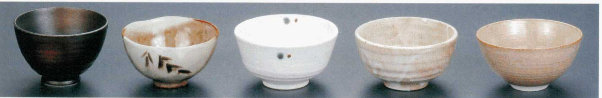
38721-454 黒伊賀吹飯碗 620円 120入 (10.4×7.1cm)