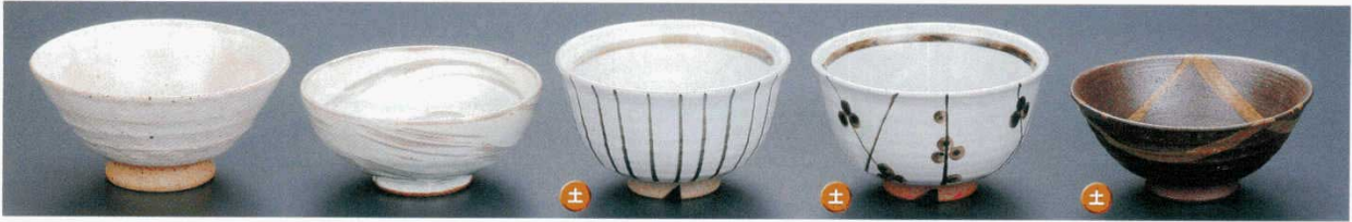
38706-574 淡雪茶碗 1,000円 80入 (13.2×6cm)