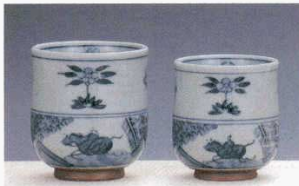
39901-564 京山水長湯呑(大) 1,000円 80入 (7.1×8cm・200cc) 39902-564 京山水長湯呑(小) 880円 80入 (6.5×7.2cm・160cc)