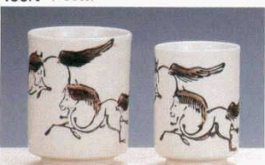
39941-524 左馬湯呑(大) 650円 160入 (6.8×9cm) 39942-524 左馬湯呑(小) 560円 160入 (5.8×8cm)