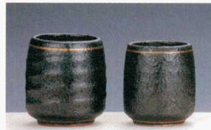
39913-024 いぶし金湯呑大 900円 10×10入 (7.8×7cm・190cc) 39914-024 いぶし金湯呑小 850円 10×12入 (7×6.5cm・130cc)