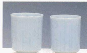
39923-294 青磁夫婦湯呑(大) 610円 10×10入 (6.8×8cm・220cc) 39924-294 青磁夫婦湯呑(小) 570円 10×10入 (6.2×7.7cm・180cc)