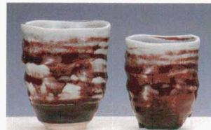
39905-264 辰砂新六兵衛中寿司湯呑 750円 80入 (8.3×9.7cm・230cc) 39906-264 辰砂新六兵衛湯呑 650円 120入 (7.1×8.1cm・160cc)