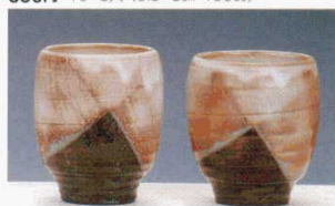
39939-554 窯変粉引掛分け長湯呑(大) 1,550円 10×9入 (6.6×8.5cm・200cc) 39940-554 窯変粉引掛分け長湯呑(小) 1,550円 10×9入 (6.5×8cm・195cc)