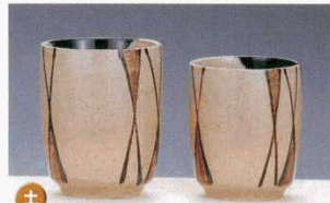
39903-204 黒織部組湯呑大 720円 10×10入 (7×8.8cm・180cc) 39904-204 黒織部組湯呑小 670円 10×10入 (6.3×7.7cm・140cc)