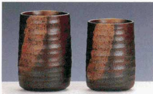
39917-234 備前(大)湯呑 560円 (6×9.2cm・210cc) 39918-234 備前(小)湯呑 530円 (5.5×8.3cm・150cc)