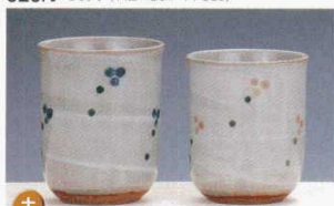
39937-304 粉引かすみ草湯呑(大) 700円 20×6入 (7×8.7cm・200cc) 39938-304 粉引かすみ草湯呑(小) 700円 20×6入 (6.8×9.2cm・180cc)