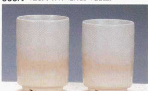
39943-314 萩湯呑(大) 650円 20×6入 (6.5×9cm・240cc) 39944-314 萩湯呑(小) 630円 20×6入 (6×8.5cm・190cc)