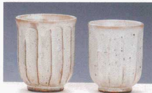
39919-334 粉引面取湯呑(大) 1,150円 120入 (7.5×9cm) 39920-334 粉引面取湯呑(小) 1,150円 120入 (6.7×8.3cm・160cc)