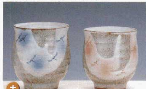
39929-304 ブルードンボ湯呑大 930円 80入 (7.5×8.4cm・220cc) 39930-304 ピンクトンボ湯呑小 920円 80入 (7.2×8cm・170cc)