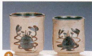
39931-444 織部かに(大)湯呑 850円 10×8入 (7.5×8.5cm・250cc) 39932-444 織部かに(小)湯呑 850円 10×8入 (6.5×8cm・190cc)