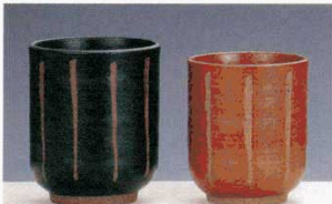
39925-544 彫十草大(黒)長湯呑 790円 20×8入 (6.8×8.4cm・220cc) 39926-544 彫十草小(赤)長湯呑 750円 20×8入 (6.4×7.6cm・180cc)