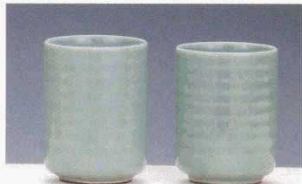
39927-434 天龍寺青地湯呑大 440円 20×8入 (6.4×8.9cm・200cc) 39928-434 天龍寺青地湯呑小 410円 20×8入 (6×8.4cm・180cc)