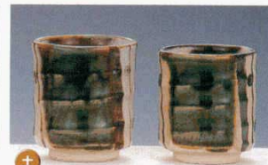
39907-024 夢織部湯呑(大) 750円 10×8入 (7.5×8.5cm・240cc) 39908-024 夢織部湯呑(小) 750円 10×10入 (7×8cm・200cc)