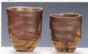
39935-264 信楽新六兵衛中寿司湯呑 570円 80入 (8.3×9.7cm・230cc) 39936-264 信楽新六兵衛湯呑 500円 120入 (7.1×8.1cm・160cc)