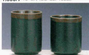
39947-284 グリーンマット(大)湯呑 350円 20×8入 (6.5×9.5cm・220cc) 39948-284 グリーンマット(小)湯呑 340円 20×8入 (6.5×8cm・200cc)