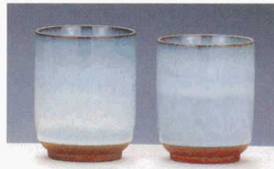
39911-234 グリン均窯(大)組湯呑 530円 (6.9×8.7cm・230cc) 39912-234 グリン均窯(小)組湯呑 500円 (6.5×8.2cm・180cc)