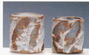
39915-024 嵐志野かきおとし湯呑(大) 1,350円 10×6入 (7.5×8.5cm・220cc) 39916-024 嵐志野かきおとし湯呑(小) 1,250円 10×8入 (7×7.5cm・170cc)