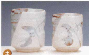
39909-204 志野芦湯呑大 570円 20×5入 (7×8.7cm・210cc) 39910-204 志野芦湯呑小 530円 20×6入 (6.5×7.6cm・150cc)