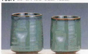
39945-314 ヒスイ湯呑(大) 430円 20×7入 (7×9cm・230cc) 39946-314 ヒスイ湯呑(小) 370円 20×7入 (6.4×8.5cm・190cc)