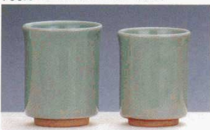
39933-314 青地入湯呑(大) 470円 20×7入 (190cc) 39934-314 青地入湯呑(小) 450円 (150cc)