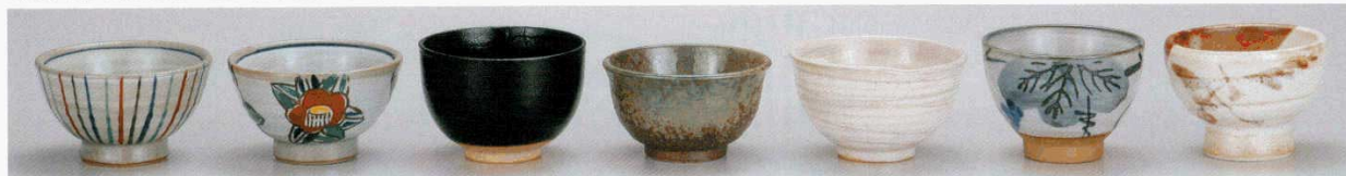
40815-314 十草煎茶 730円 20×6入 (9×5.5cm・150cc) 40816-314 染錦椿煎茶 770円 20×6入 (9×5.5cm・150cc) 40817-554 黒柚子煎茶 700円 120入 (8.7×5.8cm・200cc) 40818-524 南蛮織部掛反煎茶 700円 120入 (8.9×5cm・140cc) 40819-314 粉引刷毛目煎茶 660円 140入 (9×5.2cm・150cc) 40820-314 粉引ぶどう千茶 620円 140入 (8.5×6cm・160cc) 40821-204 志野声高台汲出 600円 120入 (8.5×6cm・100cc)