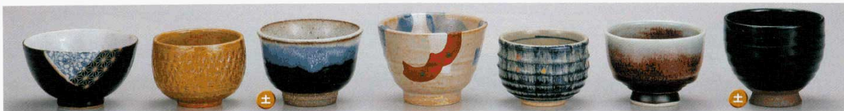
40801-564 黒織部友禅煎茶 1,200円 120入 (9.3×5.5cm・150cc) 40802-544 キセト波彫玉湯呑 1,100円 160入 (7.5×5.5cm・170cc) 40803-024 雪間煎茶 980円 160入 (9×6cm・180cc) 40804-554 赤絵志野陽炎煎茶 900円 120入 (9×6.5cm) 40805-544 ロマンカスリ玉湯呑 1,100円 160入 (7.5×5.5cm・180cc) 40806-264 辰砂高ハマ煎茶 900円 100入 (8.5×6cm・150cc) 40807-494 呉須高台煎茶 860円 (8.5×7.2cm・180cc)