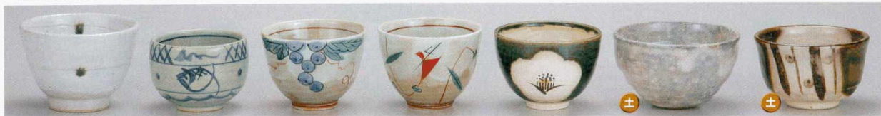
40808-554 粉引点彩マルチカップ 850円 120入 (9.2×7cm・200cc) 40809-544 魚紋玉湯呑 1,100円 160入 (7.5×5.5cm・180cc) 40810-544 青ぶどう煎茶 890円 140入 (8.3×6cm・150cc) 40811-544 ツユ草煎茶 950円 160入 (8.2×6.3cm・160cc) 40812-564 織部椿煎茶 880円 100入 (8.5×5.8cm・150cc) 40813-234 ヒスイ青磁まんまる碗 850円 80入 (10×5.6cm・220cc) 40814-024 夢織部煎茶 730円 160入 (9×5.5cm・180cc)