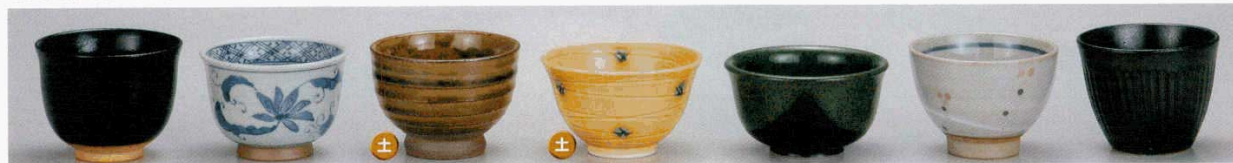
40822-554 黒柚子反煎茶 650円 120入 (8.1×6.3cm・170cc) 40823-564 菊唐草反煎茶 700円 120入 (8.5×6cm・160cc) 40824-304 茶流し高台煎茶 600円 20×8入 (8.3×6.2cm・160cc) 40825-564 黄瀬戸反煎茶 650円 120入 (9×5.5cm) 40826-104 緑彩反千茶 660円 120入 (9.3×5cm・180cc) 40827-314 粉引かすみ草煎茶 590円 120入 (8.5×6cm・170cc) 40828-024 吉祥湯呑 黒 520円 10×15入 (8×6cm・150cc)