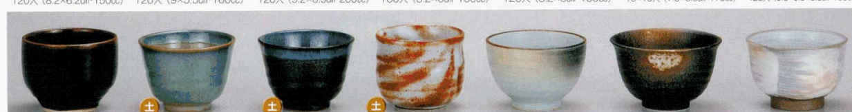
40843-264 ユズ天目切立千茶千段 400円 120入 (7.6×6cm・150cc) 40844-304 ヒスイ反煎茶 340円 20×7入 (8×5.7cm・135cc) 40845-304 黒水晶反煎茶 340円 20×7入 (8×5.8cm・135cc) 40846-304 ネズ志野洲反煎茶 360円 10×12入 (7.6×6.5cm・160cc) 40847-274 風紋煎茶 370円 20×6入 (8.2×5.6cm・150cc) 40848-524 京備前反煎茶 350円 160入 (9×5.7cm) 40849-314 御本粉引煎茶 380円 140入 (8×5.7cm・150cc)