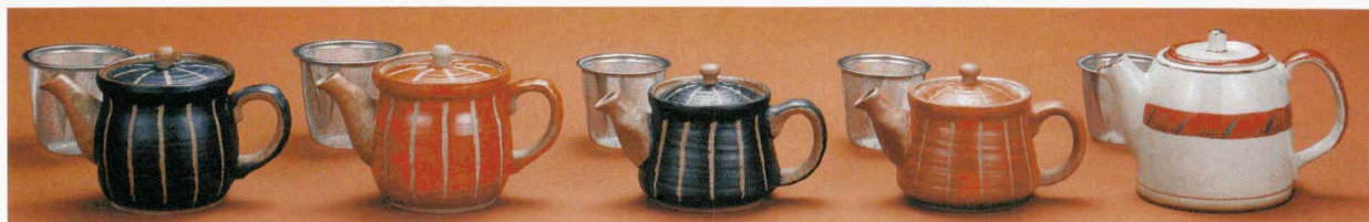
42701-574 彫十草ポット大(黒)(アミ付) 2,800円 6入(10×10cm・450cc)