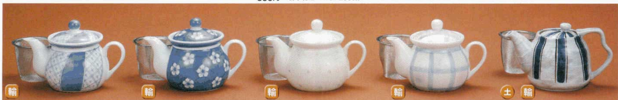
42721-234 白刷毛目ポット(茶こし付) 1,700円 24入(550cc)