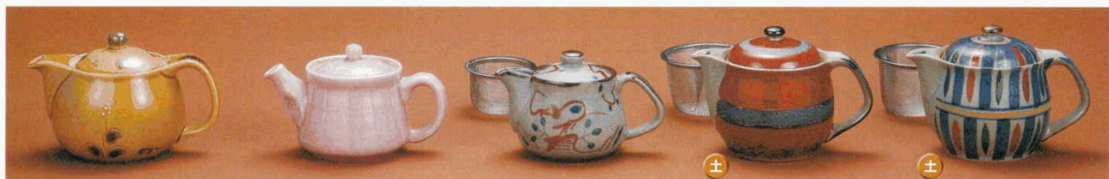
42711-554 黄瀬戸草紋ポット急須 3,000円 36入(16×10.5×10.5cm・450cc)