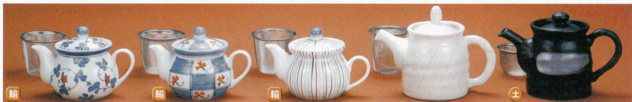
42715-304 (アミ付)赤絵トクサポット 2,300円 6×10入(9.5×10cm・410cc)