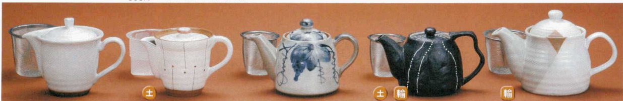
42728-574 無地白釉ポット 2,000円 48入(290cc)