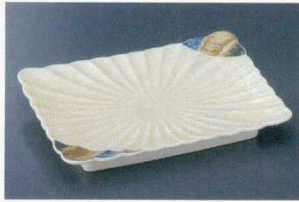
43106-714 アイボリー錦菊焼皿(有田焼) 5,200円 50入(20.5×14.5×3.2cm)