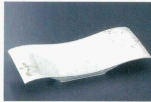
43107-714 ヒワ唐草両下り焼皿(ボンチャイナ)(有田焼) 4,200円 50入(24.5×11.5×4cm)