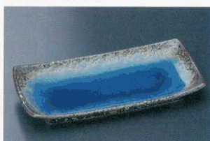
43120-714 南蛮ルリ四方上り焼皿(有田焼) 2,600円 50入(22.5×11.5×3cm)