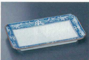
43123-714 染付花鳥焼皿(有田焼) 1,750円 50入(22×13×2.5cm)