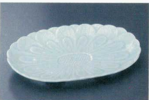
43122-714 青白磁菊型焼皿(有田焼) 1,950円 50入(23×15.5×3cm)