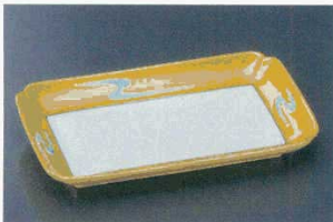
43109-714 黄交趾流水木甲焼皿(有田焼) 4,500円 50入(21.5×13×3cm)