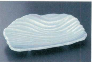
43121-714 くし目紫苑焼皿(有田焼) 2,200円 50入(22×15.5×4cm)