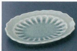
43111-714 ヒワ青磁桔梗潤焼皿(有田焼) 3,650円 50入(20×15.3×2.7cm)