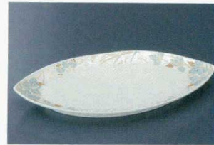
43104-714 吉野ヶ里焼皿(有田焼) 4,500円 50入(26.5×13×3cm)