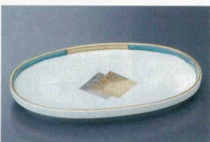
43118-714 淡雪金箔精円型焼皿(有田焼) 3,000円 50入(22.7×13.5×2.5cm)