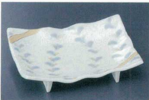
43113-714 アイボリー流水若葉焼皿(有田焼) 3,900円 50入(19.5×14.5×4.3cm)