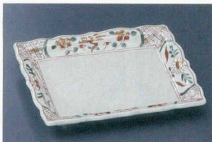
43110-714 地紋万歴焼皿(有田焼) 4,300円 50入(17.5×15.5×2.7cm)