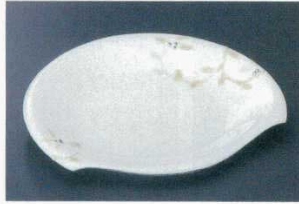
43102-714 ヒワ唐草潤返焼皿(ボンチャイナ)(有田焼) 5,200円 50入(21.3×19.2×2.4cm)