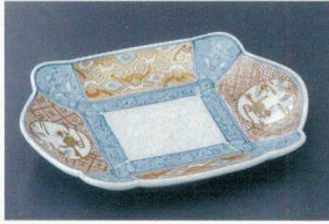
43101-714 古伊万里焼皿(有田焼) 6,450円 50入(10×15×3cm)