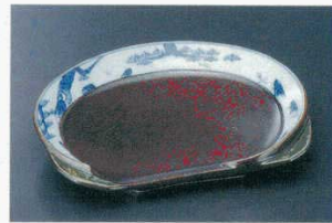
43108-714 鉄砂山水月の輪焼皿(有田焼) 4,750円 50入(20.2×15.5×3.5cm)