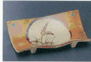
43103-714 朱塗丸紋焼皿(有田焼) 6,100円 50入(20×12×4.8cm)