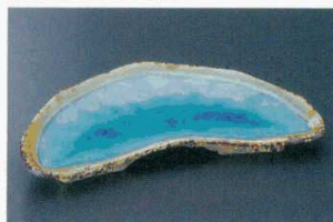
43116-714 南蛮マリンブルー半月焼皿(有田焼) 3,300円 50入(27×12.5×3.8cm)