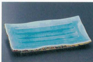
43115-714 南蛮マリンブルー焼皿(有田焼) 3,900円 50入(24.5×14×3.2cm)