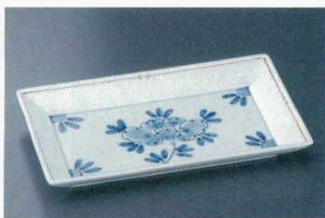
43124-714 錦牡丹焼皿(有田焼) 1,800円 50入(20.5×12.5×2.3cm)