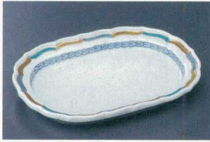
43105-714 錦市松輪花焼皿(有田焼) 4,500円 50入(21.5×15.5×2.8cm)