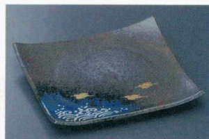
43112-714 波千鳥焼皿(有田焼) 3,900円 50入(18.5×16.5×2.8cm)