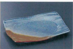
43117-714 木目彫石焼ルリ焼皿(有田焼) 3,500円 50入(22×15×2.8cm)