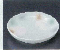
43431-714 レインボー桔梗測フルーツ(有田焼) 1,800円 80入(14.5×3cm)