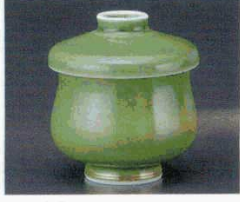
43410-714 緑釉新型むし碗(有田焼) 4,300円 80入(8.5×8cm)