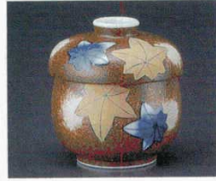
43407-714 南蛮紅葉むし碗(有田焼) 4,500円 80入(8.5×9cm)