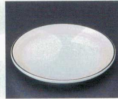
43426-714 ピンク淵金フルーツ皿(有田焼) 2,400円 100入(15.6×2.4cm)