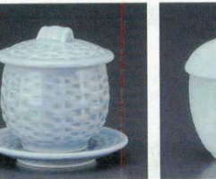
43418-714 青磁カゴ台付むし碗(有田焼) 1,750円 80入(7.5×9.7cm)