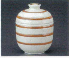
43405-714 淡黄赤線鈴型むし碗(有田焼) 4,300円 80入(7.5×10cm)