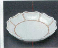
43430-714 錦線押フルーツ皿(有田焼) 1,950円 80入(13.5×2.8cm)