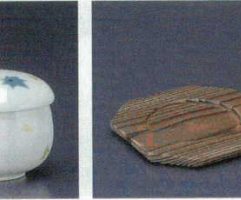
43421-714 アイボリー春秋ミニむし碗(有田焼) 1,200円 80入(7.6×7cm)