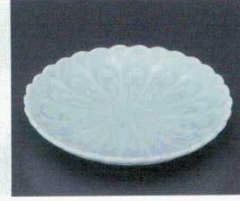
43433-714 青白磁菊型フルーツ皿(有田焼) 1,400円 80入(15.7×2.8cm)