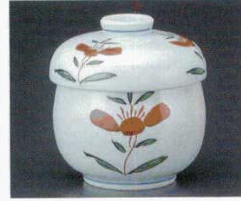
43412-714 錦万暦むし碗(有田焼) 2,800円 80入(8.5×9cm)