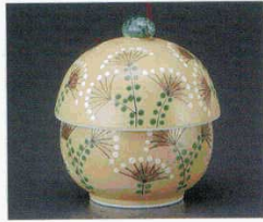
43402-714 黄肌なでしこむし碗(有田焼) 4,950円 80入(8×11cm)