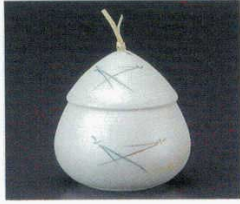
43403-714 どんぐり型松葉むし碗(有田焼) 5,000円 80入(8×8cm)