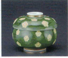
43404-714 緑釉黄梅むし碗(有田焼) 4,300円 80入(8.6×7cm)