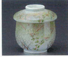
43408-714 金茶花むさしのむし碗(有田焼) 3,600円 80入(7×9cm)