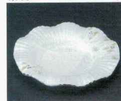
43424-714 ヒヨ唐草繡文様フルーツ皿(ボンチャイナ)(有田焼) 3,000円 80入(14.5×2.4cm)