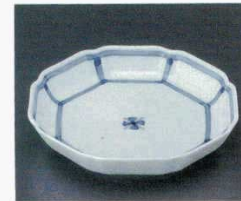
43429-714 染付間取フルーツ皿(有田焼) 2,600円 80入(14.5×3.4cm)