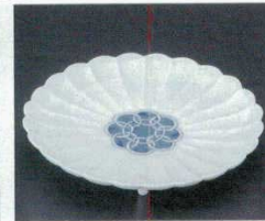
43425-714 重丸紋菊型三つ足フルーツ(有田焼) 2,600円 50入(16×3.5cm)