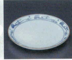
43432-714 測唐草フルーツ皿(有田焼) 1,900円 80入(15×2.2cm)