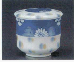
43409-714 アイボリー菊濃カスリ紋むし碗(有田焼) 3,650円 80入(8×7.5cm)