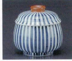
43413-714 十草むし碗(有田焼) 2,650円 80入(8×8cm)