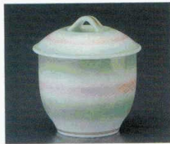
43401-714 二色吹壺むし碗(有田焼) 6,450円 80入(8.3×11cm)