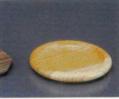
43422-714 八角焼杉台皿(有田焼) 400円 200入(10×10×9cm)