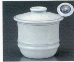
43406-714 花絵グリーン濃むし碗(有田焼) 4,000円 80入(9×9.5cm)