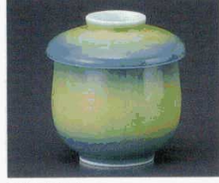
43414-714 二色吹むし碗(有田焼) 2,600円 80入(6.8×7.9cm)