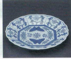
43428-714 染付花蝶フルーツ皿(有田焼) 2,150円 100入(15×2.5cm)