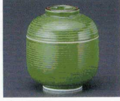
43415-714 グリーン巻ミニむし碗(有田焼) 2,000円 80入(7×9.5cm)