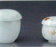
43420-714 グリーンボカシ丸むし碗(有田焼) 1,700円 80入(8.5×8.5cm)