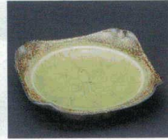
43427-714 南蛮うぐいす菊絵フルーツ皿(有田焼) 2,150円 80入(14×14×3.5cm)