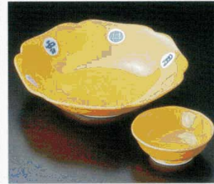
04821-144 黄釉雪月花6.0鉢 1,850円 40入 (18.5×4.5cm) 04822-144 黄釉千代久 580円 150入 (8.3×3.2cm)