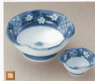
04833-544 梅祥瑞花型刺身鉢 2,500円 40入 (15.2×6.3cm) 04834-544 梅祥瑞花型豆千代久 660円 240入 (7.7×3.8cm)