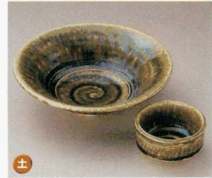
04815-144 織部刺身鉢 2,300円 50入 (16.5×4cm) 04816-144 織部千代久 940円 120入 (7×3.5cm)