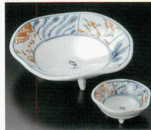
04827-024 間取草紋刺身鉢 2,100円 60入 (15.5×4.5cm) 04828-024 間取草紋千代久 1,100円 200入 (7.2×3cm)