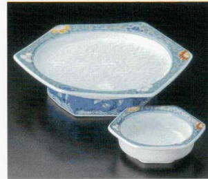
04813-134 グリーン唐草六角刺身皿 2,200円 40入 (19×17×4.2cm) 04814-134 グリーン唐草六角千代久 700円 150入 (9.5×8.7×2.8cm)