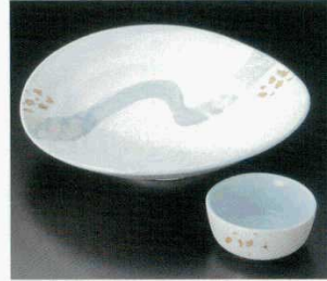
04805-174 流水ラスター変形6.0向付 2,350円 50入 (19×18×4.5cm) 04806-174 流水ラスター丸千代口 800円 200入 (6.7×3cm)