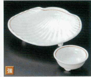
04823-564 赤絵筋貝型向付 2,200円 60入 (17.5×14×5cm) 04824-564 赤絵筋三ツ足丸千代久 880円 240入 (7.8×3.2cm)