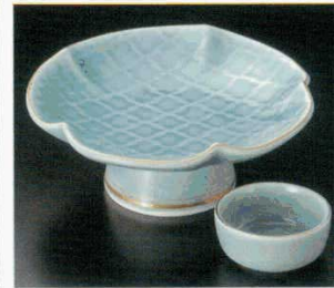
04829-164 天竜寺アミ高台刺身鉢 2,150円 30入 (17×6.8cm) 04830-164 天竜寺アミ千代久 710円 150入 (6.5×3cm)