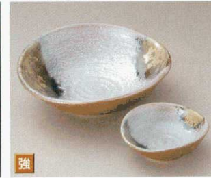
04839-174 金銀彩南蛮中鉢 2,160円 60入 (15.8×14.6×4.5cm) 04840-174 金銀彩南蛮千代久 1,140円 150入 (8.8×8×3cm)