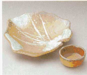
04811-164 信楽風木の葉刺身 2,450円 30入 (19.7×18.5×4.3cm) 04812-164 信楽風木の葉千代久 560円 150入 (6.8×3.2cm)