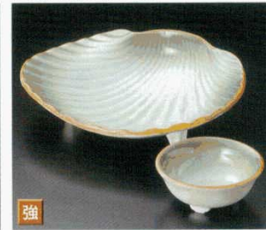
04837-564 緑翠貝型向付 2,000円 60入 (17.5×14×5cm) 04838-564 緑翠三ツ足丸千代久 770円 240入 (7.8×3.2cm)