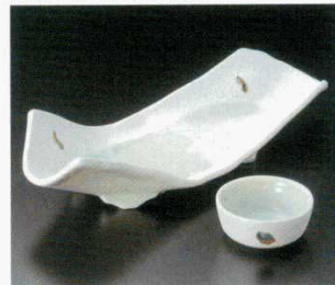
04817-164 銀彩金箔刺身 2,100円 30入 (27.3×10.7×6.7cm) 04818-164 銀彩金箔千代久 770円 120入 (6.8×3cm)