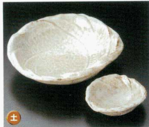
04801-144 灰軸向付 2,450円 40入 (18.5×17×4.7cm) 04802-144 灰軸千代久 750円 120入 (9.5×8.5×3cm)