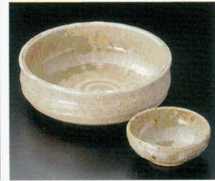
04831-314 緑釉カイヤギ刺身 2,200円 60入 (14.5×4.7cm) 04832-314 緑釉カイヤギ千代久 620円 120入 (7.5×3.2cm)