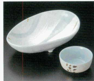
04835-174 流水ラスター精円中鉢 2,060円 40入 (16.8×10.7×4.8cm) 04836-174 流水ラスター丸千代口 800円 200入 (6.7×3cm)