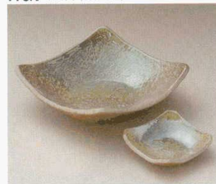
04825-524 南蛮織部掛ひし形刺身鉢 2,000円 40入 (16.5×5.5cm) 04826-524 南蛮織部掛正角千代久 500円 120入 (8.7×2.3cm)