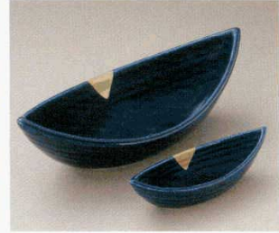
04807-544 ルリ舟型サシミ 2,500円 60入 (23×10×6.5cm) 04808-544 ルリ舟型千代久 890円 180入 (13×5×4cm)