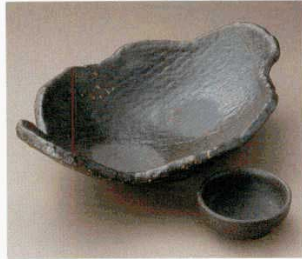
04803-174 炭化土両切向付 2,230円 30入 (24×16×7cm) 04804-174 炭化土丸子代口 630円 200入 (7×2.6cm)