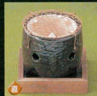
直 48018-664 丸アミ(中) 2,700円 (13.3cm) 48019-664 丸アミ(小) 2,700円 (13.3cm)