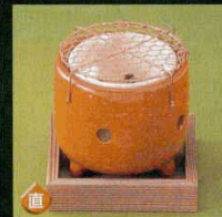
直 48020-664 丸アミ(中) 2,700円 (13.3cm) 48021-664 丸アミ(小) 2,700円 (13.3cm)