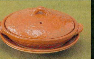
直 48034-664 5号赤楽柳川鍋(受皿付)(信楽焼) 8,700円 (15×6.8cm)