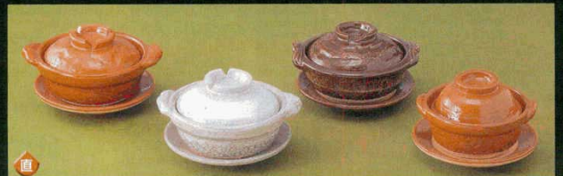
直 48037-664 赤楽5号鍋(受皿付)(信楽焼) 9,000円 (17.5×15.5×9cm) 48038-664 灰釉刷毛目5号鍋(受皿付)(信楽焼) 8,200円 (17.5×15.5×9cm) 48039-664 アメ軸5号鍋(受皿付)(信楽焼) 8,300円 (17.5×15.5×9cm) 48040-664 赤楽4.5号鍋(受皿付)(信楽焼) 8,500円 (15×13.5×9.5cm)