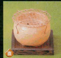
直 48024-664 丸アミ(中) 2,700円 (13.3cm) 48025-664 丸アミ(小) 2,700円 (13.3cm)