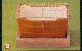
直 48026-664 赤楽長角コンロ(敷板付・アミ別売)(信楽焼) 13,500円 (17.5×11.5×8.5cm) 網別売 48027-664 長角アミ(手編)(銅) 3,000円 (17.5×11.4cm)