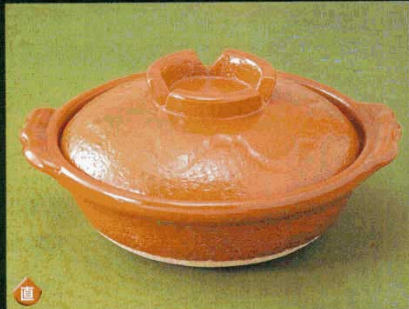
直 48001-664 赤楽6号鍋(信楽焼) 11,000円 (22.5×19.5×9.5cm) 48002-664 赤楽7号鍋(信楽焼) 13,000円 (25.5×23×11.5cm) 48003-664 赤楽8号鍋(信楽焼) 24,800円 (28.5×26×14cm) 48004-664 赤楽9号鍋(信楽焼) 34,800円 (32×29×15cm) 48005-664 赤楽10号鍋(信楽焼) 46,000円 (35×31×15.5cm)