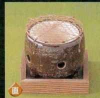
直 48022-664 丸アミ(中) 2,700円 (13.3cm) 48023-664 丸アミ(小) 2,700円 (13.3cm)