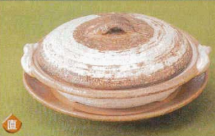
直 48035-664 6号伊賀刷毛目柳川鍋(受皿付)(信楽焼) 8,360円 (16.5×7cm)