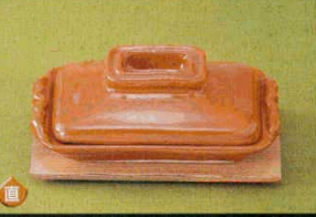
直 48032-664 赤楽長角柳川鍋(敷板付) 11,000円 (17×12×5.5cm)