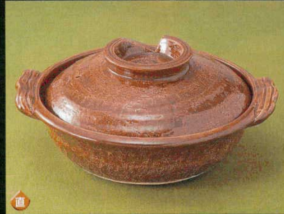
直 48006-664 アメ軸6号鍋(信楽焼) 9,800円 (22.5×19.5×9.5cm) 48007-664 アメ軸7号鍋(信楽焼) 15,500円 (25.5×23×11.5cm) 48008-664 アメ軸8号鍋(信楽焼) 22,000円 (28.5×26×14cm) 48009-664 アメ軸9号鍋(信楽焼) 32,000円 (32×29×15cm) 48010-664 アメ軸10号鍋(信楽焼) 41,000円 (35×31×15.5cm)