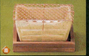
直 48028-664 おふけ長角コンロ(敷板付・アミ別売)(信楽焼) 13,750円 (17×10.5×7.8cm) 48029-664 長角アミ(手編)(銅) 3,000円 (17.5×11.4cm)