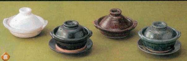
直 48041-664 乳白とんがり鍋(信楽焼) 8,300円 (16×14×10cm) 48042-664 黒楽4.5号鍋(受皿付)(信楽焼) 8,500円 (15×13.5×9.5cm) 48043-664 アメ軸とんがり鍋(信楽焼) 8,200円 (16×14×10cm) 48044-664 織部4.5号鍋(受皿付)(信楽焼) 8,500円 (15×13.5×9.5cm)