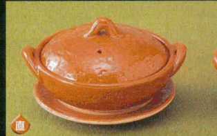
直 48033-664 4号赤楽浅鍋(受皿付)(信楽焼) 8,200円 (14.5×12.2×7.5cm)