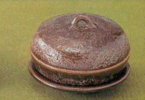
直 48036-664 4.5号アメ軸ホーラク鍋(受皿付)(信楽焼) 8,500円 (14×4cm)