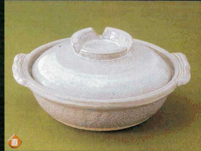
直 48011-664 灰釉刷毛目6号鍋(信楽焼) 9,800円 (22.5×19.5×9.5cm) 48012-664 灰釉刷毛目7号鍋(信楽焼) 15,500円 (23.5×23×11.5cm) 48013-664 灰釉刷毛目8号鍋(信楽焼) 22,000円 (28.5×26×14cm) 48014-664 灰釉刷毛目9号鍋(信楽焼) 32,000円 8入 (32×29×15cm) 48015-664 灰釉刷毛目10号鍋(信楽焼) 41,000円 6入 (35×31×15.5cm)