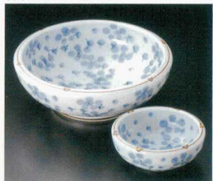
04931-734 梅花詰向付(有田焼) 1,800円 5×12入 (16×5cm) 04932-734 梅花詰千代口(有田焼) 880円 5×16入 (9×3.5cm)