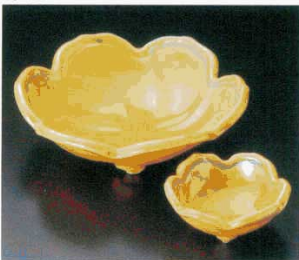
04935-144 黄釉グリーン梅型向付 1,850円 50入 (15.5×4.5cm) 04936-144 黄釉グリーン梅型千代久 730円 120入 (8×3.3cm)