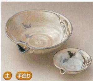
04937-104 唐津波千鳥片口刺身鉢 1,850円 40入 (19×5.7cm) 04938-104 唐津波千鳥片口千代久 950円 150入 (9.5×3cm)