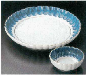
04901-574 菊型グリーン交趾6.5皿 2,300円 40入 (18.8×3cm) 04902-574 菊型グリーン交趾千代久 1,100円 80入 (7.8×2.8cm)