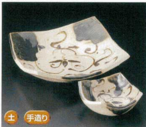
04927-204 ペルシヤン織部刺身 2,100円 30入 (16×3.8cm) 04928-204 ペルシヤン織部千代久 1,200円 100入 (8.3×2.6cm)