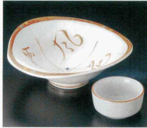
04911-144 雪月風花なぶり向付 2,000円 40入 (15.5×5.5cm) 04912-144 朱巻丸千代久 620円 150入 (6.5×3cm)