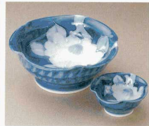
04907-544 白盛山茶花型5.0刺身鉢 2,450円 60入 (15.5×6.5cm) 04908-544 白盛山茶花型豆千代久 650円 240入 (8×3.8cm)