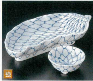
04921-564 手描アミ双葉木ノ葉向付 2,000円 60入 (22.8×9.8×4.8cm) 04922-564 手描アミ三ツ足丸千代久 800円 240入 (7.8×3.2cm)