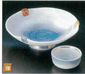
04913-164 コバルト吹三色刺身鉢 2,350円 50入 (16.3×5cm) 04914-164 金線コバルト吹千代久 620円 150入 (6.6×3cm)