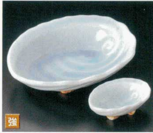
04919-524 青白磁アワビ刺身鉢 2,480円 40入 (16.5×12.5×4cm) 04920-524 青白磁アワビ千代久 760円 160入 (7.8×5.5×2.5cm)