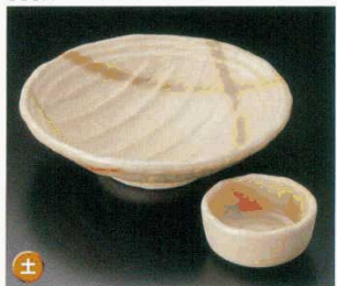
04939-174 火だすきガタ彫向付 1,700円 60入 (17×5cm) 04940-174 火だすき千代久 480円 120入 (6.8×3cm)