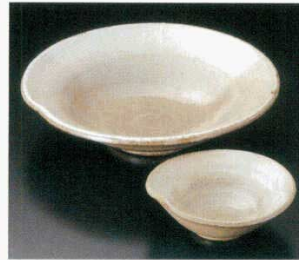
04905-294 手造風粉引吹反刺身 2,150円 60入 (17×4.3cm) 04906-294 手造風粉引吹反千代久 630円 150入 (9.3×3cm)