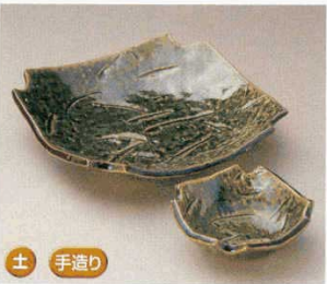
04933-204 織部芦刺身 1,900円 40入 (16×3cm) 04934-204 織部芦千代久 1,050円 100入 (8.6×2.3cm)