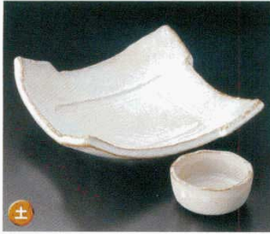
04909-114 御本手四方上り向付 2,100円 30入 (18×18×6cm) 04910-114 御本手ガタ彫千代久 680円 150入 (7×3.2cm)