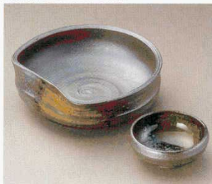
04929-314 備前刺身鉢 1,950円 80入 (14.3×13.3×4.5cm) 04930-314 備前千代久 600円 120入 (7.2×3cm)