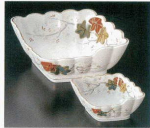
04915-114 高麗紅葉刺身 2,200円 50入 (19.5×15×6.5cm) 04916-114 紅葉千代久 750円 200入 (11×8.5×3cm)