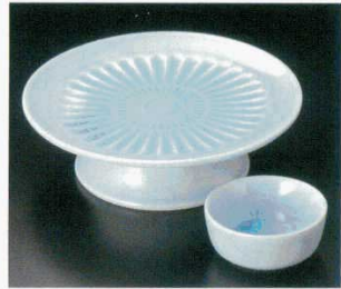
04923-174 青白地菊型彫高台刺身鉢 2,020円 30入 (15.5×5.5cm) 04924-174 青白地菊型彫千代久 670円 150入 (6.5×3cm)