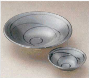
04925-294 黒うす潮反向付 2,050円 40入 (17×4.5cm) 04926-294 黒うす潮反千代久 650円 150入 (9.4×3.1cm)