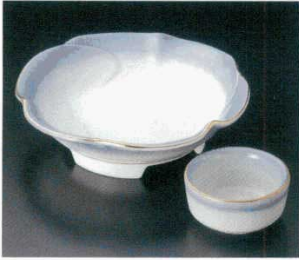
04917-144 測金紫吹花形向付 2,000円 50入 (14.8×4.2cm) 04918-144 測金紫吹千代久 750円 150入 (6.3×3.1cm)