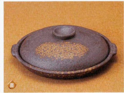
49110-654 焼締ビザ&バエリア(萬古焼) 5,500円 6入 (32×29×10cm)