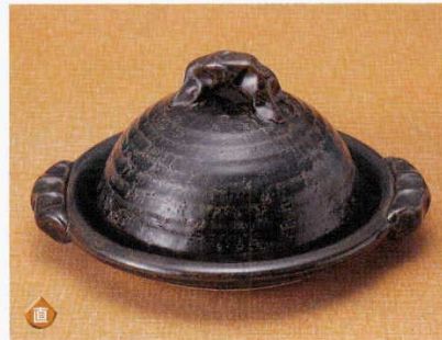
49106-664 織部8.0陶板(信楽焼) 13,200円 (30.5×26×16cm)