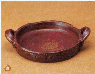
49108-574 鉄赤38cm陶板(常滑焼) 13,200円 (38×30×5.5cm)