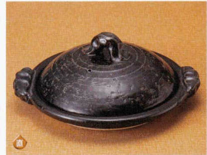
49107-664 織部11.0陶板(信楽焼) 22,000円 (37.5×33×15cm)