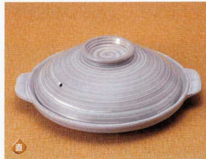
49114-634 大黒刷毛目10号陶板(萬古焼) 6,400円 5入 (36×31×12cm)