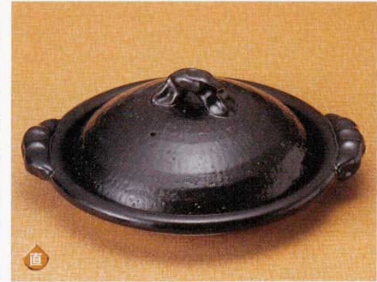
49104-664 黒釉11.0陶板(信楽焼) 22,000円 (37.5×33×15cm)