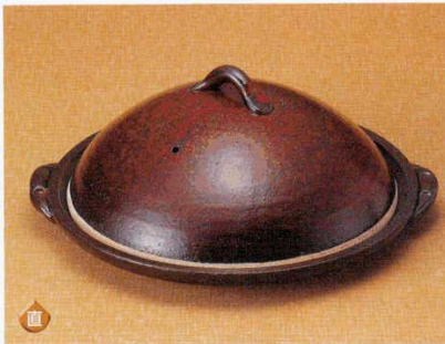
49101-664 10号陶板(蓋付)(信楽焼) 12,500円 (31×14cm) 49102-664 12号陶板(蓋付)(信楽焼) 19,800円 (36×14cm)