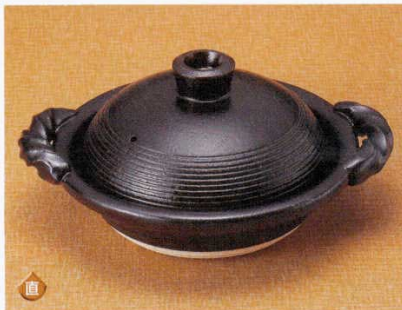
49105-644 黒釉9号会席鍋(萬古焼) 6,200円 6入 (32×28×16cm)