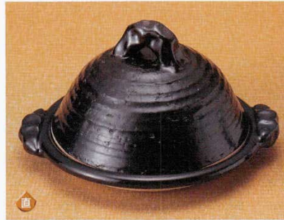
49103-664 黒釉8.0陶板(信楽焼) 13,200円 (30.5×26×16cm)