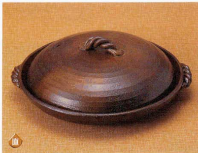
49111-Y4 灰釉7号蓋付陶板(萬古焼) 3,200円 12入 (24.3×22.5×10cm) 49112-Y4 灰釉8号蓋付陶板(萬古焼) 4,300円 10入 (28.5×25.8×11.5cm) 49113-Y4 灰釉10号蓋付陶板(萬古焼) 5,800円 6入 (33.5×30.5×13cm)