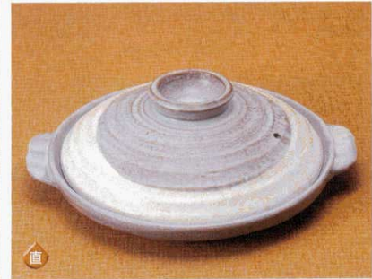
49115-654 京粉引10号陶板(萬古焼) 6,800円 5入 (36×31.5×12cm)