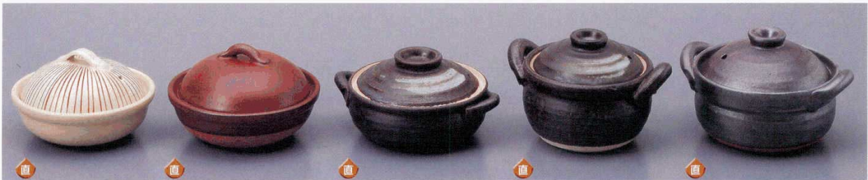
49914-164 黒朱十草土鍋(小) 2,150円 40入(13.2×7.5cm) 49915-654 鉄赤ホ一口ク鍋4.5号(萬古焼) 2,100円 45入(14.3×7.7cm) 49916-654 黒陶刷毛目4.5号鍋(萬古焼) 1,900円 30入(16.5×13.5×8cm) 49917-654 黒陶刷毛目4号多用深鍋(萬古焼) 2,000円 30入(16×12.5×10.5cm) 49918-654 鉄袖炊鍋(萬古焼) 2,900円 20入(18×14×10cm)