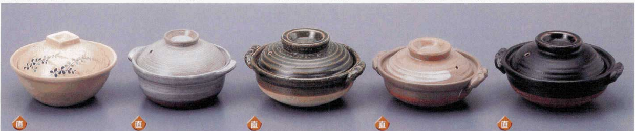
49924-164 草花紋土鍋(大) 2,400円 40入(16×8.5cm) 49925-634 大黒刷毛目5号鍋(萬古焼) 1,750円 38入(17.5×15.5×9.1cm) 49926-644 織部5号鍋(萬古焼) 1,850円 40入(17×15×9cm) 49927-644 織部5.5号鍋(萬古焼) 2,400円 28入(18.5×16.3×10cm) 49928-654 京風白刷毛目5号鍋(萬古焼) 1,850円 28入(17×15×9cm) 49929-654 京風白刷毛目5.5号鍋(萬古焼) 2,400円 20入(19×17×11cm) 49930-644 柚子天目5号鍋(萬古焼) 1,850円 40入(17.5×15.3×9cm) 49931-644 柚子天目5.5号鍋 2,400円 28入(19×17×10cm) 49932-644 柚子天目6号鍋(萬古焼) 3,000円 24入(21.8×19×11cm)