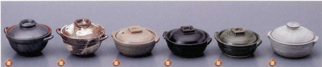
49901-654 鉄結晶4号鍋(萬古焼) 2,100円 40入(15×12.5×8.8cm) 49902-654 唐津刷毛目4号鍋(萬古焼) 2,100円 40入(15×12.5×8.8cm) 49903-654 京風白刷毛目4号浅鍋(萬古焼) 2,000円 30入(14×12.5×7.5cm) 49904-644 柚子天目4号浅多用鍋(萬古焼) 2,000円 60入(14×12.5×7.5cm) 49905-644 織部4号鍋(萬古焼) 2,000円 60入(13.5×12×7.5cm) 49906-644 大黒刷毛目4号鍋(萬古焼) 1,400円 60入(14.3×12.8×8cm)