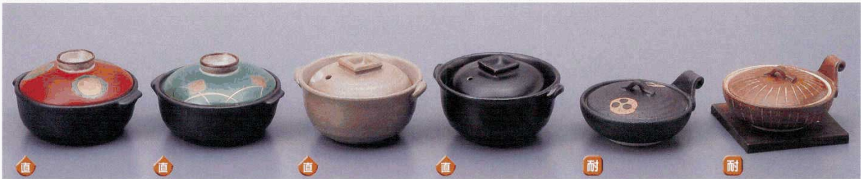
49907-654 朱巻金紋4号鍋(萬古焼) 2,200円 30入(14.5×13×7.5cm) 49908-644 グリーン金紋4号鍋(萬古焼) 2,450円 60入(14.3×12.8×8cm) 49909-654 京風白刷毛目4号深鍋(萬古焼) 2,100円 30入(14.5×12.8×8.5cm) 49910-654 柚子天目4号深鍋(萬古焼) 2,100円 30入(15×13×8.5cm) 49911-514 黒袖丸紋目玉焼 1,750円 40入(14×11.5×5.5cm) 49912-574 赤茶線紋目玉焼き 1,600円 (13.5×11.5×5.5cm) 49913-574 焼杉板11角 140円 (11.2cm)