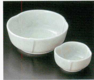
05027-294 もえぎ手造り風刺身 1,750円 40入 (14×5.3cm) 05028-294 もえぎ手造り風千代久 660円 150入 (8.3×4cm)