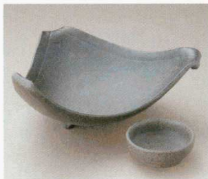
05005-174 炭化土布目三ツ山刺身 1,980円 30入 (21×17.3×9.5cm) 05006-174 炭化土丸千代口 630円 200入 (7×2.6cm)