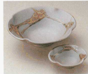
05033-244 焼×織部刺身鉢 1,700円 50入 (15.7×14.8×4.5cm) 05034-244 焼×織部千代久 630円 100入 (8.5×7.8×2.5cm)