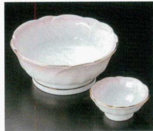
05019-294 ピンク吹梅型向付 1,750円 40入 (15.1×6.3cm) 05020-294 ピンク吹梅型千代久 570円 150入 (8×3.3cm)