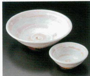
05009-444 一珍萩色うず5.0平鉢 1,830円 50入 (15.5×4.5cm) 05010-444 一珍萩色うず反千代口珍味 830円 120入 (8.7×3cm)