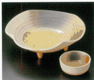
05003-164 黄釉流し刺身鉢 1,900円 30入 (17.8×4.8cm) 05004-164 黄釉流し千代久 650円 150入 (6.6×3cm)