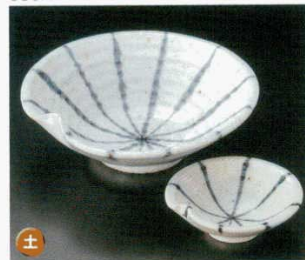
05015-174 トルコ輪花5.5刺身鉢 1,900円 50入 (17.2×4cm) 05016-174 トルコ丸千代久 600円 150入 (7.4×3.3cm)