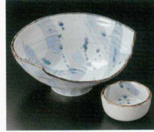
05039-294 半月呉須ちらし向付 1,550円 40入 (17.4×15×7.3cm) 05040-294 半月呉須ちらし丸千代久 500円 120入 (6.7×3.2cm)