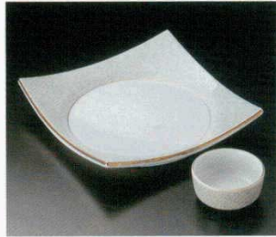
05013-024 測金グリーン吹き刺身皿 1,950円 30入 (16.5×16.5×3cm) 05014-024 測金グリーン吹き千代久 680円 200入 (6×2.8cm)