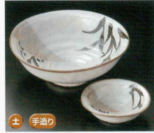
05029-284 ネズ志野白流刺身 1,750円 40入 (16.5×5cm) 05030-284 ネズ志野白流千代久 650円 200入 (9×2.7cm)