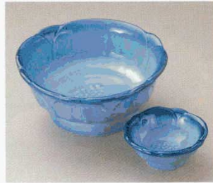
05021-294 濃コバルト梅型向付 1,600円 40入 (15×6.1cm) 05022-294 濃コバルト梅型千代久 540円 150入 (8×3.2cm)