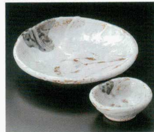
05025-104 白タタキ草文切合刺身鉢 1,750円 60入 (18.5×4.5cm) 05026-104 白タタキ草文切合千代久 700円 150入 (8.5×3.5cm)