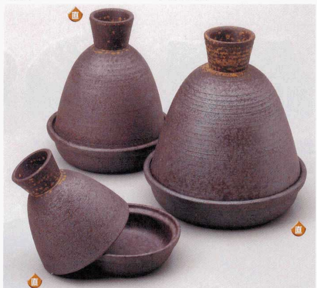
50329-654 焼締タジン鍋φ16(1人用)(萬古焼) 3,300円 12入 (16.5×18cm) 50330-654 焼締タジン鍋φ20(2人用)(萬古焼) 6,800円 8入 (20.5×24cm) 50331-644 焼締タジン鍋φ25(3~4人用)(萬古焼) 11,000円 4入 (24.5×27cm)