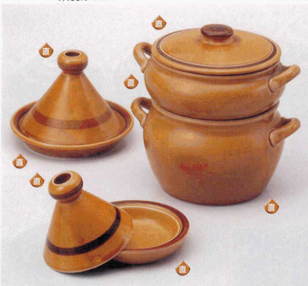
50322-454 モロッコ鍋小蓋 2,550円 10×4入 (13.5×11cm) 50323-454 モロッコ鍋小身 990円 15×3入 (16×3cm) 50324-454 モロッコ鍋大蓋 3,400円 5×4入 (16.8×12.5cm) 50325-454 モロッコ鍋大身 1,800円 10×2入 (20.8×3.4cm) 50326-454 モロッコむし器用蓋 1,800円 16入 (20×4.5cm) 50327-454 モロッコむし器穴明鍋中段 4,000円 8入 (26×22×8cm) 50328-454 モロッコむし器穴明鍋下段 5,500円 8入 (26.5×22×15cm)