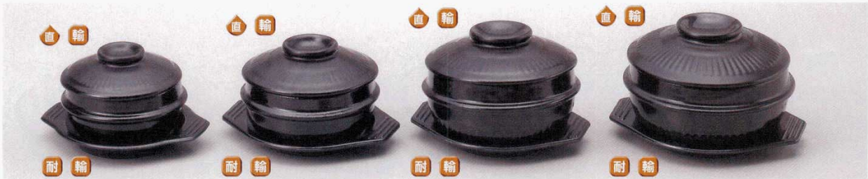
50301-024 チゲ鍋12cm蓋付 1,500円 10入 (11.5×10cm) 50302-024 チゲ鍋12cm身丈 1,100円 20入 (11.5×6cm・420cc) 50303-024 メラミン敷12cm用 430円 300入 (17.5×14.7×2.2cm)