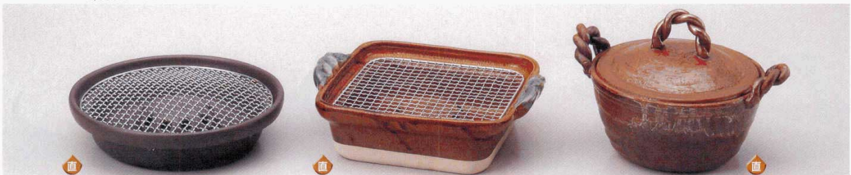
50318-644 遠赤焼肉器(金網付)(萬古焼) 4,700円 10入 (29×6.5cm) 50319-644 焼肉器用9号丸金網 1,400円 (26cm)