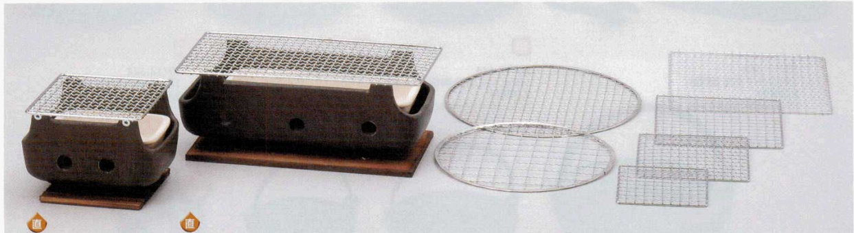
50817-634 串焼コンロ黒(小)木台・アミ付(萬古焼) 4,500円 16入 (18.5×13.5×13cm)