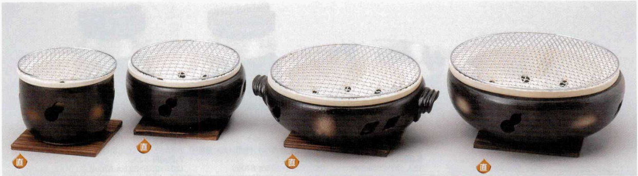
50801-Y4 黒伊勢コンロ5号(金網・敷板付)(萬古焼) 3,900円 12入 (17×12.5cm) 50802-Y4 5号ゴトク(萬古焼) 900円 (16.7×6.5cm) 50803-Y4 5号用丸金網 950円 (φ17cm)