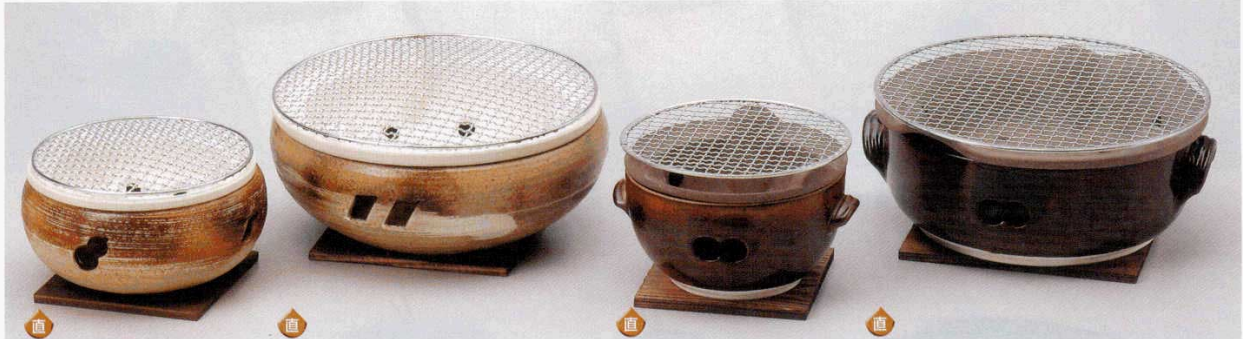
50813-644 イラホ伊勢コンロ7号(金網・板付)(萬古焼) 6,000円 10入 (20×10cm)