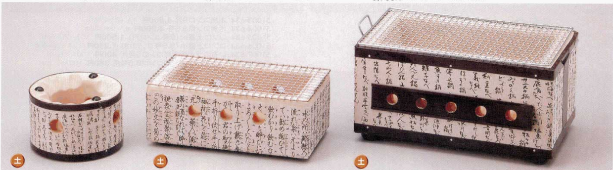
50905-Y4 民芸コンロ21cm(火入・敷板付) 6,300円 8入 (20.6×20.6×16.3cm) 50907-Y4 民芸コンロ12cm(火入・敷板付) 2,900円 36入 (12.5×12.5×10cm) 50906-Y4 民芸コンロ15cm(火入・敷板付) 3,700円 18入 (15.3×15.3×12cm)