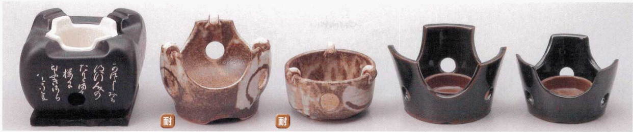
51101-294 黒コンロ(低)台付 3,000円 20入 (14.5×14.5×10cm・板13cm)