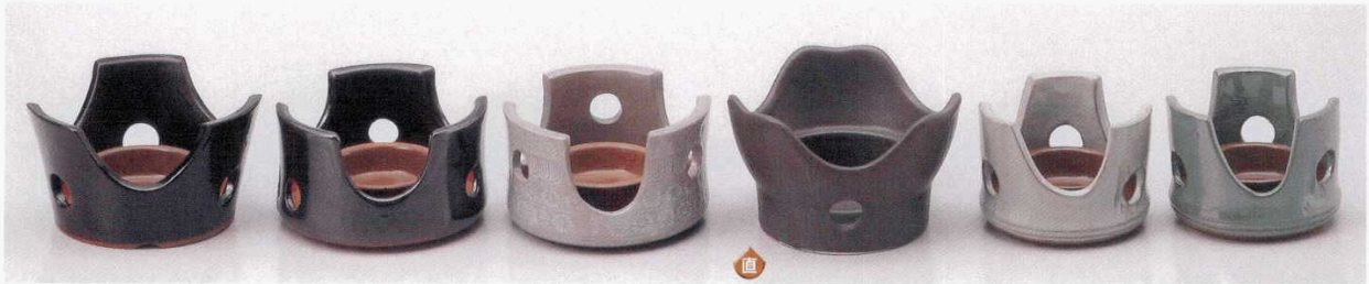
51106-634 天目コンロ(大)(萬古焼) 1,700円 60入 (13×7.2cm)