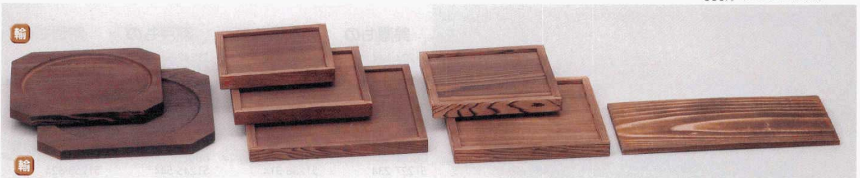
51118-644 21cm角焼杉板(段付) 1,200円 (21×21×1.5cm・内寸17.5cm)