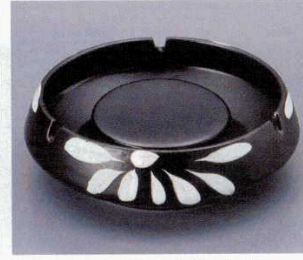
51628-204 天目菊ヘソ付五寸灰皿 1,100円 40入 (16×5cm)