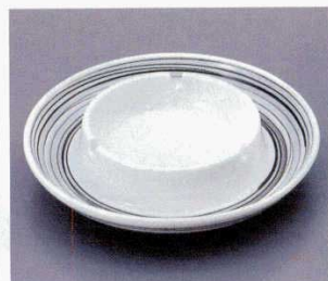
51619-204 ウズ安全型六寸灰皿 1,600円 30入 (20.5×4.8cm) 51620-204 ウズ安全型五寸灰皿 1,100円 50入 (17×3.5cm)