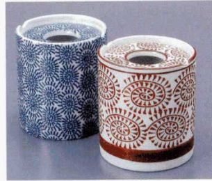
51612-454 タコ唐草灰皿 1,800円 10×8入 (8.2×9cm) 51613-454 マイマイ切立灰皿 1,900円 1×30入 (8×9cm)