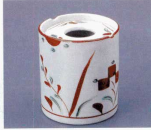
51614-454 赤絵花灰皿 2,000円 30入 (8×9cm)