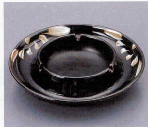
51623-204 天目菊安全型六寸灰皿 1,600円 30入 (20.5×4.8cm) 51624-204 天目菊安全型五寸灰皿 1,100円 50入 (17×3.5cm)