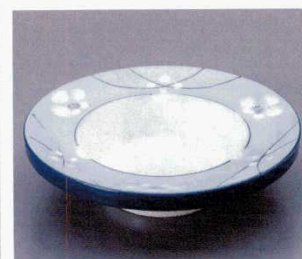
51633-204 浅口白梅六寸灰皿 1,150円 30入 (18.5×5.3cm) 51634-204 浅口白梅五寸灰皿 630円 60入 (16.3×4.5cm)