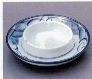
51621-204 ぶどう安全型六寸灰皿 1,600円 30入 (20.5×4.8cm) 51622-204 ぶどう安全型五寸灰皿 1,100円 50入 (17×3.5cm)