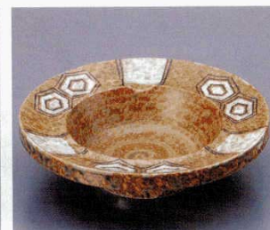
51635-204 織部亀甲浅口六寸灰皿 1,250円 30入 (18.5×5.3cm) 51636-204 織部亀甲浅口五寸灰皿 720円 60入 (16.3×4.5cm)