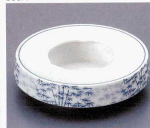
51637-544 竹林6.0灰皿 2,000円 36入 (18.5×5.5cm) 51638-544 竹林5.0灰皿 1,050円 48入 (15×4.7cm) 51639-544 竹林4.5灰皿 850円 60入 (13.5×3.5cm)