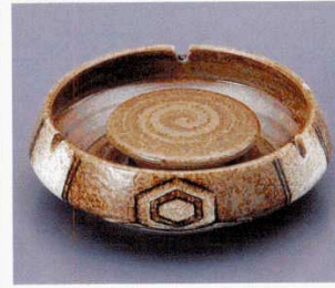
51627-204 織部亀甲ヘソ付五寸灰皿 1,400円 40入 (16×5cm)