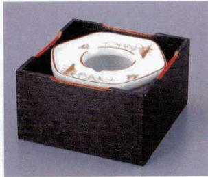
51607-454 一輪花六角灰皿 2,000円 6×6入 (11.8×13cm) 51608-454 木箱 1,300円 60入 (12.6×12.6×7cm)