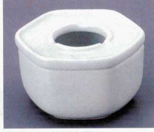
51616-454 青地六角灰皿 1,150円 6×8入 (11.4×6.5cm)