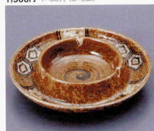
51617-204 織部亀甲安全型六寸灰皿 1,850円 30入 (20.5×4.8cm) 51618-204 織部亀甲安全型五寸灰皿 1,400円 50入 (17×3.5cm)