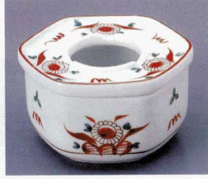
51615-454 赤絵花灰皿 2,050円 40入 (11.5×6.1cm)