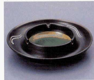
51625-204 みどり安全型六寸灰皿 1,850円 30入 (20.5×4.8cm) 51626-204 みどり安全型五寸灰皿 1,400円 50入 (17×3.5cm)