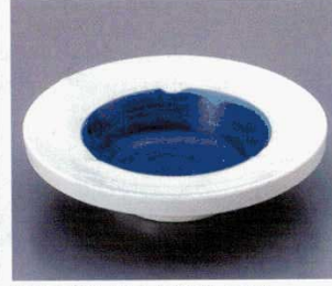
51629-204 浅口ゴス巻六寸灰皿 1,150円 30入 (18.5×5.3cm) 51630-204 浅口ゴス巻五寸灰皿 590円 60入 (16.3×4.5cm)