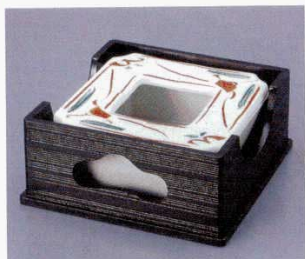
51601-254 万曆灰皿 2,180円 40入 (13.5×5.8cm) 51602-254 灰皿ケース 1,600円 60入 51603-254 万曆蓋付ケース付灰皿 3,780円 40入 (ケース15×15×6.8cm)