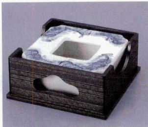
51604-254 山水灰皿 1,980円 40入 (13.5×5.8cm) 51605-254 灰皿ケース 1,600円 60入 51606-254 山水蓋付ケース付灰皿 3,580円 40入 (ケース15×15×6.8cm)