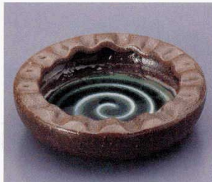
51713-404 信楽ガラス灰皿 850円 50入 (12.8×3.5cm)