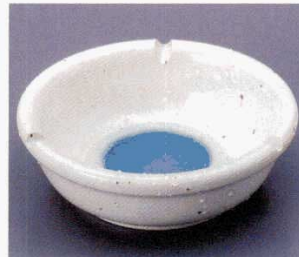
51714-314 梨地ブルー灰皿(大) 730円 80入 (13.5×4cm) 51715-314 梨地ブルー灰皿(小) 560円 100入 (10.6×3.5cm)