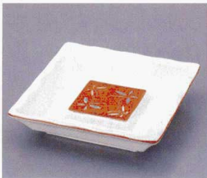
51707-434 赤ちよう6.0灰皿 2,250円 60入 (16×3.3cm) 51708-434 赤ちよう5.0灰皿 1,700円 80入 (13.4×3.3cm)