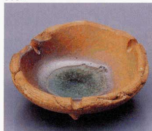
51720-454 ひねり備前(大)灰皿 680円 40入 (14.6×4cm)