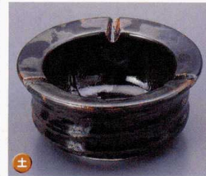
51711-234 天目朝顔4.0灰皿 1,150円 45入 (12.5×5.8cm)