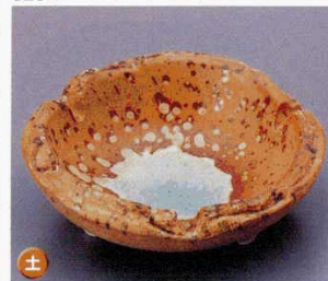
51721-304 ひねり茶備前吹ガラスブルー灰皿(中) 640円 80入 (11×4cm)