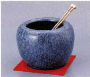
51701-664 生子釉火鉢型灰皿セット(信楽焼) 4,100円 (14×10cm)