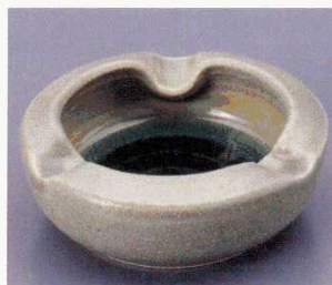
51725-124 ドーム型灰皿(小) 570円 60入 (11×3.7cm)