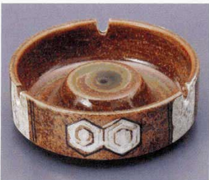
51718-204 織部亀甲ナルミ型四寸灰皿 650円 50入 (13×4cm)