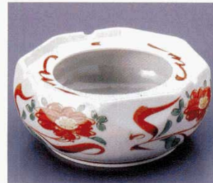
51703-134 赤絵万暦5.0灰皿 2,450円 30入 (15.5×15.5×6cm) 51704-134 赤絵万暦4.0灰皿 2,050円 40入 (12×12×6cm)