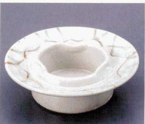
51722-524 糸吹うのふ灰皿(大) 680円 100入 (12.2×3.3cm) 51723-524 糸吹うのふ灰皿(小) 620円 120入 (10.5×2.5cm)