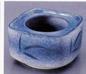
51705-114 吹量芦角(大)灰皿 1,650円 24入 (15×15×9cm) 51706-114 吹量芦角(小)灰皿 1,150円 40入 (11.5×11.5×7cm)