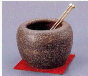
51702-664 窯肌火鉢型灰皿セット(信楽焼) 4,100円 (14×10cm)