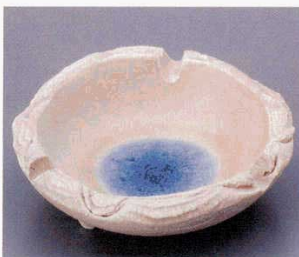
51724-454 ひねりピンク(中)灰皿 580円 50入 (11×3.8cm)