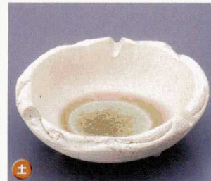
51716-234 ひねり(大)無釉グリーン灰皿 700円 60入 (14×4.8cm) 51717-234 ひねり(中)無釉グリーン灰皿 620円 80入 (11.5×3.5cm)