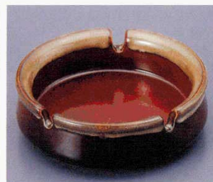
51726-404 赤流(大)灰皿 500円 80入 (11.5×3.5cm) 51727-404 赤流(小)灰皿 370円 100入 (10.5×2.8cm)