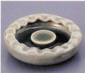
51712-314 唐津丸灰皿 860円 60入 (12.5×3.5cm)