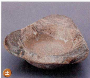
51719-514 錆三角灰皿 700円 40入 (12.5×4cm)