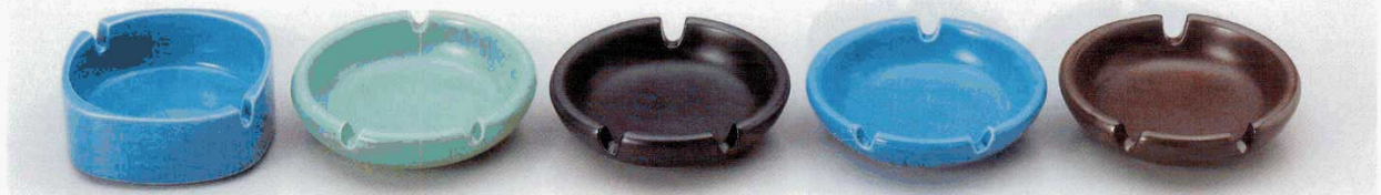
52011-404 四角ブルー灰皿 430円 80入 (9.6×3.7cm)