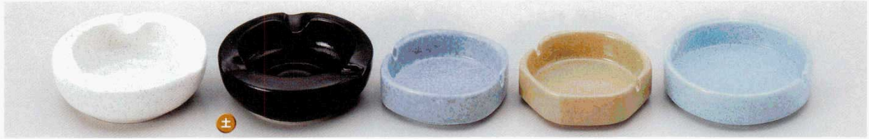
52005-454 ア×釉丸灰皿 630円 100入 (11×2cm)