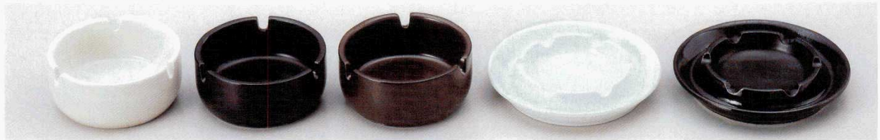
52016-404 三ツ切アイボリー灰皿 410円 100入 (9.5×4.2cm)