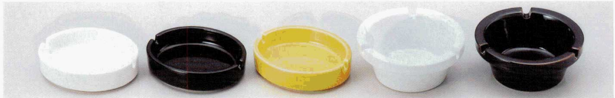
52021-434 白夕門灰皿 320円 100入 (10.5×8.6×2.6cm)