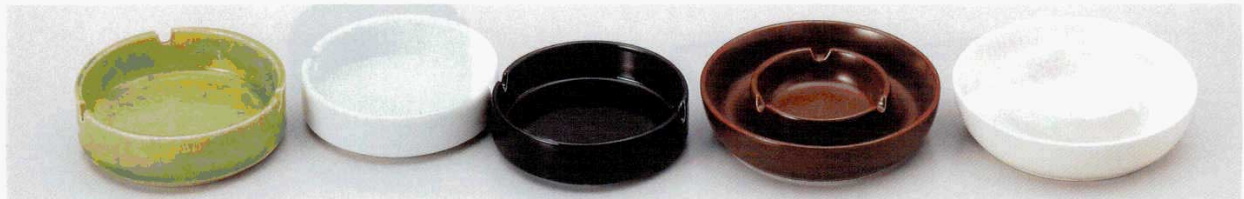
52026-104 菜の花切立灰皿 400円 80入 (11.2×3.5cm)