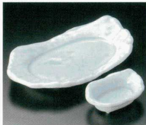
05327-024 青白磁石焼刺身皿 1,200円 60入 (21×12×3cm) 05328-024 青白磁石焼千代久 480円 200入 (9.5×6.3×2.5cm)