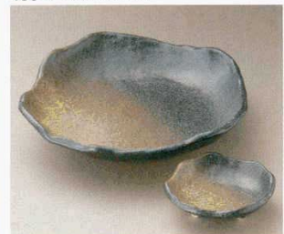
05339-294 黒備前三ツ足刺身皿 1,000円 40入 (20×19×4.8cm) 05340-294 黒備前三ツ足千代口 260円 180入 (9×9×2.9cm)