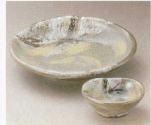
05323-104 備前桜刺身 2,300円 50入 (18.3×17.4×4.5cm) 05324-104 備前桜千代久 1,200円 100入 (8.5×8×3.3cm)