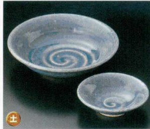
05311-304 藍染ウス刺身 1,350円 40入 (15.8×4.5cm) 05312-304 藍染ウス千代久 630円 150入 (9.5×2.7cm)