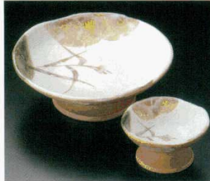
05303-104 織部スキ高台刺身鉢 1,350円 40入 (15.5×5.3cm) 05304-104 織部スキ高台千代久 500円 120入 (8×4cm)