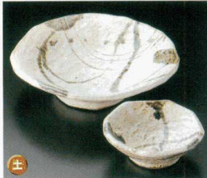
05301-174 織部散平鉢 1,240円 50入 (17×16.5×4.5cm) 05302-174 織部散千代久 570円 150入 (9.5×3.5cm)