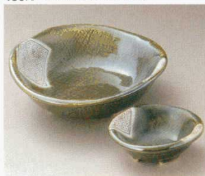
05335-184 織部格子ひねり刺身鉢 1,130円 30入 (16.5×15×4.5cm) 05336-184 織部格子ひねり千代久 450円 120入 (9×8.2×3cm)