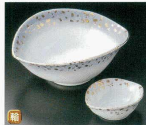
05329-284 笹形紫吹金箔刺身鉢 1,200円 30入 (16.5×13.8×6.3cm) 05330-284 笹形紫吹金箔千代久 380円 120入 (8.3×6.8×2.8cm)