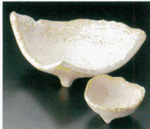
05317-024 桃山21cm三角鉢 1,300円 40入 (20.7×16×8cm) 05318-024 桃山8.5cm三ツ足小付 450円 150入 (8.5×8×4.3cm)