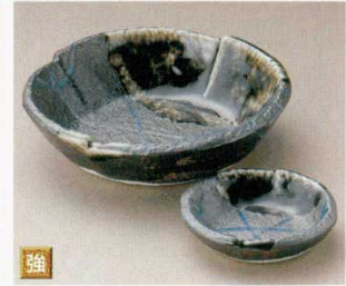
05315-524 南蛮乱十草刺身鉢 1,350円 60入 (14.7×4cm) 05316-524 南蛮乱十草千代久 430円 160入 (8.5×2cm)