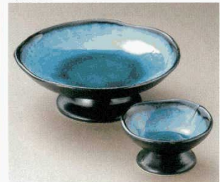
05331-234 ぎやまん高台皿(大) 1,150円 36入 (15×5cm) 05332-234 ぎやまん高台千代久 400円 150入 (8×4cm)