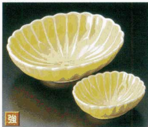
05325-434 黄菊型タ円刺身 1,200円 60入 (15.7×12.2×4.6cm) 05326-434 黄菊型タ円千代久 460円 300入 (9.1×7.5×3.1cm)