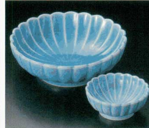
05305-434 トルコ菊型5.0鉢 1,250円 80入 (15.5×5.1cm) 05306-434 トルコ菊型千代久 420円 300入 (8×3.5cm)