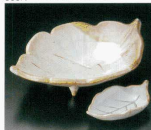
05337-544 葉形ヌリ分志野三ツ足刺身鉢 1,150円 60入 (19.8×13.7×3.5cm) 05338-544 葉形ヌリ分志野千代久 370円 200入 (9.5×6×2cm)