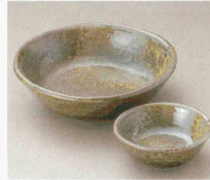
05313-524 南蛮オリベ刺身鉢 1,360円 40入 (15.4×4cm) 05314-524 南蛮織部掛3.0丸井 500円 160入 (8.7×2.7cm)