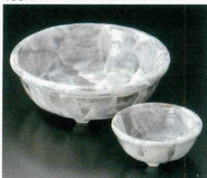
05333-314 化粧刷毛三ツ足刺身 1,100円 (16.5×5.5cm) 05334-314 化粧刷毛三ツ足千代久 540円 (9×3.5cm)