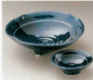
05319-164 海碧三ツ足平鉢 1,300円 50入 (18.5×5.5cm) 05320-164 海碧千代久 340円 200入 (8.8×3cm)