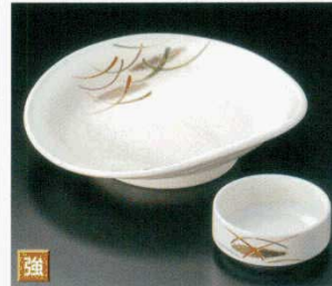
05321-114 武蔵野小判形向付 1,250円 40入 (16.8×14.3×3.8cm) 05322-114 武蔵野丸千代久 670円 200入 (6.5×2.7cm)