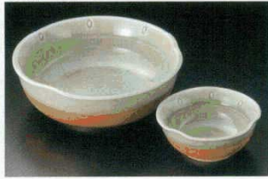
05511-124 若草刺身鉢 830円 50入 (14.5×5cm) 05512-124 若草千代久 280円 150入 (8.7×3.8cm)