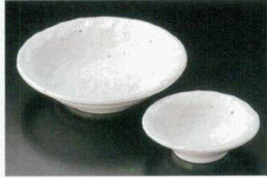
05521-024 石目粉引5.5浅鉢 580円 90入 (16.5×4cm) 05522-024 石目粉引3.3浅鉢 340円 160入 (11×3cm)