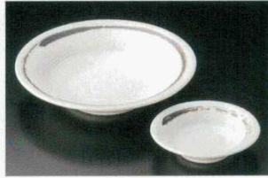
05527-574 凧風墨5寸深皿 450円 (15.8×3cm) 05528-574 凧風墨3寸深皿 280円 (9.1×2cm)