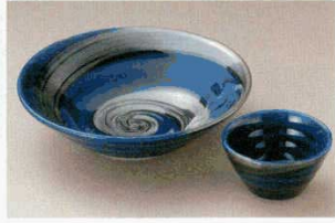
05515-274 銀彩ブルー5.0鉢 550円 80入 (16.7×4.2cm) 05516-274 銀彩ブルーリップ碗(ブチ) 380円 160入 (7.4×4cm・70cc)