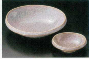
05531-134 窯変ピンクひねり鉢 420円 (16×4.2cm) 05532-134 窯変ピンクひねり千代久 260円 (9.1×2.8cm)