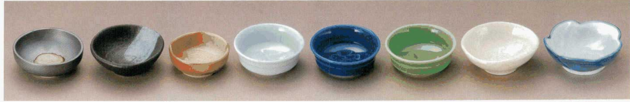
05541-264 鉄釉切立珍味皿 350円 200入 (8×2.7cm)