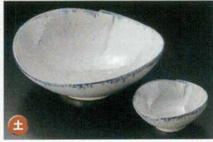
05513-304 新呉須丸合せ中鉢 670円 100入 (14.8×14.5×5cm) 05514-304 新呉須丸合せ珍味 320円 150入 (7×6.8×2.8cm)