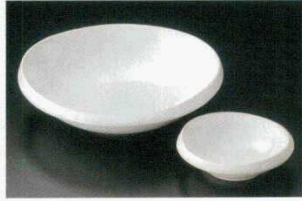
05529-134 白雲ひねり鉢 420円 (16×4.2cm) 05530-134 白雲ひねり千代久 260円 (9.1×2.8cm)