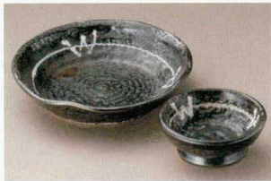
05503-114 黒茶Vライン5.0浅鉢 730円 60入 (15.5×3.5cm) 05504-114 黒茶Vライン千代久 370円 150入 (8.5×3.5cm)