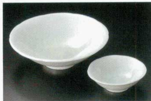
05501-024 もえぎ刺身鉢 750円 80入 (15×4.3cm) 05502-024 もえぎ千代久 300円 200入 (8.5×3cm)