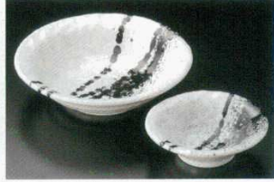
05523-274 吹あそび石目5.0鉢 680円 80入 (16.5×4.3cm) 05524-274 吹あそび石目3.3鉢 360円 160入 (11×3cm)