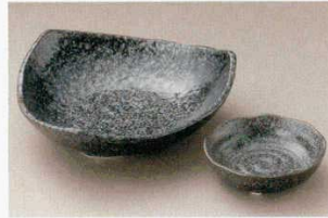
05517-204 油滴三角刺身皿 500円 48入 (16×16.5×5.5cm) 05518-204 油滴三ツ足千代久 250円 120入 (9.2×2.8cm)