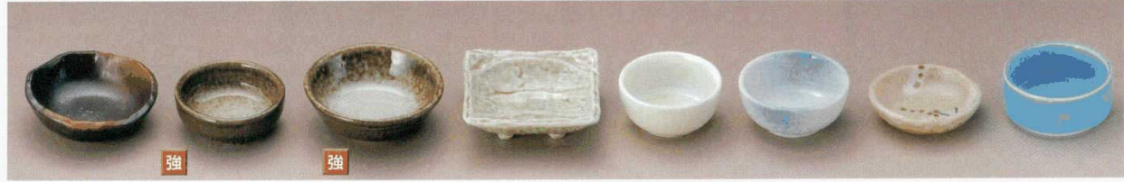
05533-454 焼丸千代久 580円 120入 (8.4×2.8cm)