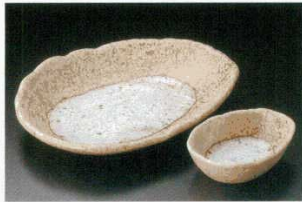
05505-564 伊賀帯7.0変型皿 750円 40入 (20.5×16×3cm) 05506-564 伊賀帯変型千代久 290円 180入 (9.6×7.8×2.5cm)