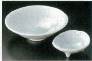
05507-024 青白磁岩清水刺身鉢 720円 80入 (15×4.5cm) 05508-024 青白磁岩清水千代久 360円 200入 (8.8×3.3cm)