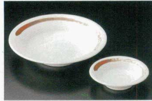
05525-574 凧風紅5寸深皿 450円 (15.8×3cm) 05526-574 凧風紅3寸深皿 280円 (9.1×2cm)