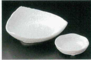
05519-204 白スバタ三角刺身皿 500円 48入 (16×16.5×5.5cm) 05520-204 白スバタ三ツ足千代久 250円 120入 (9.2×4.8cm)