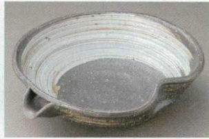
05808-664 炭化刷毛目片口向付 (信楽焼) 3,300円 (17.5×15.5×4cm)