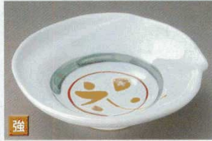
05802-144 花の字向付 3,500円 30入 (17.5×4.8cm)