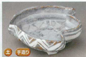
05824-144 志野織部ツタ向付 3,300円 40入 (14×12.5×4cm)