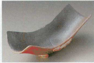
05806-314 備前長角向付 3,300円 30入 (24.4×10.6×9.1cm)