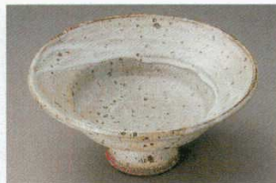
05818-664 灰みかけ高台鉢 (信楽焼) 3,200円 (15×6cm)