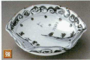
05801-144 染付六角山水向付 3,800円 30入 (16.5×7.6cm)