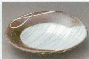
05823-254 灰マツ線堀向付 3,000円 100入 (16×3.2cm)