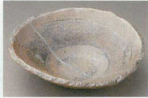
05812-664 炭化ボタモチ6.0楕円鉢 (信楽焼) 3,200円 (18×16.5×5.5cm)