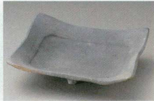
05816-664 炭化長角向付 (信楽焼) 3,150円 (17.5×14×4.5cm)