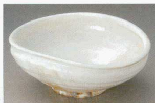
05821-664 粉引楕円鉢 (信楽焼) 3,520円 (16×13×6cm)