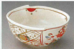
05820-294 筆洗赤絵向付 3,000円 60入 (14.7×11.4×6.3cm)