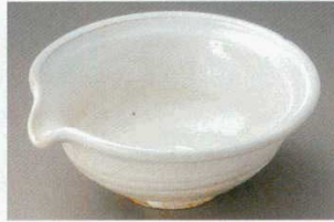
05810-664 粉引片口鉢 (信楽焼) 3,300円 (15×14.5×6cm)