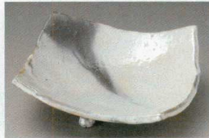
05814-664 白化粧ほかし三ツ足変型角皿 (信楽焼) 3,100円 (16.5×16×5cm)