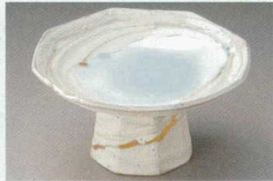
05815-144 湖水青白八角高台鉢 3,100円 20入 (17×16.2×8.5cm)