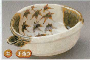
05811-144 オリベ鉄絵片口向付 3,200円 30入 (15.5×12.5×7cm)