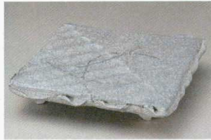
05809-664 黒窯変そぎ足付角皿 (信楽焼) 3,300円 (16×16×3cm)