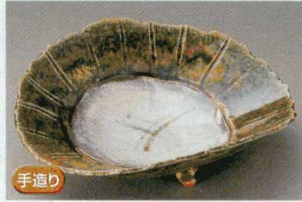
05803-184 オリベちぎり向付 (手造り) 3,500円 40入 (16.5×15.5×4.5cm)