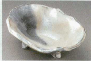
05804-664 白化粧ほかし三ツ足変型鉢 (信楽焼) 3,400円 (18.5×13.5×5.5cm)