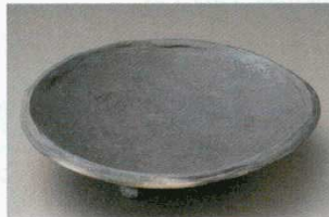
05813-664 炭化6.0三ツ足丸皿 (信楽焼) 3,150円 (17.5×3.5cm)