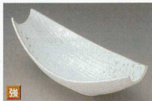
05817-524 金吹雪向付 3,000円 40入 (22.8×10×7cm)