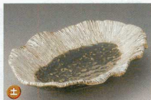
05822-144 織部十草花型楕円皿 3,100円 30入 (27×16×5cm)