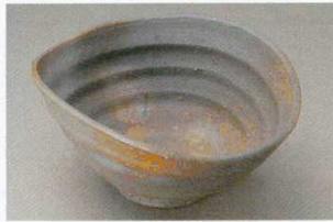
05805-664 炭化窯変5.3楕円鉢 (信楽焼) 3,410円 (16×13.5×6.5cm)