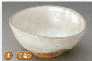
05819-514 粉引楕円向付 3,500円 40入 (15.5×12.5×6.5cm)