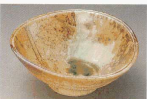
06321-664 古信楽5.3小判鉢(信楽焼) 2,000円 (6×14×5.8cm)