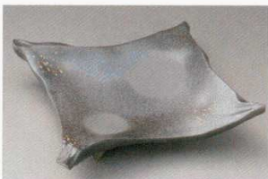
06313-134 炭化土ちぎり向付 2,100円 50入 (20.8×19×4.8cm)