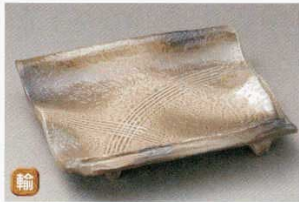
06305-144 南蛮硝折り重ね皿 2,150円 40入 (15×13×3cm)