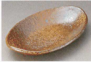
06301-454 灰吹楕円皿 2,150円 60入 (20.5×12×3cm)