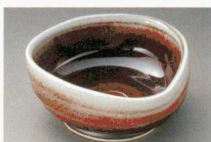
06324-264 辰砂手びねり三角向付 2,000円 40入 (15.3×15.3×6.7cm)