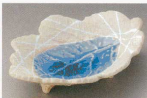
06314-114 見込ブルー木の葉刺身 2,000円 60入 (21×14×5cm)