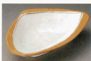
06320-184 金たたく向付 2,200円 30入 (21×14×4cm)