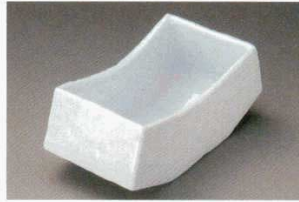
06302-174 白釉石面変形長角面付 2,230円 30入 (15×8×6.8cm)