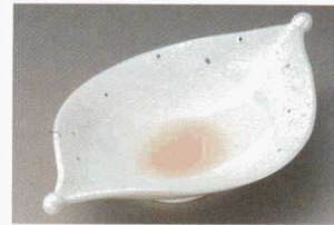
06304-144 ラスターオレンジ吹皿 2,100円 40入 (23.5×13.5×4.5cm)