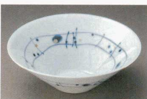
06317-514 よろけ格子銀彩5.0鉢(手描き) 2,000円 60入 (15.5×5.2cm)