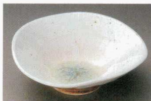
06315-294 ビード口渦5.0平鉢 2,150円 40入 (16×5cm)