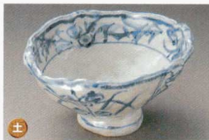
06310-174 藍染間取花5.0高台鉢 2,080円 40入 (15.5×14.2×8.6cm)