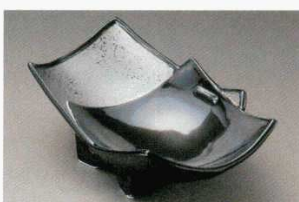
06323-114 プラチナブラック重ね鉢 2,100円 (18.5×11.5×6.5cm)