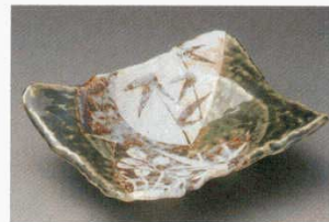
06308-294 織部草花長皿 2,150円 80入 (16×13×4cm)