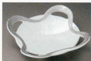
06316-174 NBプラチナリボン向付 2,020円 40入 (16×4cm)