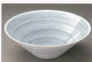
06319-514 千筋5.0鉢(手描き) 2,000円 60入 (15.5×5.2cm)