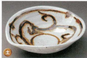
06306-444 あめ唐草貝型向付 2,100円 40入 (17.5×16×6cm)