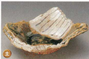
06309-174 織部細十草長角6.0向付 2,100円 40入 (17.5×14.5×6.5cm)