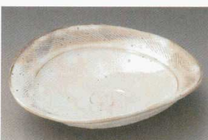
06322-294 粉引櫛目夕円和皿 2,000円 30入 (19.5×18.2×4.5cm)