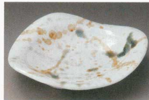
06307-474 夢幻変形6.5皿(軽量強化) 2,100円 30入 (20×18.3×4.2cm)