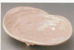
06318-164 紅志野合せ貝 2,000円 60入 (18.3×13.2×3.8cm)