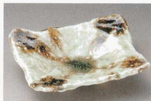
06311-254 灰釉流し角向付 2,050円 60入 (16.5×13.5×4cm)