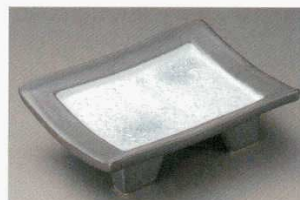
06312-174 ラスター珍珠ブルー花高台皿 2,130円 40入 (16×11.4×4.3cm)