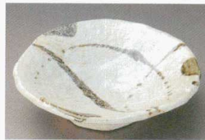
06503-294 織部散し平鉢 1,450円 40入 (17.3×16.3×4.5cm)