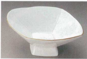
06505-104 和 blanc 菱型高台鉢(大) 1,450円 30入 (20.8×16.9×7.9cm)