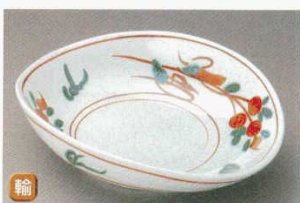
06520-474 赤絵小判型向付 1,500円 36入 (16.1×13.3×4.3cm)