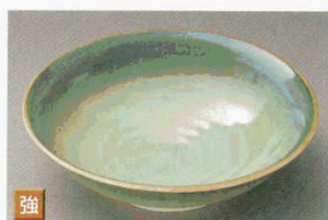
06512-554 緑彩向付 1,400円 50入 (15.7×4.3cm)