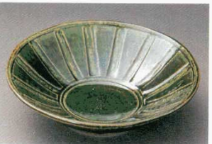
06521-174 総織部しのぎ5.5平鉢 1,680円 60入 (17×4.5cm)