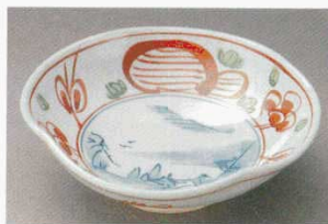
06507-494 赤絵山水5.0鉢 1,400円 (14.6×5.2cm)