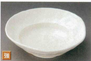
06509-554 クリーム向付 1,550円 40入 (15.7×4.8cm)