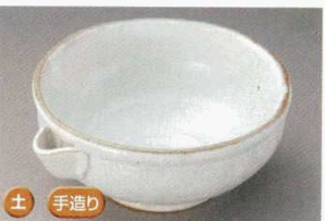
06522-104 粉引片口鉢 1,600円 40入 (18.2×14.2×6.2cm)