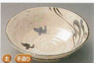
06524-104 波千鳥向付 1,650円 40入 (15.7×5cm)