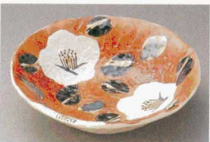
06513-524 赤濃山茶花5.0鉢 1,780円 60入 (15.5×3.6cm)