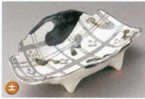
06501-114 黒織部木甲形前菜皿 1,400円 40入 (19.5×13.5×5cm)