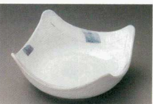
06523-204 紫式部5寸四方鉢 1,600円 40入 (15.7×15.7×6.2cm)