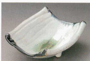
06511-254 かいらぎ両切向付 1,600円 40入 (17×15×7cm)