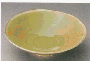
06515-734 四軸金緑平小鉢(有田焼) 1,500円 5×16入 (15.5×4.5cm)