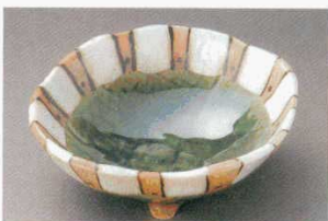
06510-104 織部十草三ツ足向付 1,500円 50入 (14.5×14×6cm)