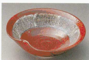
06516-444 結晶マグナ手押し向付 1,750円 40入 (16.5×15×5.6cm)