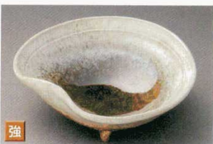
06514-574 織部かすみ片押し三ツ足5.0鉢 1,700円 40入 (15×13×4.5cm)