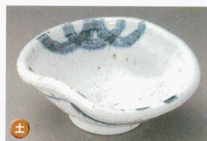
06508-294 カイラギニ方なぶり小鉢 1,450円 40入 (15.8×13.5×6.3cm)