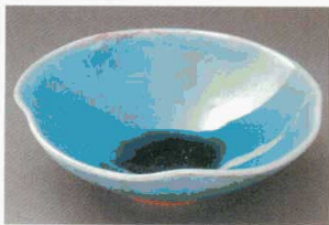
06506-234 深海トルコ梅型平鉢 1,720円 80入 (14.5×4.7cm)