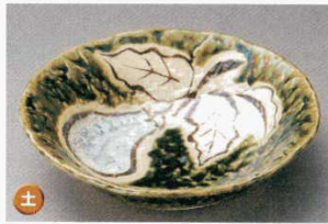
06502-514 織部ナス平鉢 1,400円 40入 (15.2×3.8cm)