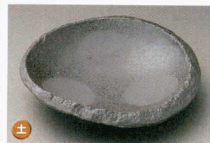
06504-134 炭化土丸向付 1,450円 30入 (19×18.2×4.2cm)