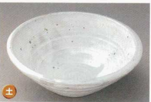
06517-314 黒いぶし潤厚中鉢 1,500円 60入 (16.5×16×5.5cm)