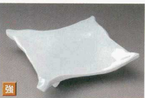
06518-244 強化青白磁ちぎり向付 1,760円 50入 (19.5×18×5cm)