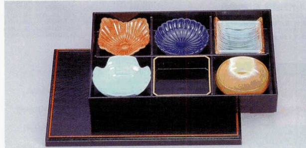
[A] ニューR3寸長手木目松花堂黒天朱 68829-804 [A] オヤ・フタ・6ツ仕切 3,700円 (38.5×26.5×6.5cm) 68830-804 [A] 菊四方上り鉢 柿柚 1,020円 (10.7×10.7×4.5cm) 68831-804 [TA] ABS3.8寸菊鉢 瑠璃 700円 (11.3φ×3.3cm) 68832-804 [A] 竹割り皿 清流 1,550円 (11.2×10.1×3.5cm) 68833-804 [A] 四ツ山小鉢 青磁 800円 (11.8×11.8×4.2cm) 68834-804 [A] 隅切透かし鉢 黒天金 1,350円 (11.3×11.3×4cm) 68835-804 [A] タイコ丸鉢 若草織部 1,100円 (11φ×3.9cm)