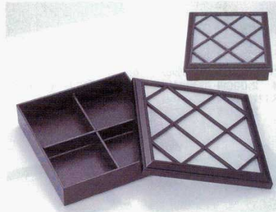
68825-804 [A] 8.5寸松花堂用障子蓋 黒 2,350円 (26×26×2cm 内寸25×25cm) 68826-804 [A] 8.5寸新布目松花堂 身 黒 1,100円 (24.5×24.5×5.8cm) 68827-804 [A] 8.5寸松花堂用十字仕切 280円