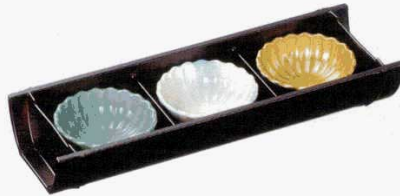
68803-804 [A] 竹取盛器 三点盛りスス竹 3,200円 (29.8×10.1×4.8cm) 68804-804 [A] 2.6寸菊型鉢 ヒワグリーン 540円 (8φ×3.2cm) 68805-804 [A] 2.6寸菊型鉢 吹墨 700円 (8φ×3.2cm) 68806-804 [A] 2.6寸菊型鉢 金雅 1,200円 (8φ×3.2cm)