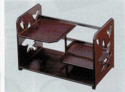
68828-804 [A] 花御膳 溜 4,100円 (25.2×13.7×16.7cm)