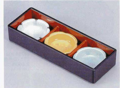
68816-804 [A] (小) 三点珍味入れ 黒内朱 (固定仕切) 1,050円 (19.3×6.8×3.7cm) 68817-804 [陶] 梅豆皿 古染立筋 675円 (5.8φ×1.8cm) 68818-804 [陶] 梅豆皿 黄 675円 (5.8φ×1.8cm) 68819-804 [陶] 梅豆皿 トルコ 675円 (5.8φ×1.8cm)