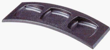
68801-804 [A] 3連珍味台 新黒石目 (大) 1,950円 (27.3×10.3×4cm) 68802-804 [A] 3連珍味台 新黒石目 (小) 1,700円 (24.5×9.3×3.5cm)