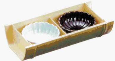
68807-804 [A] 竹取盛器 二点盛り 若竹 2,900円 (21×10.1×4.8cm) 68808-804 [A] 2.6寸菊型鉢 青磁 540円 (8φ×3.2cm) 68809-804 [A] 2.6寸菊型鉢 溜 540円 (8φ×3.2cm)