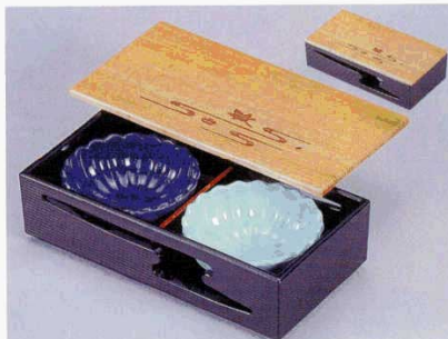
68810-804 [A] 時勢盛器 黒内塗 (ワカシ) 1,850円 (18.1×9.1×4.8cm) 68811-804 [A] 2ツ仕切 黒天朱 750円 (16.7×7.9×3cm) 68812-804 [A] 2.6寸菊型鉢 瑠璃 540円 (8φ×3.2cm) 68813-804 [A] 2.6寸菊型鉢 青磁 540円 (8φ×3.2cm) 68814-804 [木] 6寸長角用杉蓋 波巻秋 2,050円 (18×9×0.5cm)