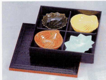
[A] 8.5寸木目松花堂黒瀝朱 68820-804 [A] オヤ・フタ・十字仕切 1,700円 (26×26×6cm) 68821-804 [A] 楓皿 織部 910円 (10.8×11.2×2.8cm) 68822-804 [A] 貝型鉢 淡黄 910円 (11.9×11.4×3.2cm) 68823-804 [A] ABSオニオン鉢 柿柚 910円 (11.3×11.3×3.8cm) 68824-804 [A] 重ね紅葉皿 青磁 960円 (13.2×10.4×3.3cm)