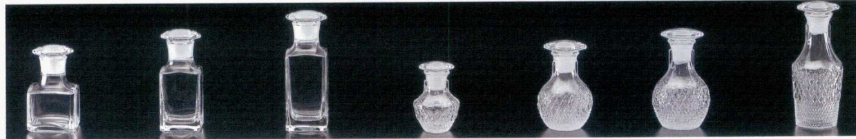
73721-61A4 F-70610クリスタル正油入 1,150円 内6入 (6.2×10cm・135cc) 73722-61A4 F-70809クリスタル正油入 1,150円 内6入 (5×11.3cm・120cc) 73723-61A4 F70711クリスタルソース入 1,250円 内6×10入 (5×14.5cm・175cc) 73724-61T4 NT208クリスタル豆正油入 790円 内12入 (8cm・65cc) 73725-61T4 NT210クリスタル正油入 1,050円 内6×8入 (10.8cm・125cc) 73726-61T4 NT209クリスタル正油入大 1,080円 内6×8入 (12cm・135cc) 73727-61T4 NT211クリスタルソース入 1,100円 内6×8入 (15.3cm・120cc)