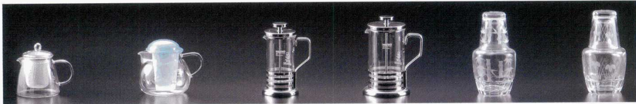
73701-614 CHEN-36T耐熱ピュアティーポット 2,000円 内1×24入 (13.3×11.8cm・360cc) 73702-614 CHY-65NBU耐熱茶々ポット 2,500円 内1×24入 (15.4×12.8cm・650cc) 73703-614 THJ-2SV耐熱ハリオール 2,500円 内1×12入 (8.7×16.6cm・300cc) 73705-614 THJ-4SV耐熱ハリオール 3,000円 内1×12入 (11.3×18.3cm・600cc) 73707-61T4 60-75冠水瓶竹 2,800円 内1×30入 (19.3cm・650cc) 73708-61T4 60-77あやめ切り冠水瓶 2,800円 内1×30入 (19.3cm・650cc)