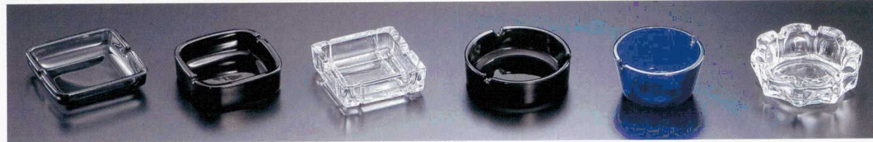
73728-61T4 54008SS灰皿 230円 内1×72入 (10×2.5cm) 73729-614 P05536BKスクエア-灰皿 360円 内1×96入 (9.5×3cm) 73730-61S4 M75W灰皿 350円 内1×96入 (9×2.9cm) 73731-61T4 P05513BK灰皿 360円 内1×72入 (10.5×3.3cm) 73732-61T4 P05581DBフィナル灰皿 300円 内1×72入 (9×5cm) 73733-61T4 P05533Wローラー灰皿(小) 260円 内1×60入 (11×4.1cm)