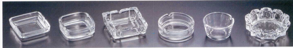
73734-61T4 54008W灰皿 210円 内1×72入 (10×2.5cm) 73735-61T4 P05536Wスクエア-灰皿 240円 内1×96入 (9.5×3cm) 73736-61S4 M76W灰皿 450円 内1×60入 (10.5×3.4cm) 73737-61T4 P-05513W灰皿 240円 内1×72入 (10.5×3.3cm) 73738-61T4 P05581Wフィナル灰皿 300円 内1×72入 (9×5cm) 73739-61T4 P05532Wローラー灰皿(中) 340円 内1×30入 (13.4×4.1cm)