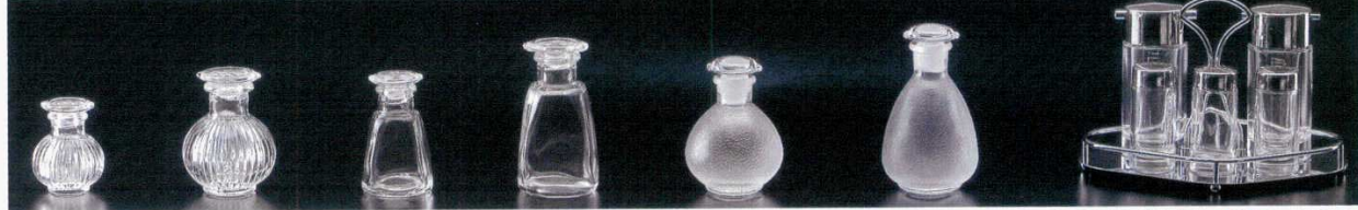
73709-604 菊豆正油スキ 530円 6入 (5.2×6.5cm・35cc) 73710-604 菊大正油スキ 720円 6入 (6.6×8.5cm・90cc) 73711-604 昔豆正油 660円 12入 (5×8.4cm・60cc) 73712-604 昔中正油 720円 12入 (5.6×10.9cm・130cc) 73713-61A4 NT245正油入(小) 860円 内6入 (10cm・100cc) 73714-61A4 NT246正油入(大) 970円 内6入 (11.7cm・125cc) 73715-604 87S-スース(スチ) 2,200円 6入 (4.6×11.4cm・100cc) 73716-604 87S-正油(スチ) 2,000円 6入 (4.6×11.4cm・100cc) 73717-604 87S-スース(スチ) 820円 6入 (3.1×7.2cm・30cc) 73718-604 87S-スース(スチ) 820円 6入 (3.1×7.2cm・30cc) 73719-604 87S-スース(スチ) 820円 12入 (3.1×7.2cm・30cc) 73720-604 カスター-9H-1 5,200円 11 (19.4×4.9×13.5cm)