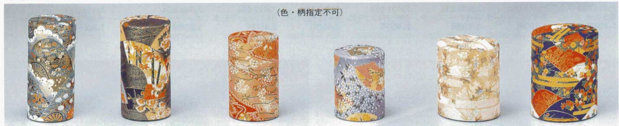
74017-834 和紙茶筒長200g 970円 50入 (φ7.5×15.5cm) 色・柄指定不可