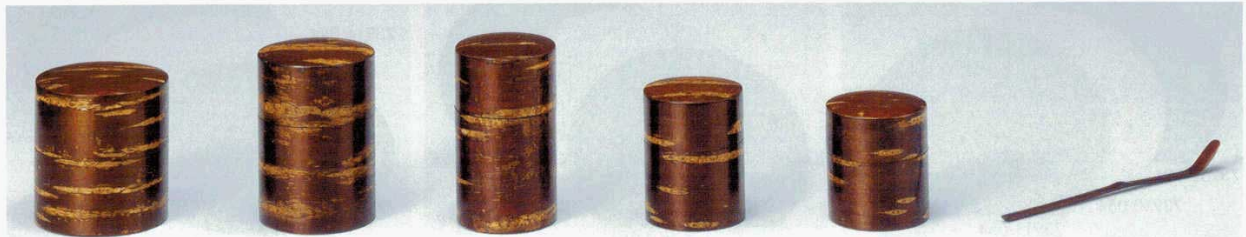
74007-834 桜皮総皮茶筒(中平)色出し 7,800円 20入 (φ8.2×9cm)