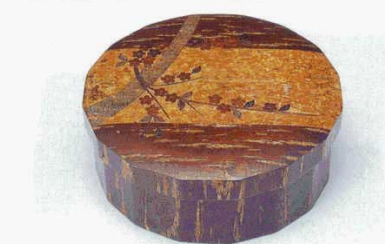
74015-834 桜皮十六角茶櫃桜 33,000円 6入 (φ30.5×12cm)