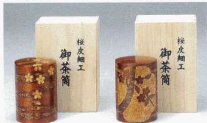
74013-834 桜皮総皮茶筒(大)桜花 桐箱入 13,000円 20入 (φ8.2×12cm)