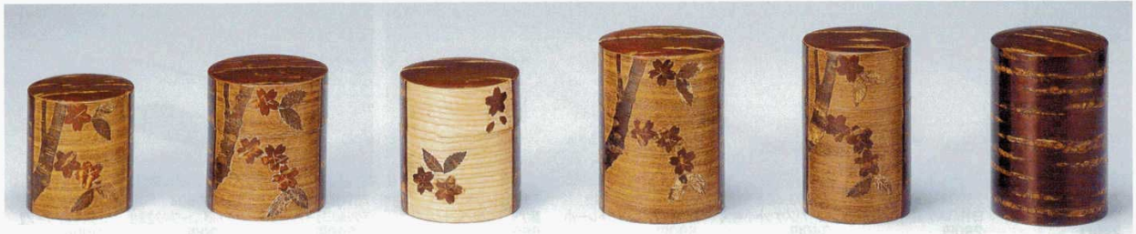
74001-834 桜皮平30匁茶筒桜 2,900円 30入 (φ7.5×8cm)